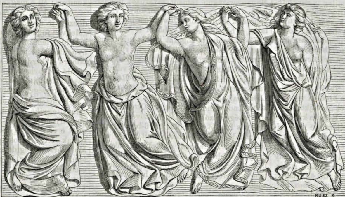
Alexy szoboresportozata. I. (A pesti új redoute-épület oszlopain.)

A hatóság ezen ajánlatot szívesen vette s pedig annyival inkább, mert a brünni hadonok, főleg a szökék, a veszélyes candidatiótól rettegven, nyakrafőre siettek a sárkány gyomrába utat nyitó egyetlen sine qua non-tól mihamarább megszabadulni. — Wachmann tehát pár napig egymásután csalétkül kitett eleven borjakkal ingerelte a fenevad étvágát, mire ez negyed napra a borjút csakugyan fel is falta. Ötöd napon