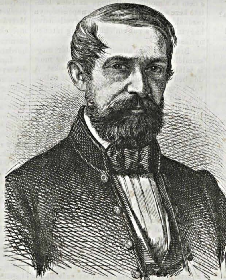
GRÓF BETHLEN JÁNOS.

Legelső nyilvános föllépése 1834-re esik. Mikor már lehetett észrevenni, hogy az alkotmányhoz szorosan ragaszkodó országgyűlésnek nem sikerül az országgyűlést s az ország törvényes állapotba visszahelyezését kivívni: Udvarhelyszéken azt indítványozta, hogy ha az országgyűlés az adó elintézése és a főhivataloknak törvény szerinti választás által betöltése nélkül oszlattatnék el, a más uton kivetendő adót