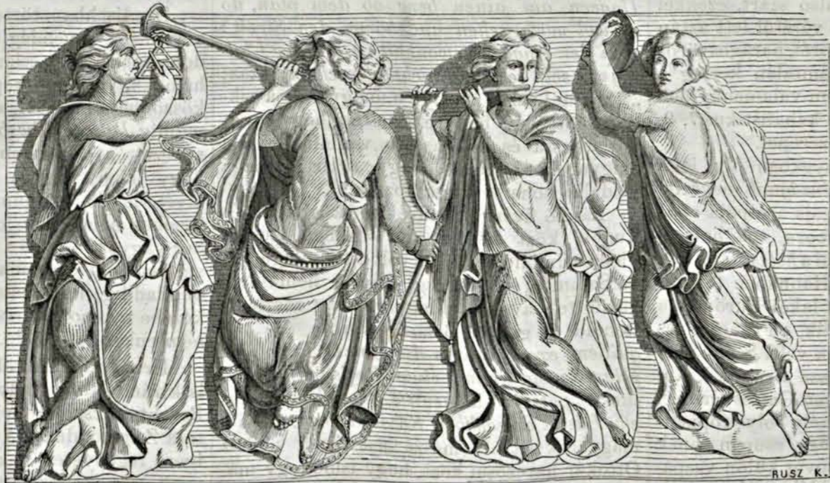
Alexy szoboresportozata. II. (A pesti új redoute-épület oszlopain.)

En nagyon hiszékeny arczczal hallgatam a városi poroszlót, ki nekem a brünni