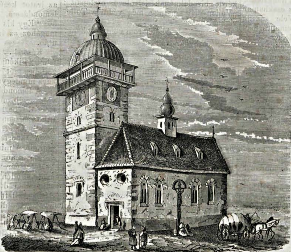
Szepes-Olaszi-i városi torony s régi kis templom.

készült dörzsetet — talán nyirkos czukorsüveg papiroson — küldene. Az őtől a legcalább szám, és az egyeshez igen hasonlít. De itt dönt a) az írás maga, mely későbbkori; b) maga a harang képe alakja.