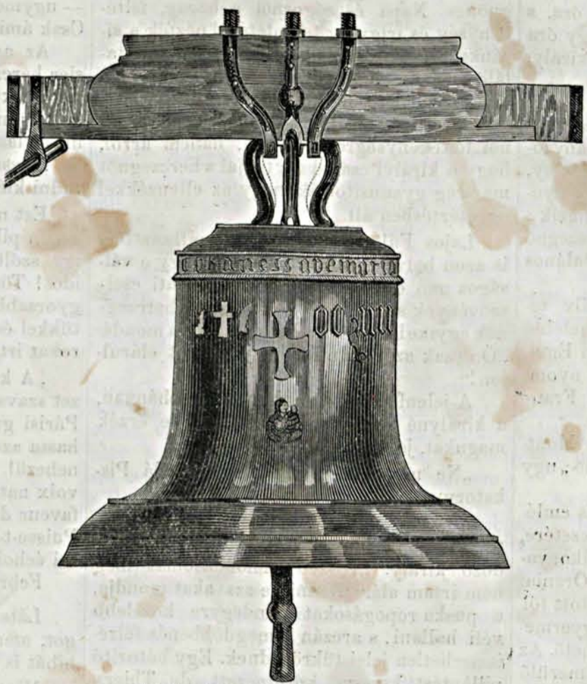
A privigyei régi harang.

szébb magánépítményei közé fognak tartozni. — E két palota a múzeum hátulós részével párhuzamosan, a lovardával egy sorban, az utóbbinak két oldalán terül el. Az egyik a gr. Károlyi-féle palota, melyet néhai gr. Károlyi Lajos kezdet két évvel ezelőtt építtetett, s mint örömmel halljuk, most az időközben elhalt birtokos-fia, gr.