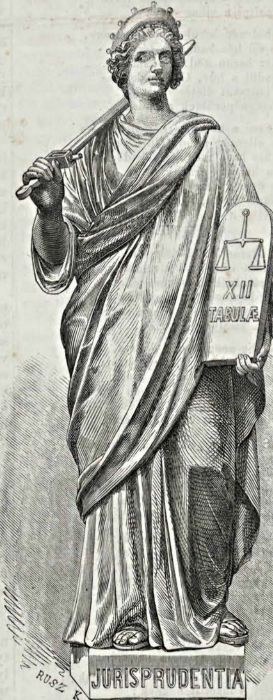
Az akad. palota szobrai: I. Törvénytudomány (Fénykép után).

A könyvtárral szoros összeköttetésben van a lánchid-térre eső nagy nyilvános olvasó-terem és az akadémiai tagok külön olvasó-szobája, azonkívül az udvarra egy nagy terem