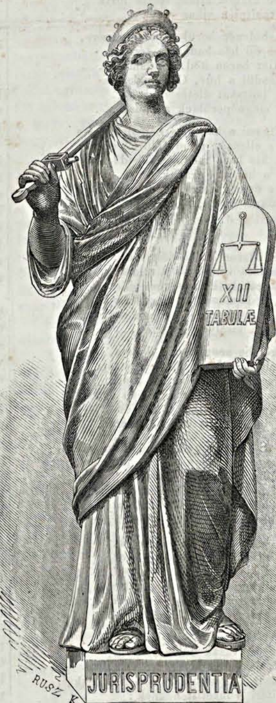
Az akad. palota szobrai: I. Törvénytudomány (Fénykép után).

Az első emeleten a már előbb említett nagy (itt oszloptos) folyosóból nyílnak az ajtók a közgyűlési nagy terembe, melynek