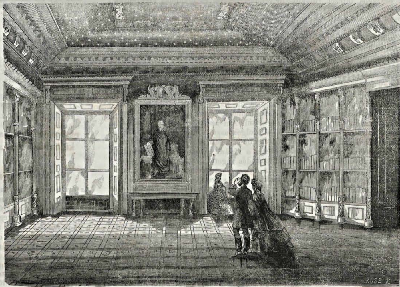
A nemzeti muzeum könyvtárának diszterme. — (Lüders rajza után.)

körülvevő magas szek-erények ösz-lopokra van-nak alkotva, mind remek kézi-faragás-sal, dombor-és homorvé-set-művek-kei. Odafenn, az ékes fes-tésű mennye-zet közepén pompázik az ország nagy czimere, szél-ről az 52 vár-megyéé, a szabad kirá-lyi városoké és kerülete-ké, a sarko-kon a társor-szágoké. — A padozat is igen szép. — Átalában az egész oly jól van rendez-ve, hogy egy ilyen ország-os intézet méltóságá-