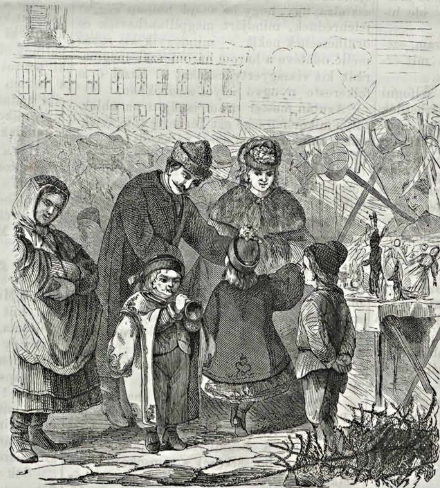
Karácsonyi vásár. — (Ludera rajza után.)

A karácsonyest ártatlan örömei azután megkezdődtek. A Miska csókolni való kedves fiu volt. Ugy szerette a gyermekeket, — ugy el tudott velük játszani, tréfálni, — hogy a különben is örömben és boldogságban uszó