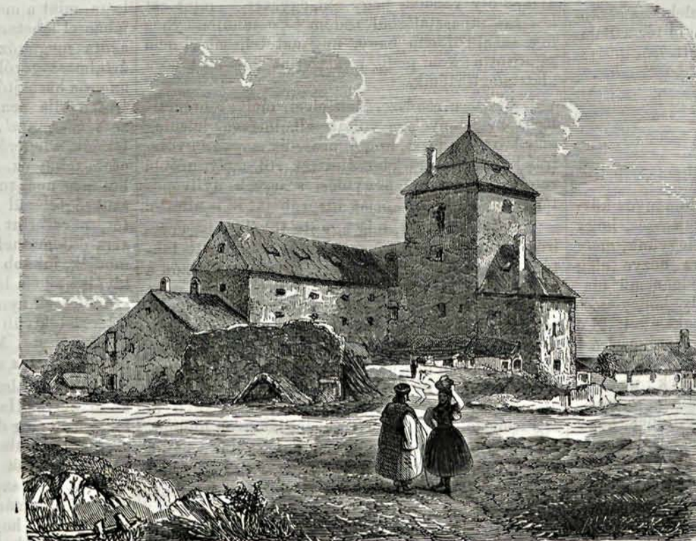
A simontornyai vár maradványa. — (Fénykép után.)

A tatárok betörésekor a völgyek gáttakkal voltak elzárhatók az átkelés biztosítása végett. Azon