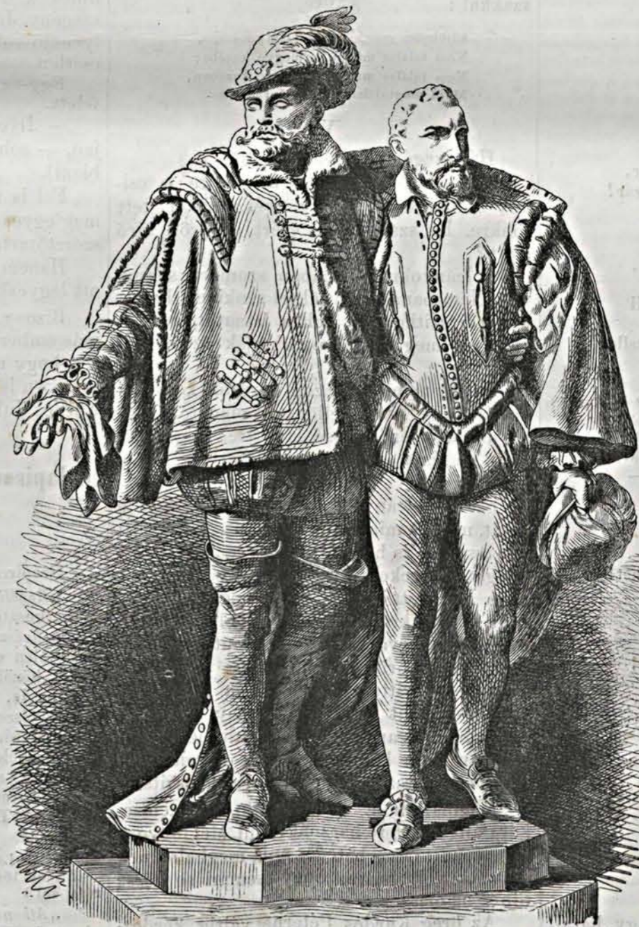
Egmont és Hoorn grófok emlékszoira Brüsszelben.

Szorosan véve a dolgot, némileg hibázatni lehetne a két alak egymás mellé állítását, miután történelmileg bizonyos,