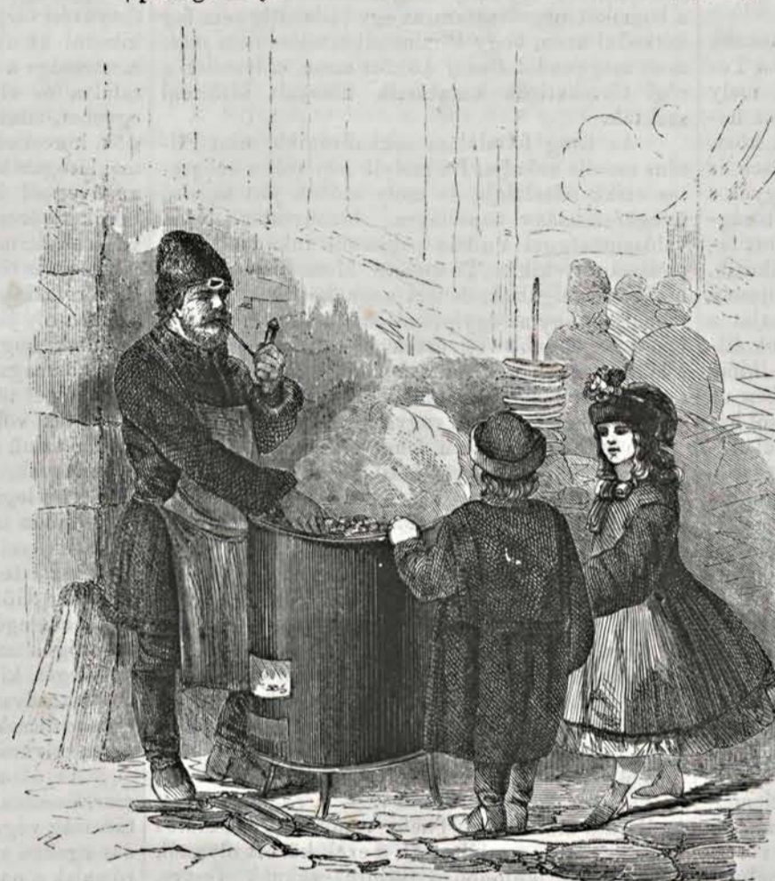
Fővárosi képek: II. Gesztenye-árus.

Két krajczárért, hatért, tízért parancsol! Igazi Garibaldi marrroni! . . . Heiszszze, forró marrroni! . . . Minden népesebb utca sarkán ott áll s fáradhatlan nyelveknek folytonos pergésével, megszűszhangzóval kínálgatja fűnek-fának jószagu, párolgó áruját.