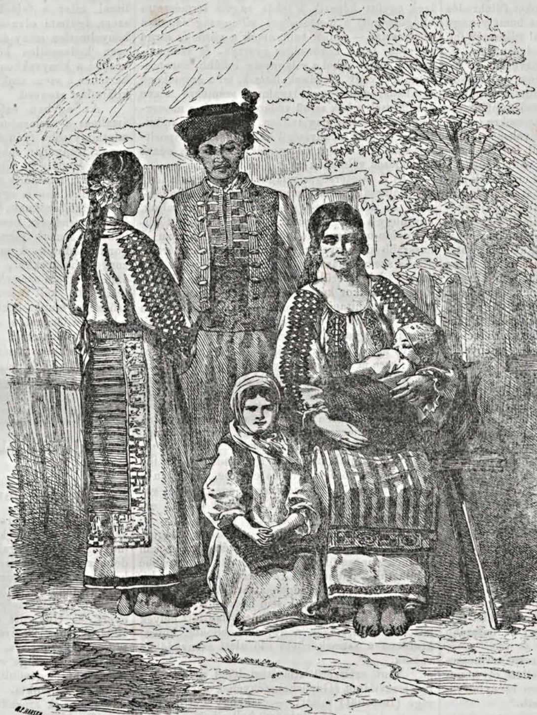
Bánsági oláh népviselet. (Lásd „Utazás az Al-Dunán” című cikket.)

Tovább Szendrő vára öltik szemünkbe. Ezen erősség 21 magas, szögletes toronyból áll, melyek