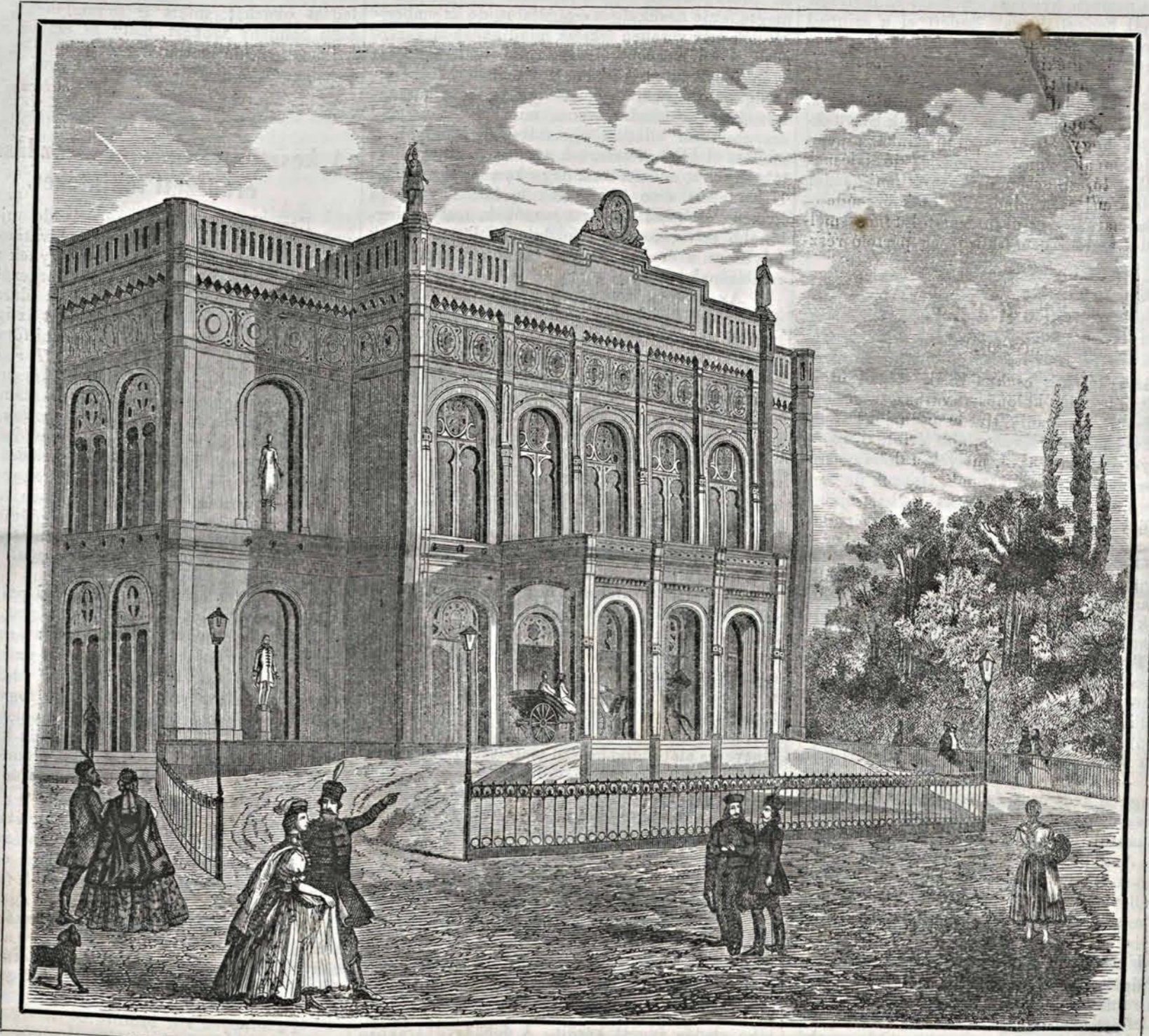
A debreceni színház Szkalnitsky A. terve után. (Megnyílt okt. 7-én 1865.)

A színház a Czegléd-utca elején, az u. n. Semseyfele telken, nem ugyan a város főpiacán, de mindenesetre a legszebb és legteresebb utcák egyikén, a város középpontjához közel áll, a mi a színházba járó közönség nagy kényelmére szolgál. A színházi épület tervezője s eszközlője a dicséretesen ismert pesti építész Szkalnitsky Antal . A színház homlokzata, mint rajzunk is mutatja, arabal vegyes bizanti modorban, kellemes benyomást okozó díszes s szép arányokkal van kivéve. A belső kényelmet és elrendezést tekintve, bármely nagyobb színházzal is kiállja a versenyt; az előcsarnok, gyűlde (foyer), folyosók s egyéb helyiségek, lépcsőzetek, a nézőtér és színpad oly összhangban állanak, s oly szerencsés tapintattal vannak elhelyezve, a minőt az építé-