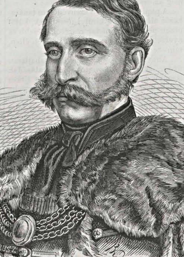
GRÓF FESTETICS GYÖRGY.

gyöt választá meg elnökének, ki e díszes hivatal el is vállalta. Olvasóink még élénken emlékeznek arra, hogy ezen elnöki minőségében érte a jelen év júniusi napjaiban a grófot azon kitüntetés, hogy a gazdasági kiállítás látogatására érkezett Fejedelmet üdvözölhette oly talpraesett beszéddel, a melyre adott királyi válasz az országot új bizalommal árasztá el s mondhatni, a magyar haza történetében egy új korszakot nyitott meg.