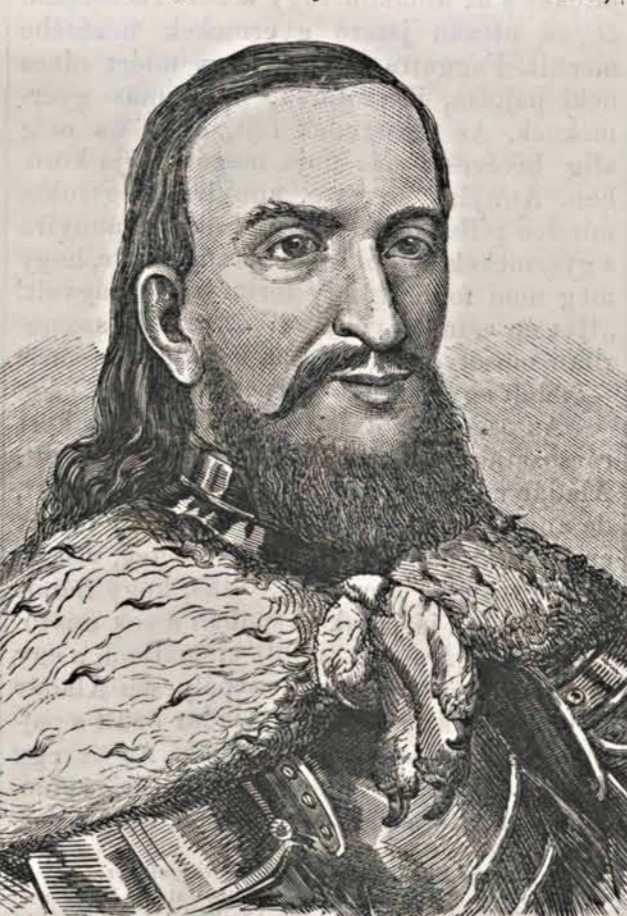
GRÓF TÖKÖLYI IMRE.

A császári udvar, részint nem érezvén magát elég erősnek a forradalom megsemmisítésére, részint a további vérontást megelőzendő, kiegyenlítés kísérleteket tett, mire Wesselényi ellenszülésén hajótörést szenvedtek. Az 1681-diki soproni országgyűlés is, — melyen Tökölyi, ki azalatt a szultánnal és Apafyval szövetségben, I. Rákóczy Ferencz özvegyét, Zrinyi Ilonát nőül vette,