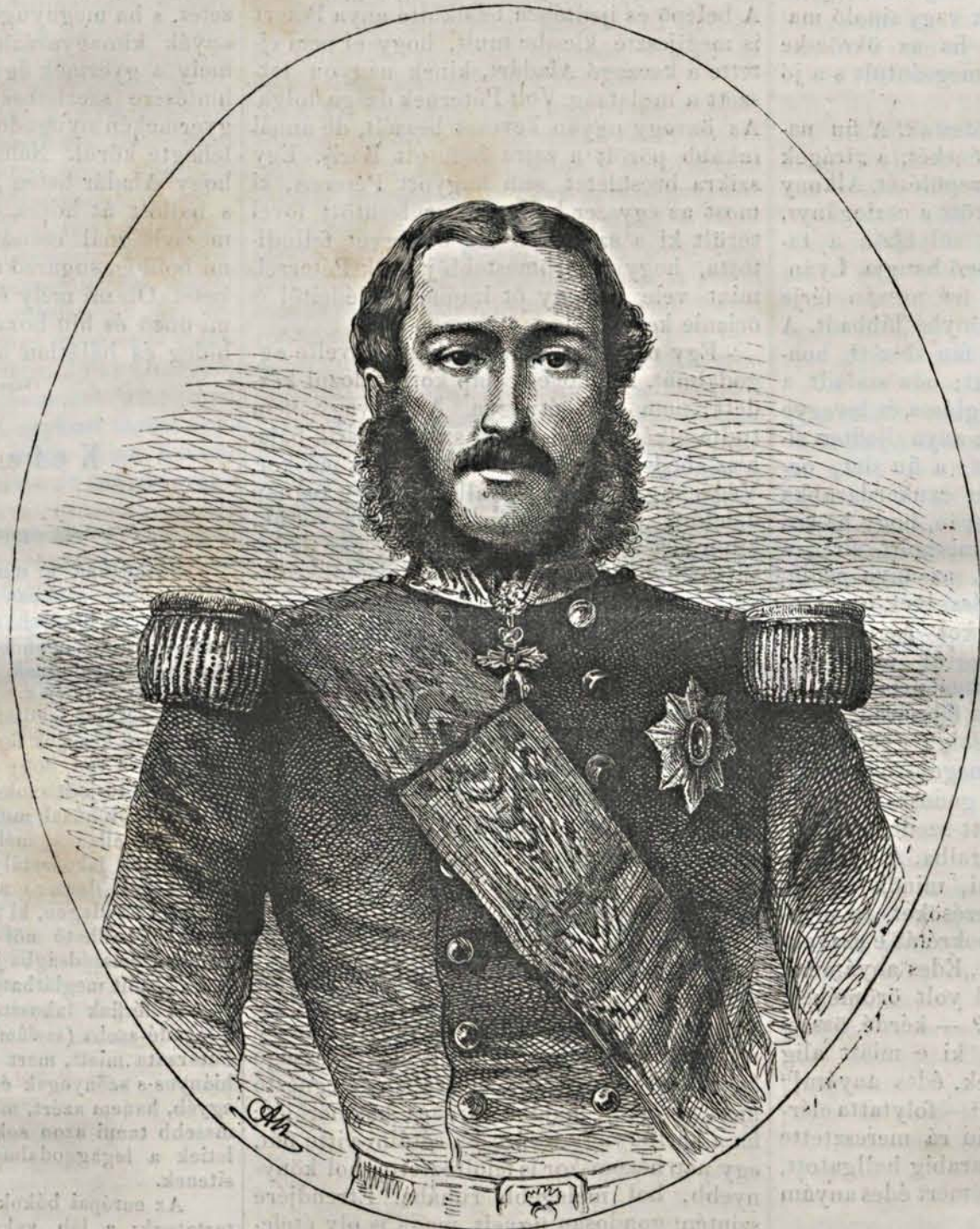
II. Leopold, a belgák királya.

Az egyházat, mint Máramaros minden régebbi egyházát, védelemre szánt kerítés veszi körül. A mellékortony harangjai egyike a tizenhetedik századból való, másika új.