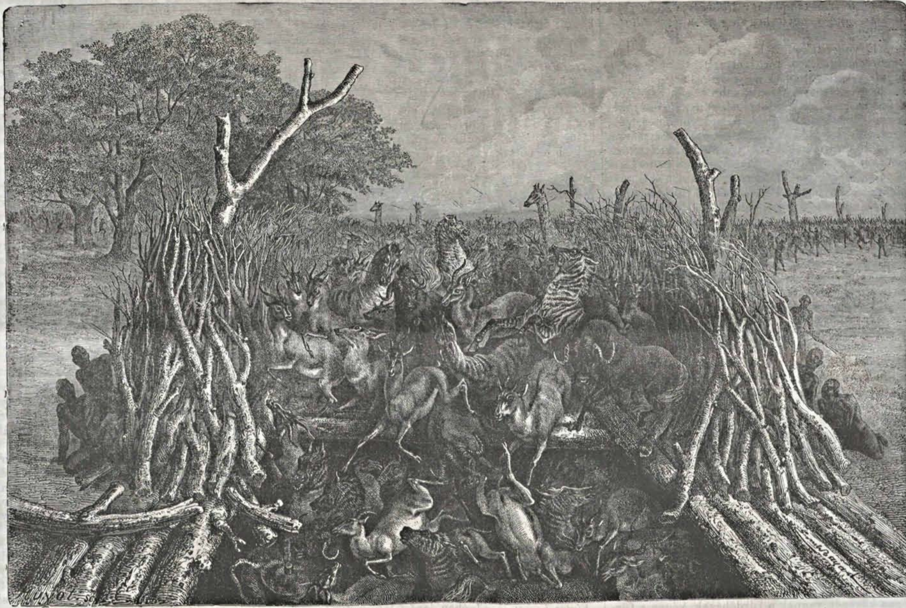
Livingstone afrikai utazásából: III. Hoppo-vadászat.

koritések szögletei igen erősek és vastagok, azonban végökön nem záródnak össze teljesen, hanem mintegy 50 lépésnyi hosszú, keskeny nyílást hagynak, melynek végénél egy 5—6 rőf mély s 8 rőf széles verem van. A nyílás elejéről e verem nem is sejtethető, mert be van fedve gyékénnyel s náddal. E keritések néha félórányi hosszúak s két szélső pontjok épen ily távolságra van egymástól. Az utóbbiaknál azután a vadászok kört képeznek, néha több órányi kiterjedésben; a kört azután mindig szűkebbre szorítják, úgy hogy a közbeszorult vad kénytelen a hoppo -ba menekülni. S míg kívülről így úzik a kerítés határai közé, azáltal az utóbbinak keskeny nyílásánál várják őket a vadászok. Ezek belevetik kopjájukat a megfélemlített állatok közé, melyek mindig előbbre szorítják egymást, míg végre egymásután a verembe zuhannak. „Rettentő látvány volt — írja Livingstone — az üldözött vadak egymásra zuhanása s különösen a szép antilopok megölése. Ily hoppo-vadászatok által a bakuene nép némely héten 60 vadnál is többet fogott. A zsákmányt becsületesen elosztják maguk között s a szegény embereket épen úgy tekintetbe veszik, mint a gazdagokat.”