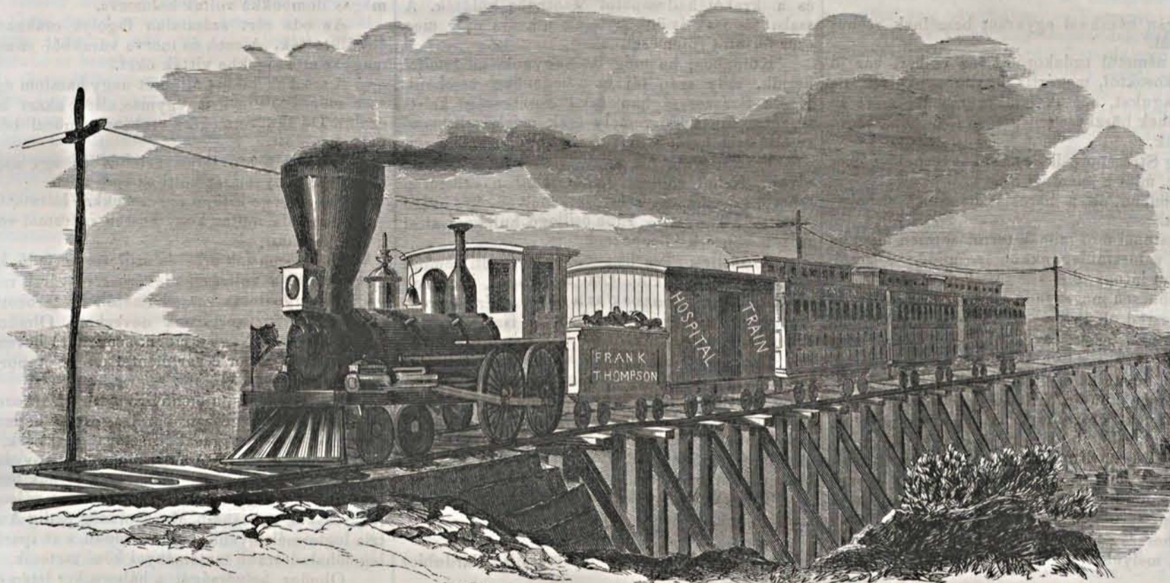
Körházi vonatok a csatatóerekről.

galmas lakosainak fő foglalkozása a gazdaszat, kézműipar, fuvarozás és kereskedés. A kézművesek közt a gubások, szürposztások, cserzők, s különösen kolompárosok említendők, kiknek gyártmányai Magyarország déli és délkeleti határain túl is összetartják a térs legelőkön baranogoló nyájakat. Újabb időkben a jolsvaiak takarékpénztárt is alapítottak, mely az utolsó időben nyomasztó-