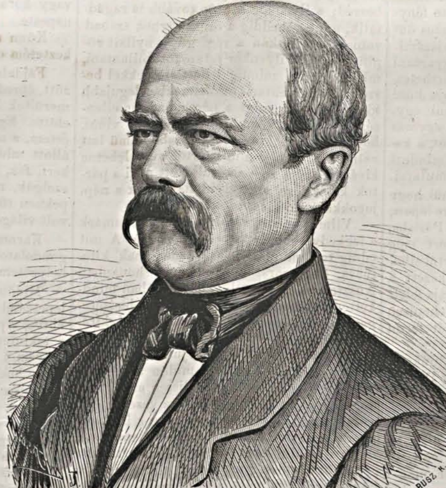
GRÓF BISMARK. (Fénykép után.)

„Van-e, ki e nevet nem ismeri?” — méltán kérdehetők minden hírlapolvasótól, ki Közép-Európa politikai eseményeit s azoknak az idej gyilkos háboruvá fejlődését az utóbbi évtizedben figyelemmel kísérte. Mindenki tudja, hogy ezeknek egyik fő mozgató eleme, a vállalkozó, nyughatatlan szellemű porosz miniszter, gróf Bismark volt. Merész terveinek egy nagy része e perczen sikerülnek látszik; a porosz nemzetet, melynek nagyságaért lelkesült, törvényes és törvénytelen, nyílt és alattomos utakon, elszánt, szívós kitartással, a hatalom és dicsőség oly fokára vitte fel, a melyen az a vállót teremtése óta soha nem állott, sőt a melyről talán maga a nagytratór miniszter, legmerészebb vágyai között sem álmodott. Észnek, ügyességnek, hősiességnek megvan ezen eddigi fényes sikernél a maga része; de a későbbi idő fogja földeríteni, mennyire működött közre e vívmányoknál még a véletlen, a szerencse s a küzd-terre szorított többi kormányok és népek balszillagzata. Ugy fogják-e tekinteni Bismarkot, mint nagy Németország regeneratórát, vagy átkozni fogják-e emléket — ez is a jövő titkai közé tartozik.