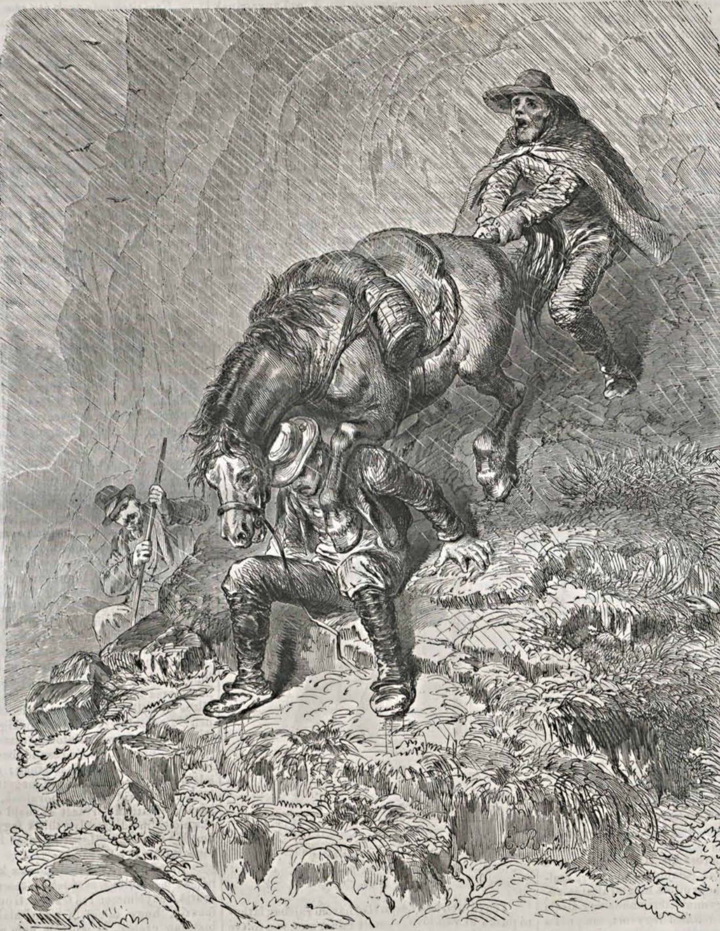
Önkénytelen lecsuszás a sveiczi havasokon.

Európában van egy régi hercegi család, melynek tagjai értelmi tulsúly és a szerencse kedvezésével folytán különösen egy század óta nagy tekintélyre jutottak. Ez a Koburg hercegi család. Ezen család egyik tagja Magyarországba is beszámrazott. A nádorfejérvári hős, Koburg Jósif volt ez, ki Budán mint hadi kormányzó, az