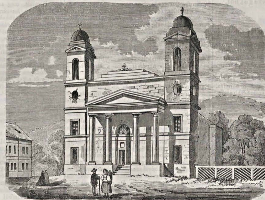
Jolsvai r. kath. templom.

Jolsva város magyar érzelmű tót lakosainak száma 4500, kiknek több mint 2/3-da evang., 1300 r.-kath., s 50—60 mózes-vallású, kik csak újabb időkben telepedtek ide, miután a bányavárosok kirekesztő szabádmála megszűnt. Szor-