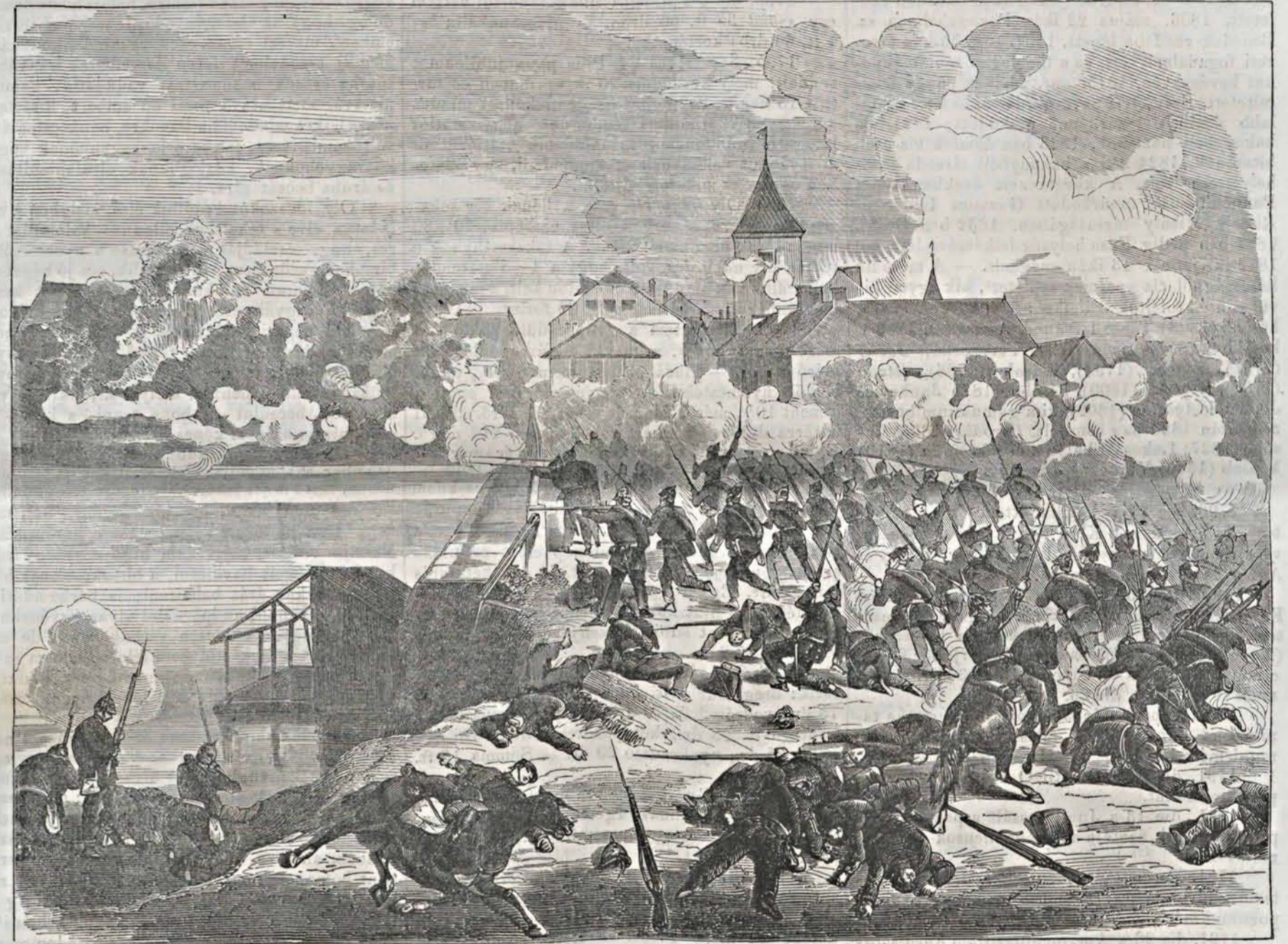
A jicsini hid ostroma (Junius 29-kén).

A köztö elöszava. Egy mult századbeli falusi jegyző ötven évről szóló följegyzéseit mutatjuk