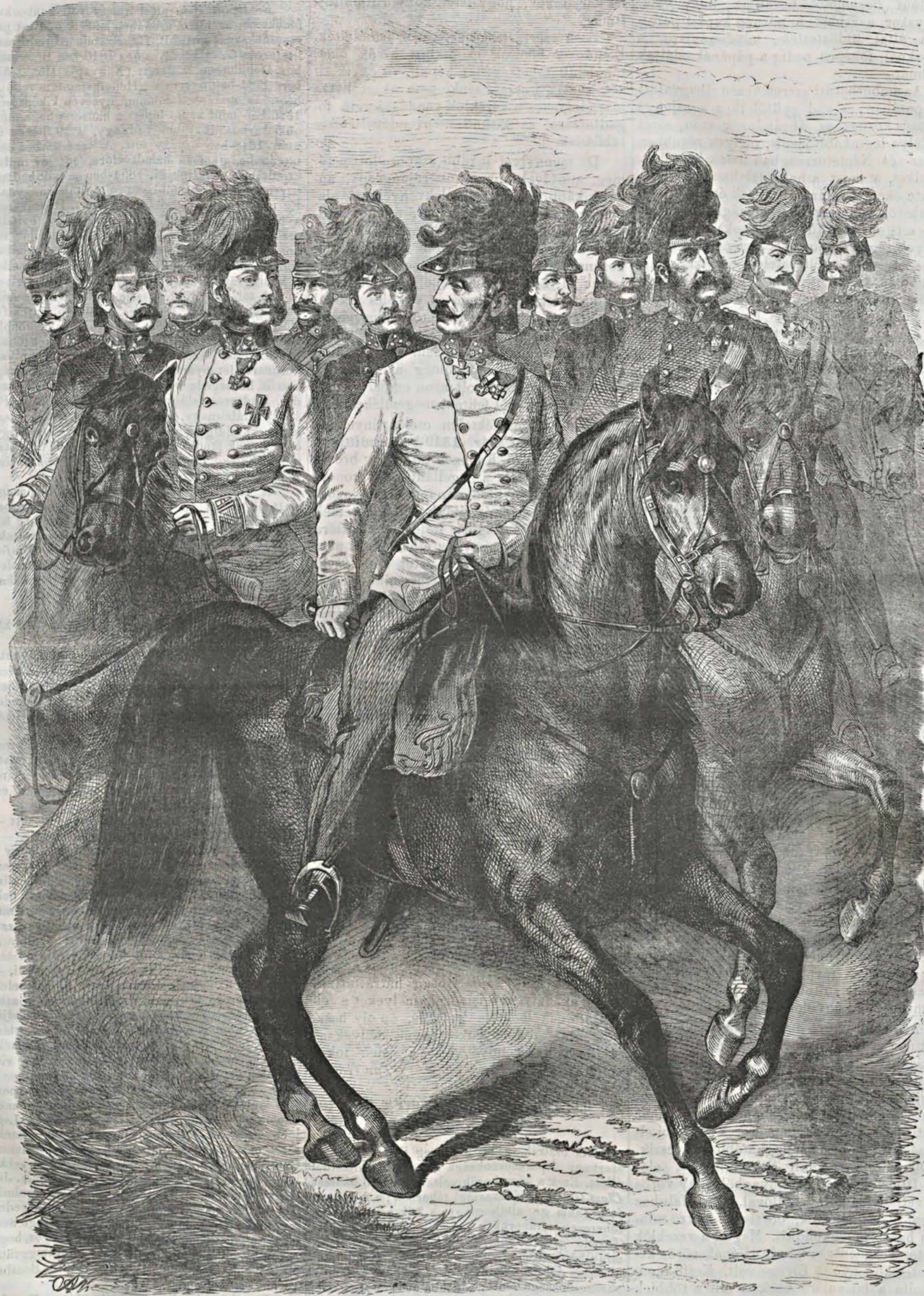
Benedek taborszernagy taborkara.

1. Benedek tábornagy. 2. B. Hennikstein altábornagy. 3. Vilmos főb. altábornagy. 4. Klein őrnagy. 5. Neuber ezredes. 6. Tausar főhadnagy. 7. Christl őrnagy. 8. Krizs ezredes főhadnagy. 9. Müller alezredes. 10. Tegethoff alezredes. 11. Krizmanics tábornok. 12. Poppenheim alezredes.