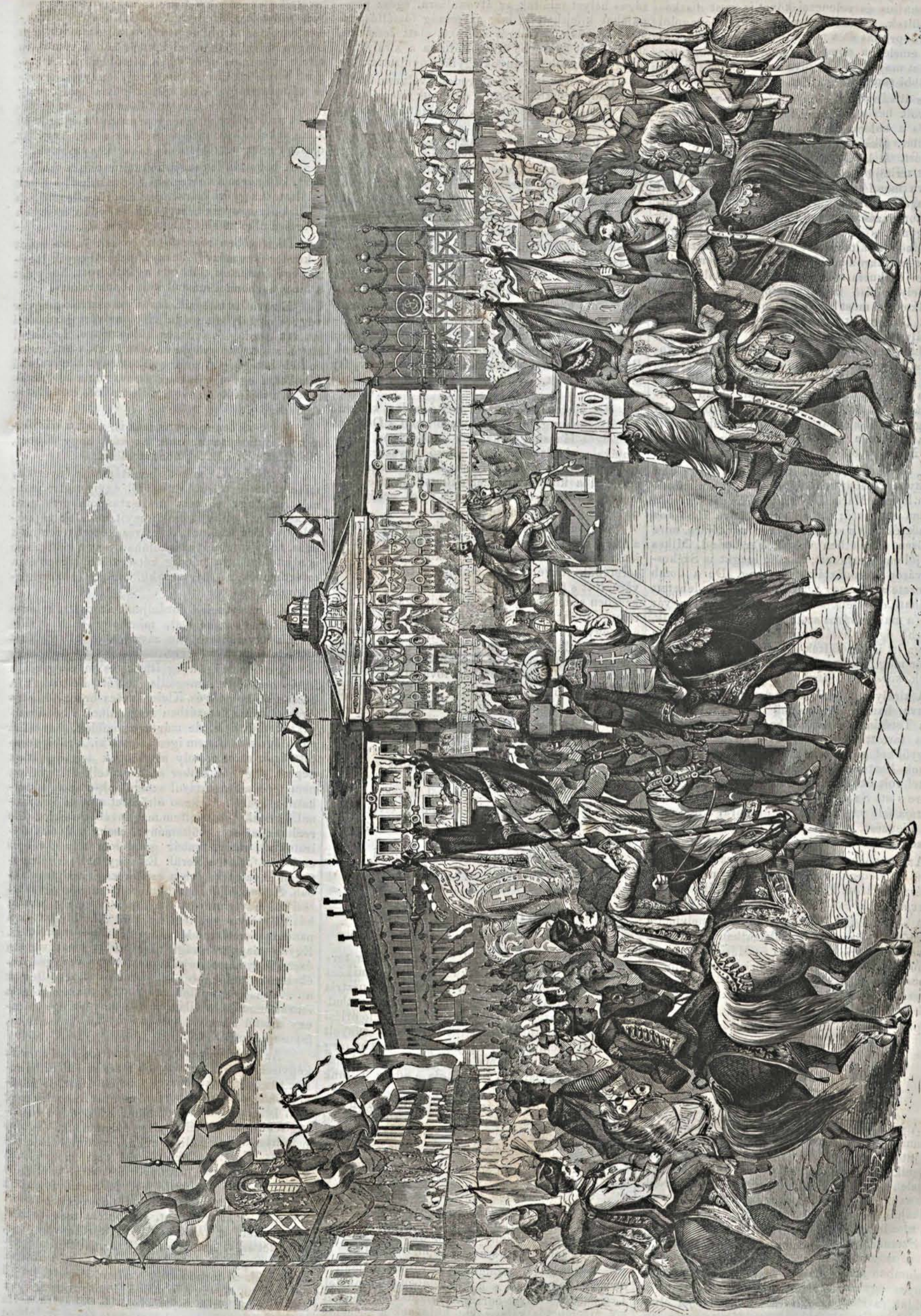
Képek a koronázásról: I. A kardvágás.