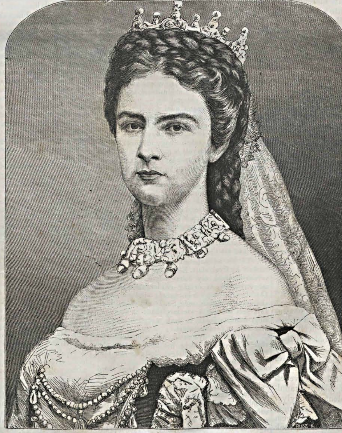
ERZSÉBET, MAGYAR KIRÁLYNÉ.

Azon örömjajba, mely a magyar királyné szent István ősi koronájával junius 8-án történt ünnepélyes megkoronáztatását e kiáltással üdvözöl: „Éljen a király!” — egy szintoly hangos és minden magyar szív mélyéről felhangzó szó vegyült: „Éljen a királyné!” Hazánk sorsára, történelmünk kezdetétől fogva, rendkívüli befolyást gyakoroltak a nők. Lovagias nemzetünk, melynek a nőnem iránti tisztelet, valamint a keresztény családiaság kiváló jellemvonásai közé tartozik elejétől fogva nagy befolyást engedett mind egyéni, mind állami életére, a nőknek. Egy nő, egy szűzies érzelmű anya volt az, Emes, Álmos anyja, ki jós álomban látta meg a méhéből származandó fejedelmi s utóbb királyi családának dicsőségét s ez álmom hitteljes erejének befolyása alatt nevelé nemzetünk első őszvérét, kiról költői mondáink anyyi csodásan szép emléket tartottak fenn. Egy nő és anya volt, Gyeics vezér második nejje Adelhájd, István fejedelem mostoha-anya, ki első volt nemzetünknek a keresztény hitre térítésében s szelid és vallásos befolyásával vezérlé férjét, fiát s harczias, de minden nemesre fogékony nemzetét az idevezető hit elfogadására. Nő és királyné volt, Gizella az