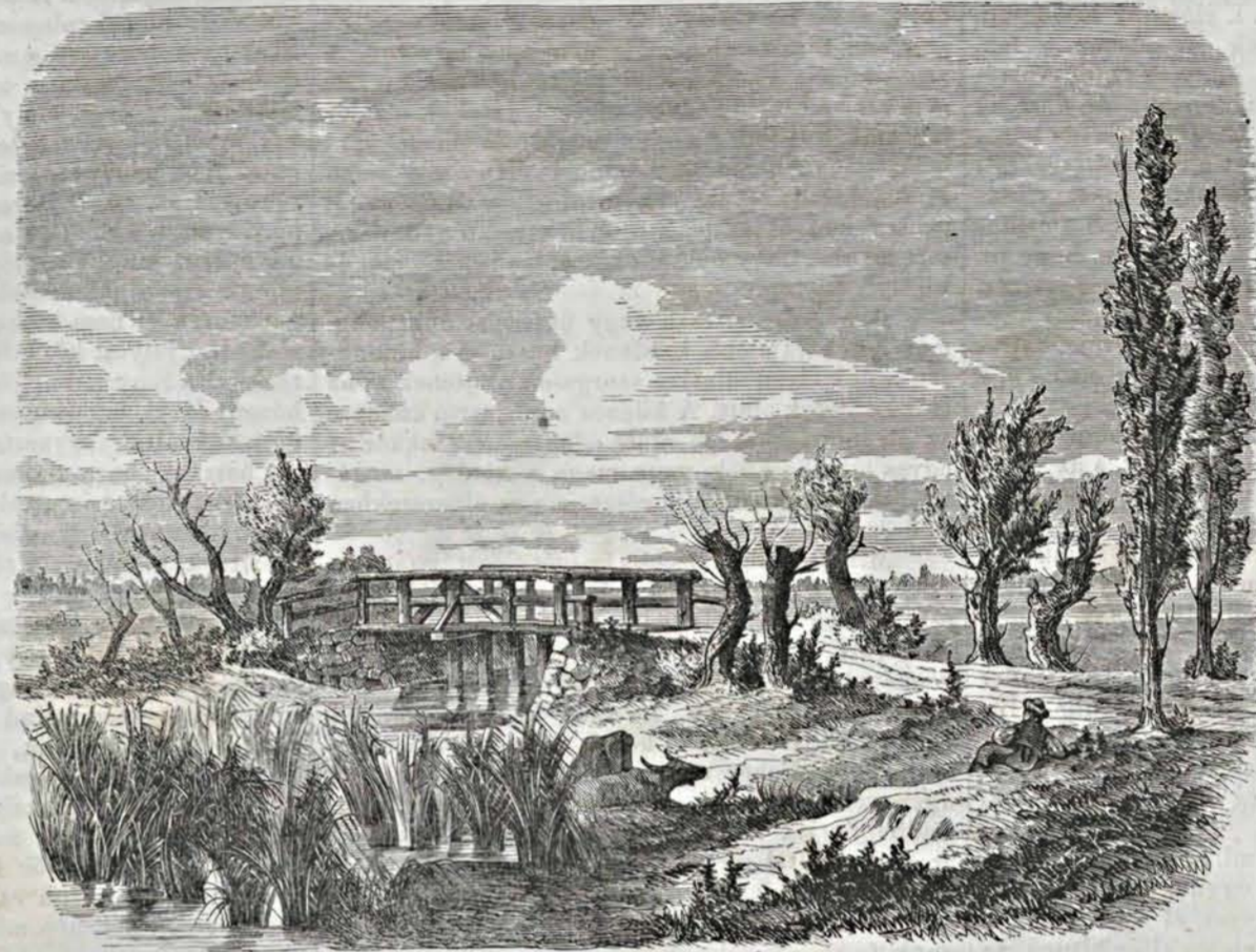
184%-ki csataterék: 1. Tápió-bieskei hid.

E változó csillagokhoz sokban hasonló látványt nyujtanak az u. n. eltűnő csillagok. — Többször vettek már észre a csillagászok egészen új csillagokat megjelenni, s hosszabb vagy rövidebb idő után ismét eltűnni, néha több évekre vagy pedig örökre, az égen. Így 1572-ben Tycho de Brabé, midőn egy derült augusztusi estén szokott sétáján egy szokatlanul az égbe bámoló parasztot találta az utcán, kérdé-