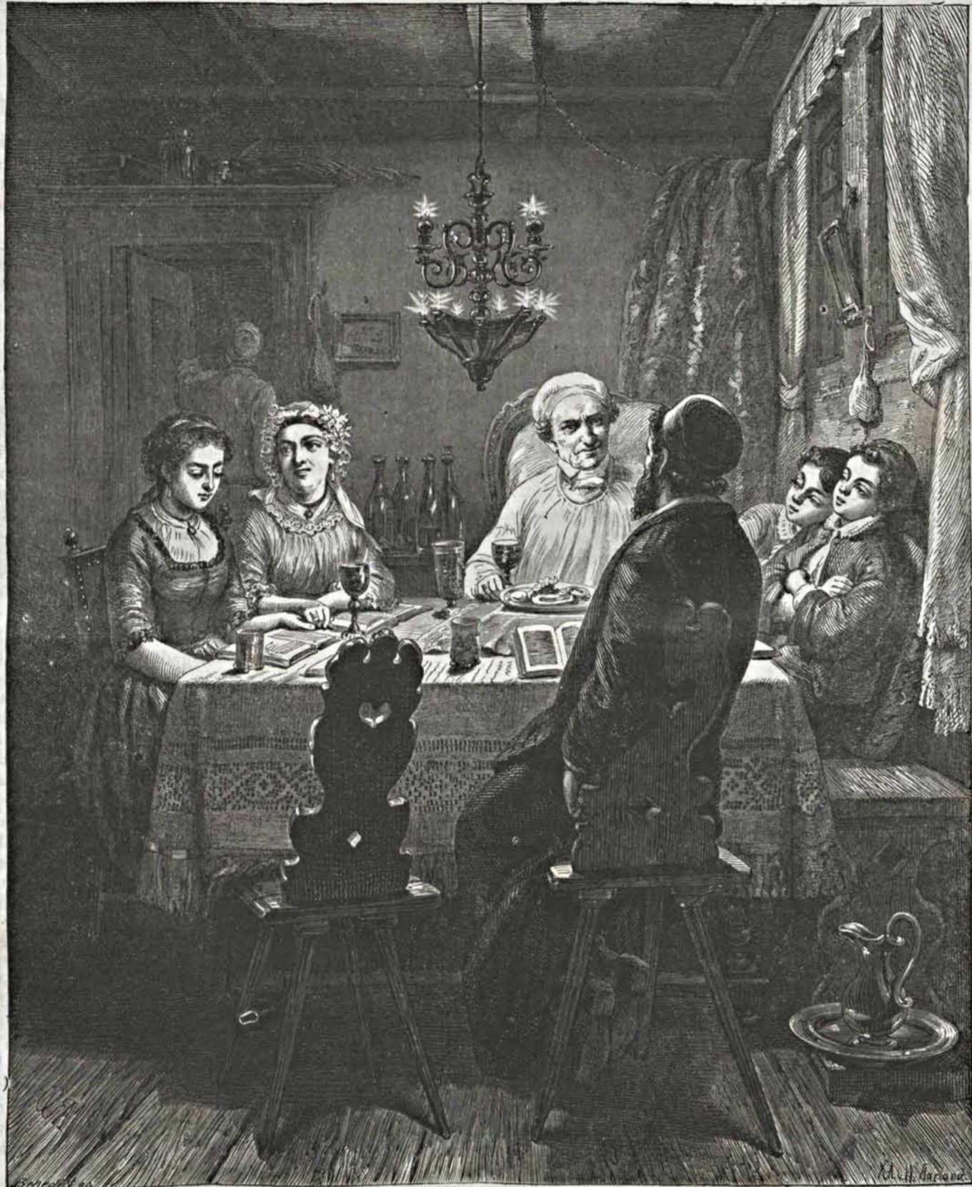
Ünnep-este egy zsidó családban.

Gyakran látunk kormányokat, melyek a nemzetek haladását gátolni akarják, s látunk oly államférfiakat, kik a haladás szükségességét tagadják. Pedig az egyik vagy másik irányban előretörésként soha sem csak pusztá, önként előidézett szeszélye az egyeseknek vagy a nagyobb tömegeknek. Mint az életnek anyai más tünevényeiben, úgy ez előhaladási vágyban is csak azon rejtélyes erő szerepel, mely az egész természetet áthatja, s mely ösztön név alatt minden azo-ban nem úgy állt, mint hirül vevé. Bieskén, a mint a Tápió hídján, melyet képünk ábrázol, átkelt, két dandárt talált 12 ágyúval. A meglepett ellenség, hogy ideje legyen gyalogságát a helység előtt föllátni, hat szá-