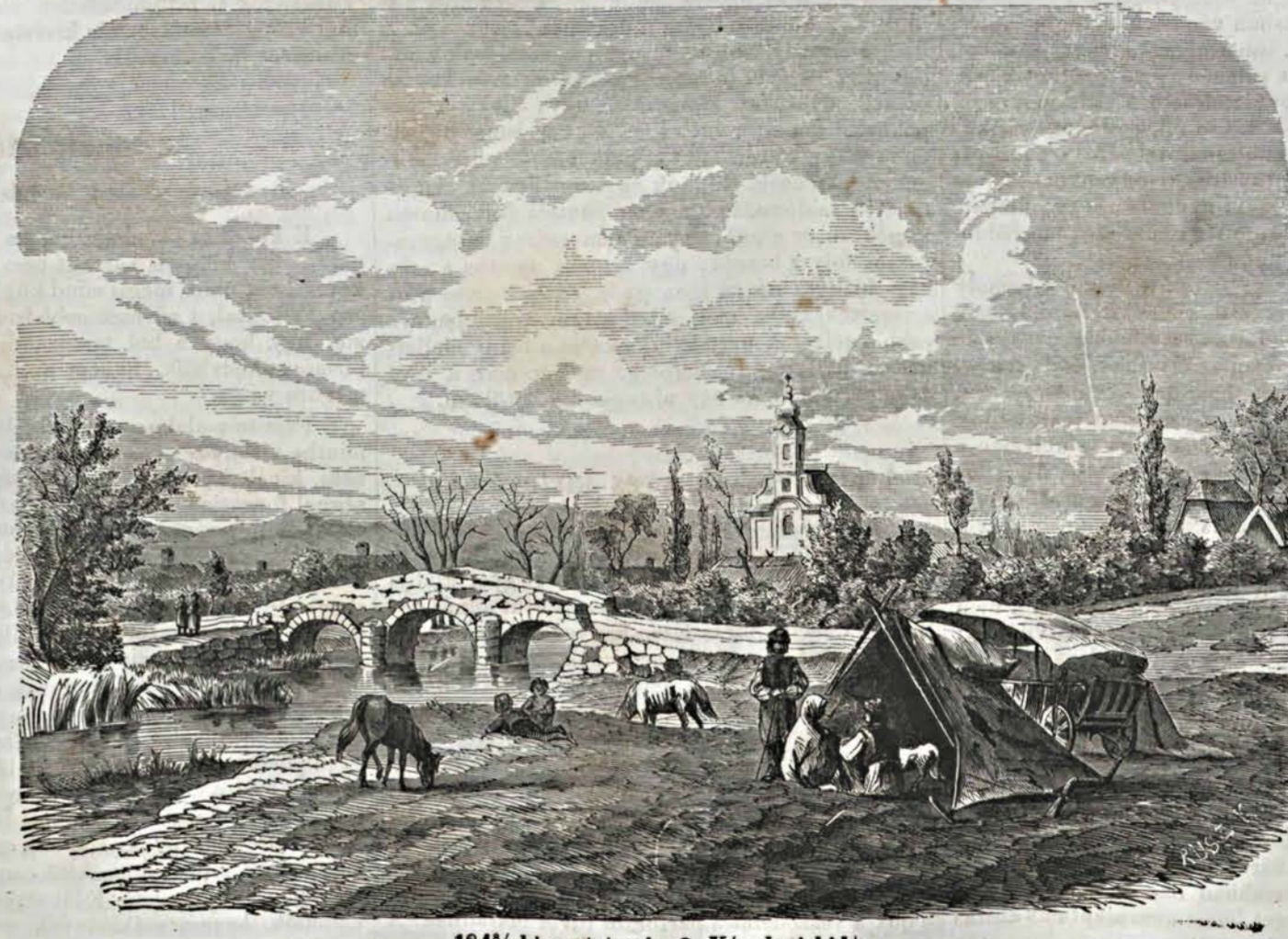
184%-ki csataterék: 2. Kápolnai hid.

halandó szem. Bajosan mondhatni meg. — Aragón ugyan azt állítja, hogy ezen új csillagok csak hirteleni stürdvényei voltak a világtérben elszórva levő világ-anyagnak, s Tycho maga is említi, hogy ama csillag homályos térrel volt környezve, mintha e fényes pontba lett volna belül összeszívódva a világ-anyag, — azonban mindez koránsem mondhatni biztosnak. Általában e tünevények okát többféleképp próbálták ki-magyarázni, melyek szerint e roppant égi testek a sebes forgás alatt malomkőformára meglapulva, midőn ily keringé-