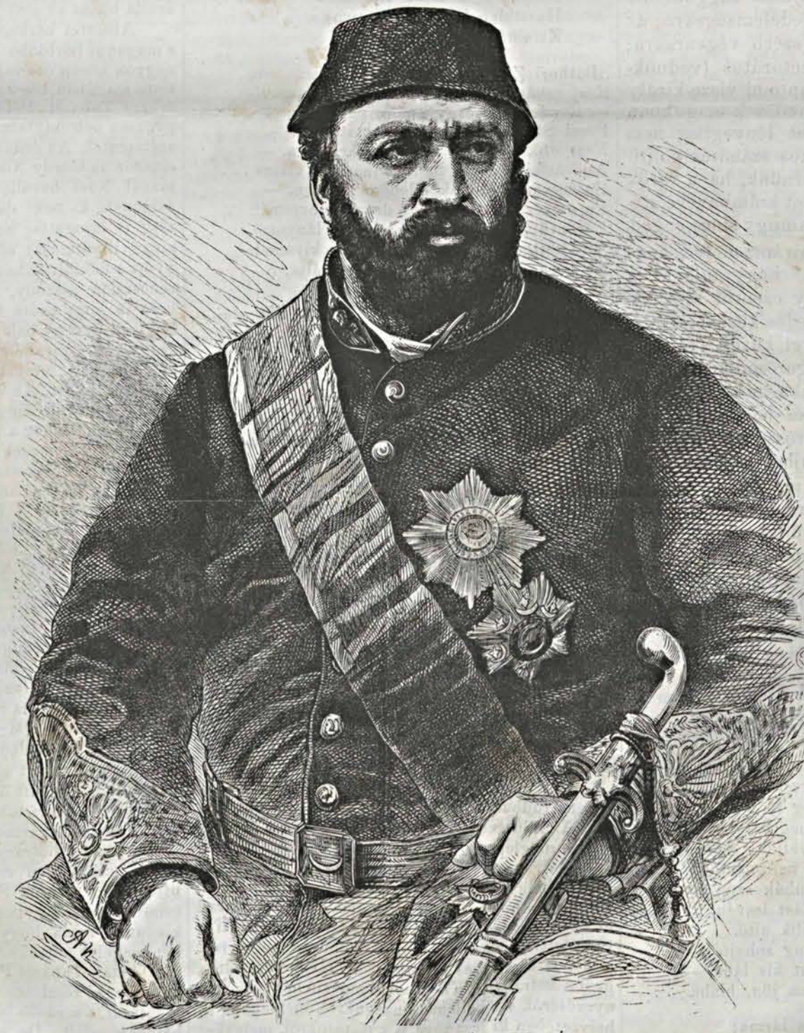
ABD UL-AZIZ KHAN, TÖRÖK SZULTÁN.

Az európai uralkodók közt, kiknek nevezetesebbjeit a lapok időrel idöre, arcképeik s életrajzaikban megismertették olvasóikkal, kétségkívül nem utolsó érdekessége amaz idegen vallású és sajtáságos társadalmu nemzet fejedelme, mely századokon át ellenségünk volt, a legutóbbi időkben pedig oly nevezetes jelét adta barátságának irántunk. A török császárról szólnak, az első szultánról, ki — keresztény fejedelem meghívása következtében — Párisba utazott, s onnan London, Berlin és Bécsen keresztül hazatérve, valószínűleg a mi fővárosunkat, Buda-Pestet is megiszelti látogatásával. Ez utazás rendkívüliségét csak az méltányolhatja kellőleg, a ki tudja, hogy Törökországban vallás-politikai hagyományos törvénynyé vált, miszerint a szultán, e hódító nagyúr, háboru esetén kívül soha el ne hagyja székvaróságát. És e fölött az ulemmák (írastudók, törvény-magyarázók) testülete oly féltékeny szemmel örködik, mikép a padisah birodalmának egyik másik tartományát is csak kiero-zsakolva, ugy szolván csellet, látogathatja meg. Képzeltető tehát az izgalom, mit Istambulban annak híre előidézett, hogy a szultán Párisba megy. Az utikészületeket az udvar oly gyorsan tevő meg, hogy a nők, kiknek hatalma ott is nagy, s az ulemmák intrigáikkal teljesen elkéstek, bár azért föl nem hagytak.