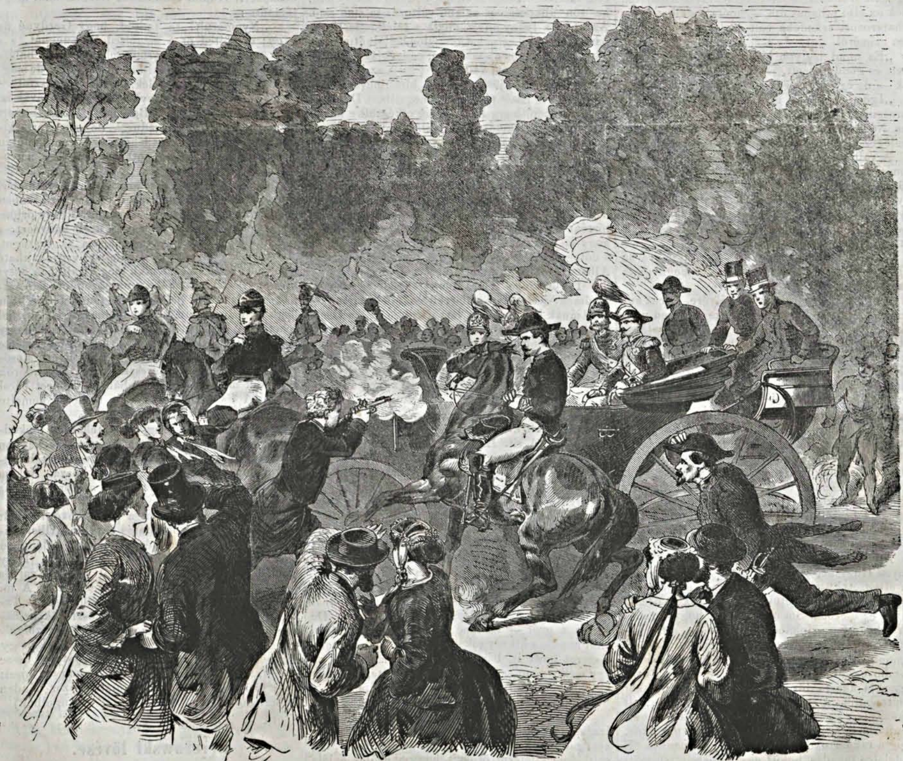
Merénylet az orosz czár ellen, a boulognei erdőben.

E kocsi, melynek készítését II. Ferdinánd német császár és magyar király korára és így a tizenhetedik század első negyedére teszik, különösen kitűnik az által, hogy egész alkotmányán a természet és mesterség két lezsebb anyagán —