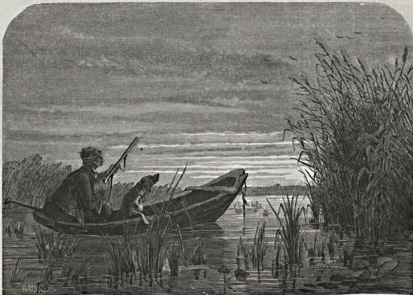
Les vízi vadra. — (Greguss János eredeti rajza.)

gyar ügyhez szított. 1848-ban Brassó követői az első között voltak, kik pártolták az erdélyi országgyűlésen az uniót. Később igaz, az események rohamos áramlatának, s a különféle machinatioknak nem birt elmentállani: esz-közévé vált a reactionnak. Orosz segéd-seregek szállták meg N-Szeben és Brassót, hogy az osztrák császári hadak teljes erővel fordíthatassanak a magyar hadtestek ellen. Mikor az orosz segély daczára, Bem bevette N-Szeben, — a kiver osztrákok és oroszok Brassó körül összpontosították minden erejüket, hogy legalább ezen várost ne hagyják a magyarok kezére jutni. De a hazafias Brassó nem terte, hogy a harc kockája döntsön fölötte. Több apró ütközlet után oroszok és osztrákok kivonultak belőle, s kivonultak Erdély földéről is. Brassó pedig elejébe küldött Bemnek, s örömmézzel fogadta kebelébe a legigazabb ügyért küzdő harcosokat.