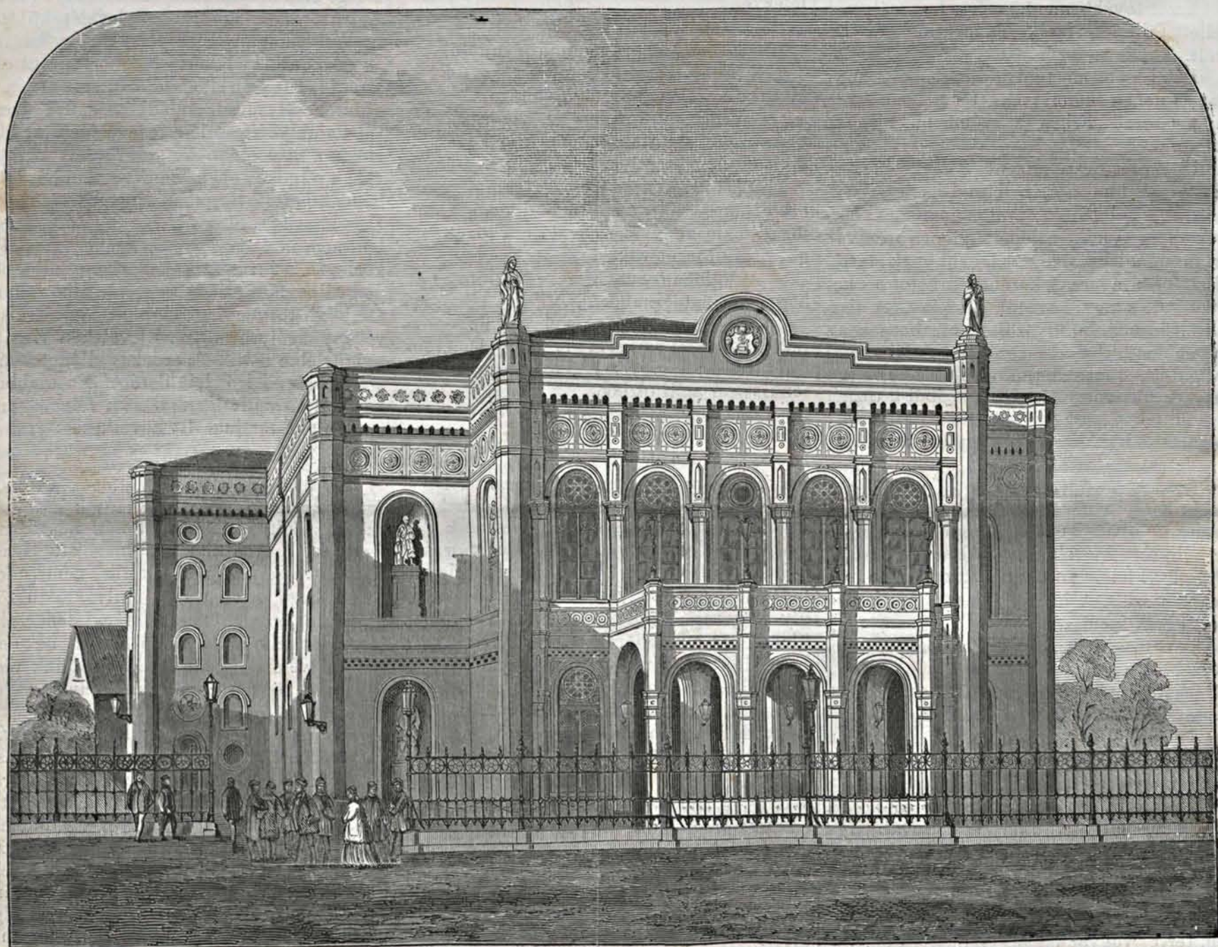
Debreczeni színház. — (Gondy és Egey fényképe után Haske.)

Az akkori községtanács, e rendületlen férfiak buzgalmanak hatása alatt 150,000 főt és egy üres telket ajánlott fel állandó színház építésére. Az 1861-diki tanács nemcsak megerősítette a ha-