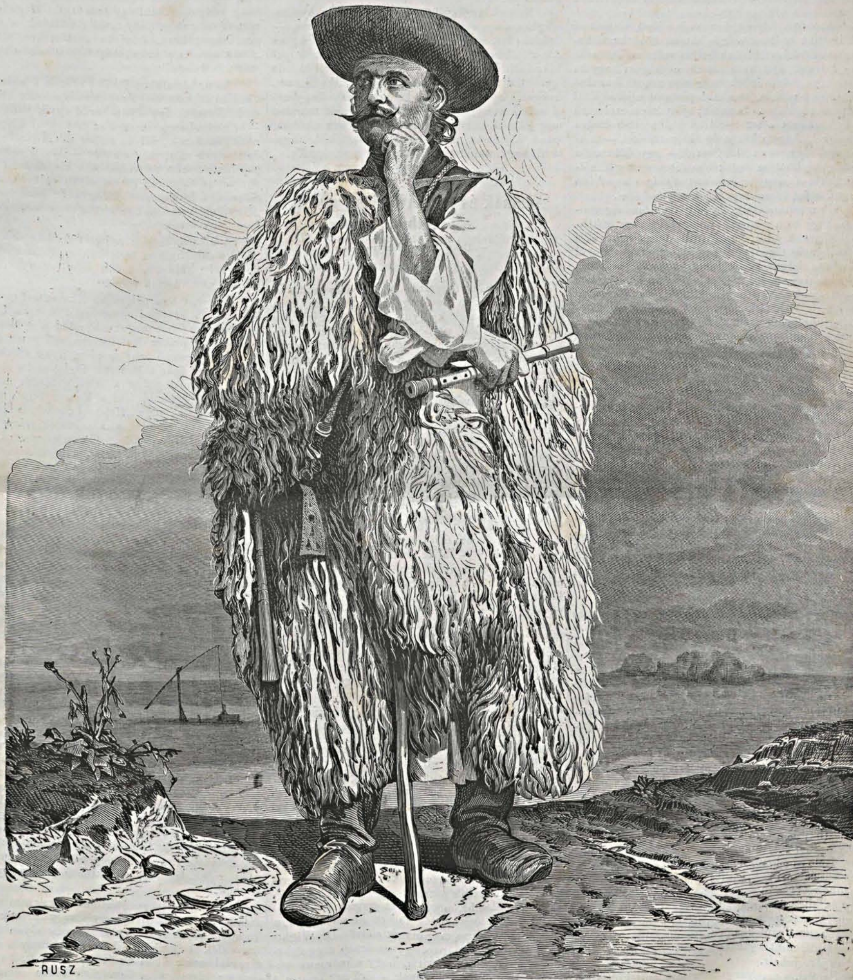
Képek a pusztáról: 2. A juhász. — (Gondy és Egey fényképe után Jankó J.)

Es így azon nagy cél felé, melynek előérére ezen vállalat életbeléptetése által a színügy-egylet törekedni kívánt, — mint a három évi számadás eredménye igazolja, — jelentékeny közeledés történt; — mert egy jól szervezett társulat folytonos együtt-tartása és pontos díjazása által, a debreczeni és nagyvárad közönség műgényei-