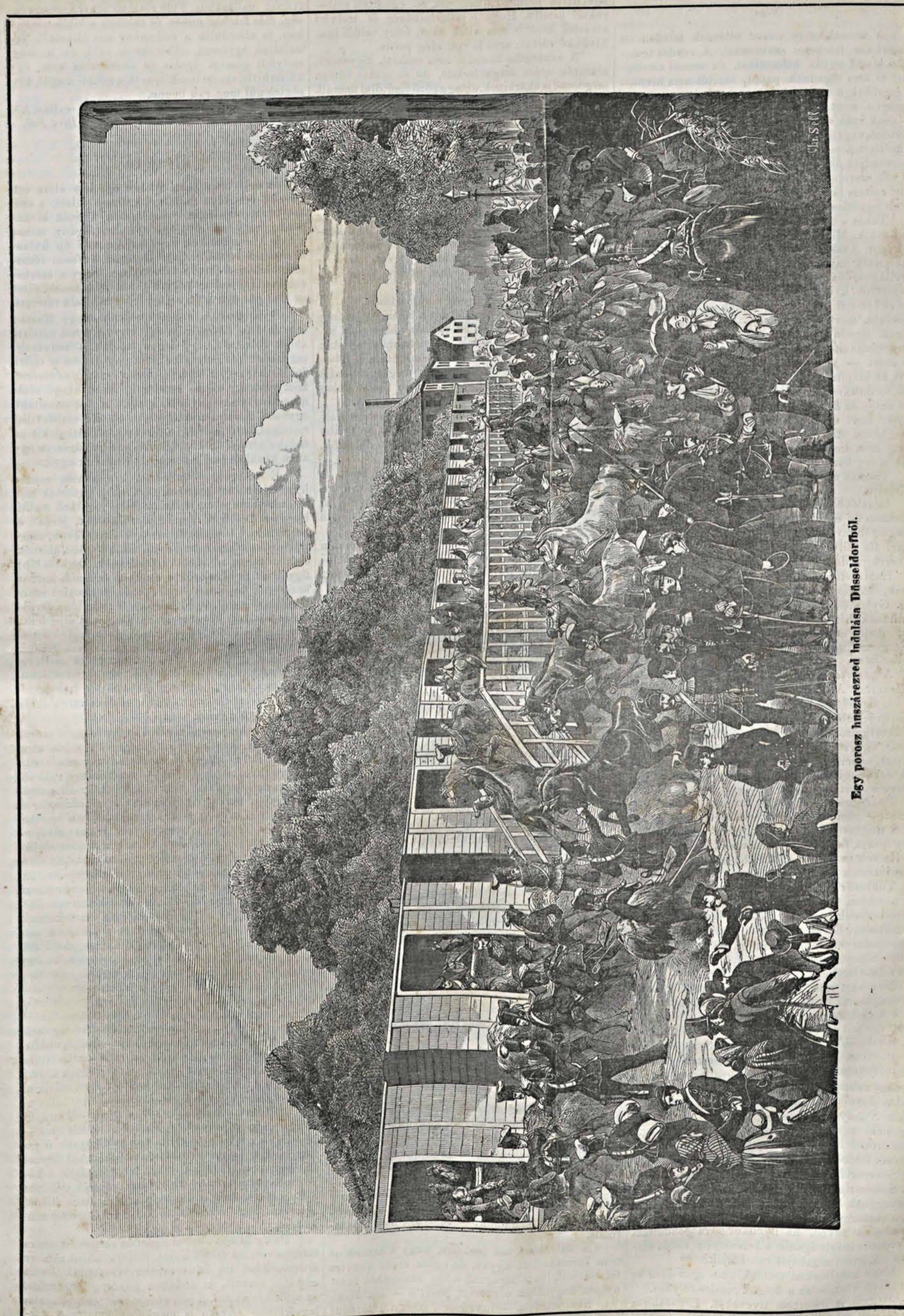
Egy porosz huszárezred indulása Düsseldorfból.