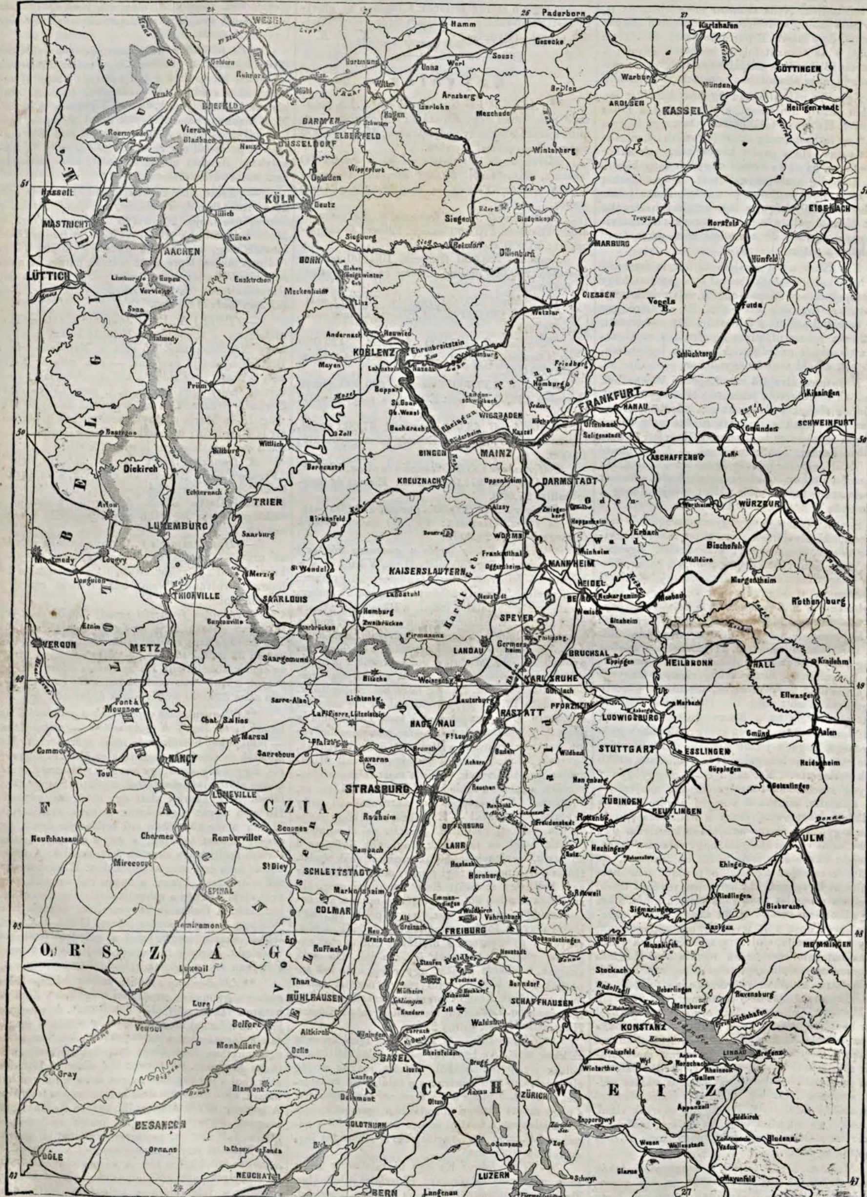
Csataterkép a francia-porosz háborúról.