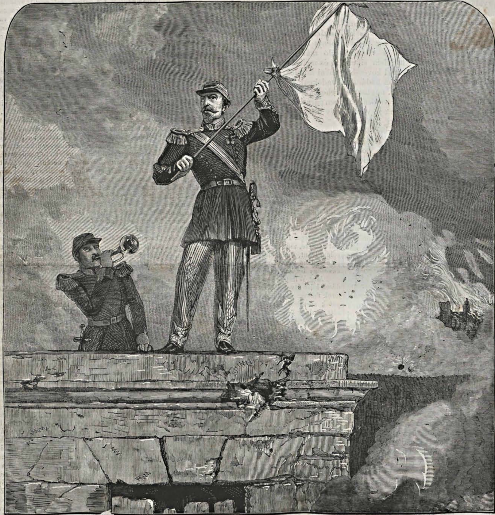
Parlamentair a sedani vár fokán. (Szept. 1. d. u. 1/2 órákor.)

Palikao a Napoleon-dynasztia utolsó császárnak utolsó minisztere utolsó napját is arra használta fel, hogy hazudságot mondjon a nemzet szemébe. Nem titkolhatta el ugyan a valót, de