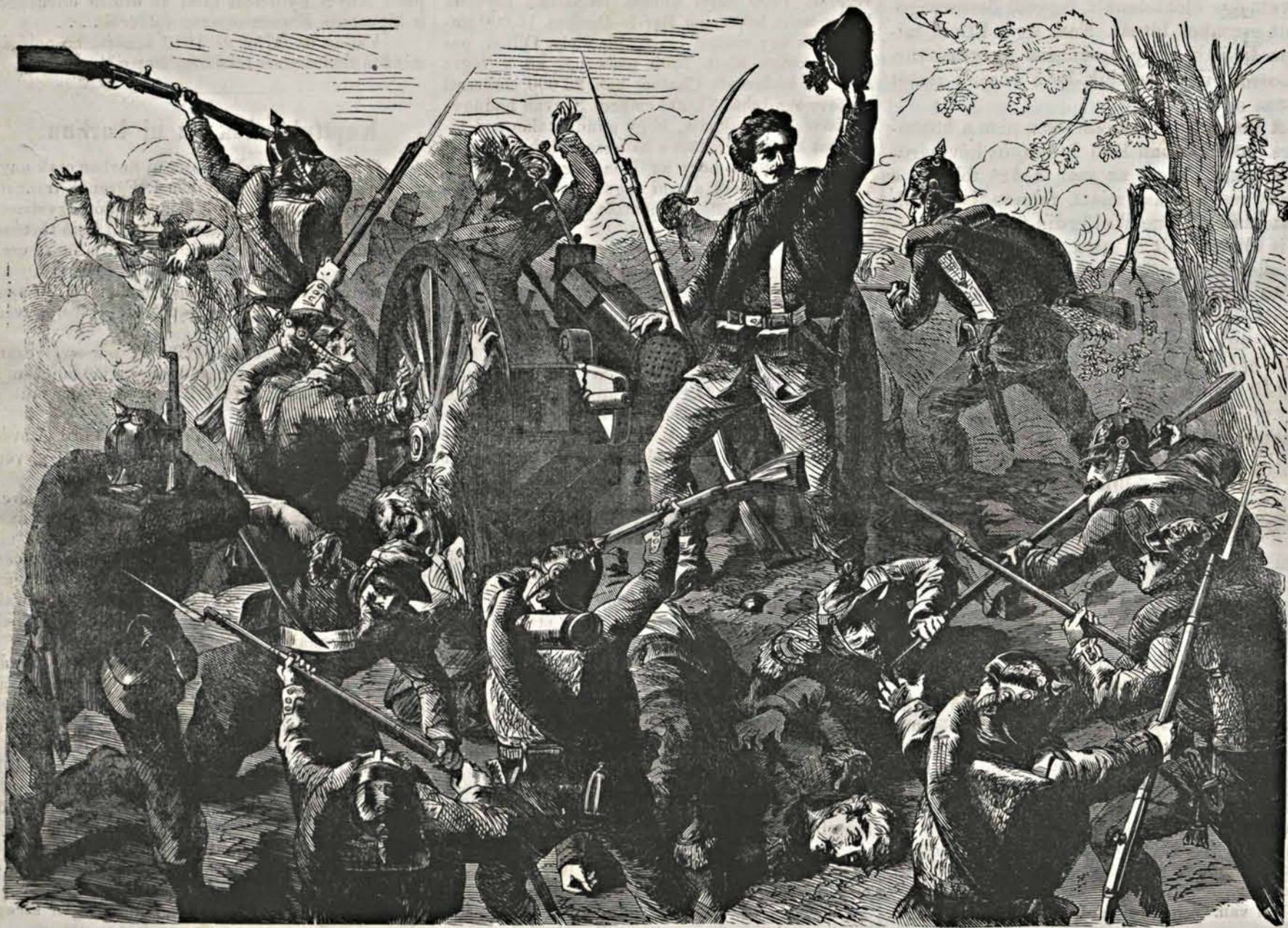
Egy mitrailleuse elfoglalása a porosok által a wörthi csatában.

*(Pest statisztikájából.) A népszámlálás adatai szerint a főváros lakosságában (vagyis 102,741 fi és 97,735 nőnemű egyén közt) százéves csak egy férfi, de tizenegy nő van; száz éven fölül pedig csak kettő, mind a kettő nő. Kilencvenkilenc éves nincs se férfi, se nő. Kilenczven éves van 6 férfi, 13 nő; 91 éves 6 férfi, 11 nő; 92 éves 2 férfi, 4 nő; 93 éves 1 férfi s 1 nő; 94 éves 1 férfi s 6 nő; 95 éves 1 férfi s 4 nő; 96 éves 2 férfi s 1 nő (ez egy rovatban vannak kisbőszégekben); 97 és 98 évesek csupán nők vannak három-három. A műveltségi statisztika is kedvező a nőkre nézve, mert több nő (84,881) tud írni és olvasni, mint férfi