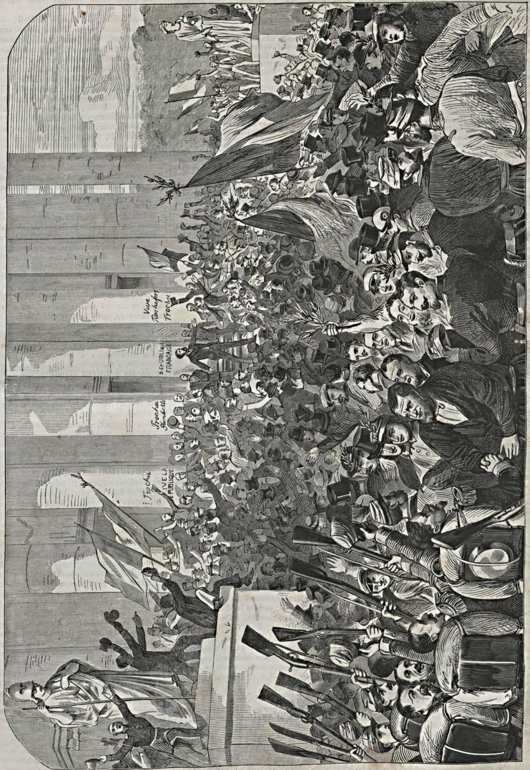
A köztársaság kihirdetése Párisban szept. 4-én.

A törvényhozó-test szombati ülésében jelentést tett, mely szerint Bazaine sikertelen kísérletet tett keresztül törni a porosz hadakon, visszavetett Metzbe, s így törekvése Mac Mahonnal egyesülhetni, füstbe ment. Másrészlől nagy ütközet volt Meziéres és Sedan között, vereséggel vegyes diadal. Mac Mahon besorozta a poroszokat a Maasba, de a tulerő elől kénytelen volt visszavonulni. A helyzet nehéz. De a kormány mindent el fog követni a haza megmentésére. Kétszáz ezer mozgó nemzetőr van fegyver alá szólítva, ezek