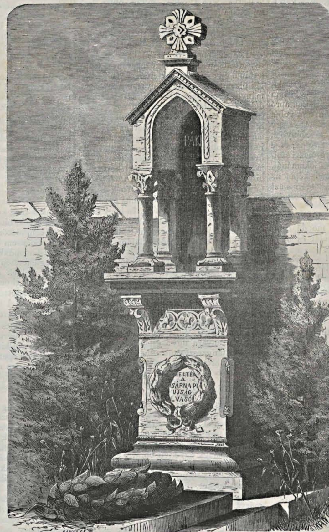
Pákh Albert síremléke a kerepesi-uti temetőben.

— S mégis — mondám később Wigglesworth urnak — mégis csak jobbat vá-laszthattak volna ennél. Mig önk a tárgy fölött vitakoztak, legalább is egy tucszat egyszerű és természetes kifejezés lepett meg mind az anya, mind a leány ajkairól. Ezek valamelyikét bizonyára eredetibb