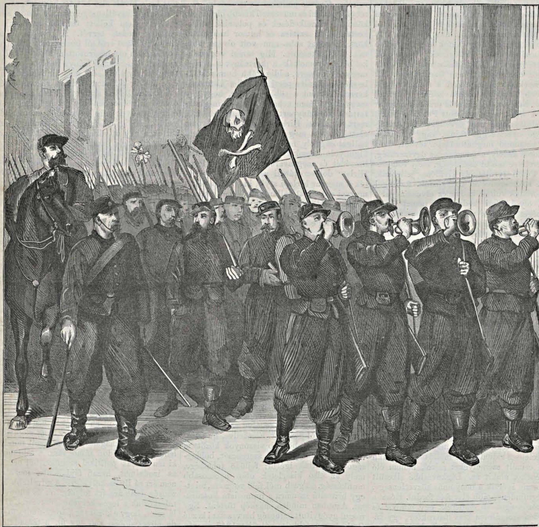
Toursból kivonuló franc-tireur csapat.

humor geniusza nem hagyta el kedvencz gyermekét. Ott lebegett fölötté és szárnyával fedezte. Törhetlenné edzette lelkét s vidám mosolyba olvasztotta könyeit. Nem engedte elzordonulni kedélyét, kiapadni az annyi nemes érzés forrását. Ott ült beteg ágyánál, elkísérte a szerkesztői asztal gondoljához, társaságba vezette, fel-felmutatva az élet hiu küzdelmeit, elringatta fájdalmát s a lemondás erejét s a megnyugvás vigaszát lehelte szívébe. Az író humorista rég megholt Pákhban, de a beszélő humorista foly-