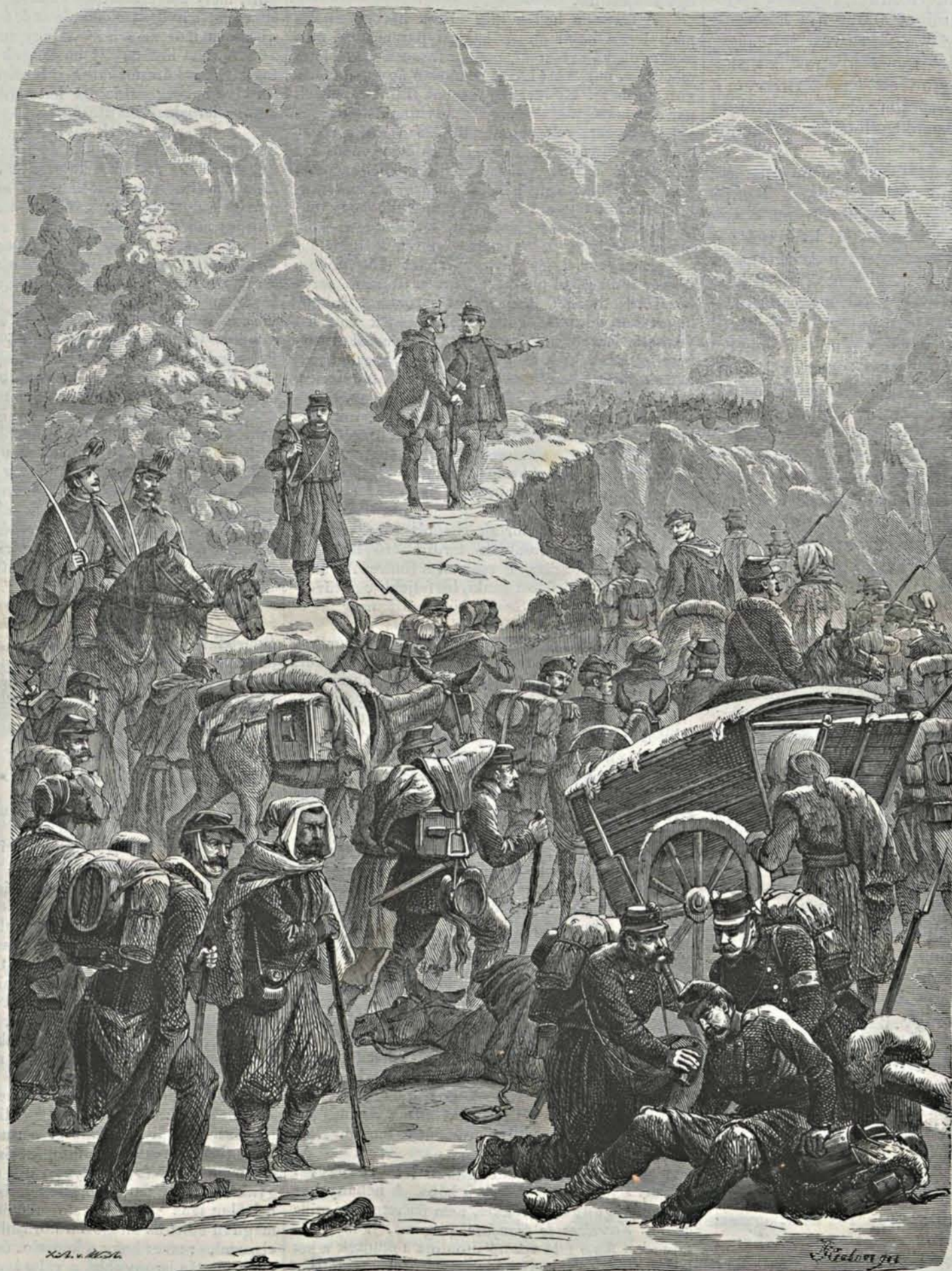
Bourbaki seregek visszavonulása a Travers-völgyön át Svajczban.

A ki durva kezét a védtelen nő meztelen vállára sulyosítja s másik kezével tört szegez mellének: az a porosz király, vagyis inkább Németország császára. Mellette egy éreztisakos tábornok áll (melyik? mind egyforma), ki szintén tört tart kezében s az aláírni vonakodó kezét az irathoz szegezni fenyegetőzik. Szemben a harcz-intéző Moltke, mohón, szivtelen ridegséggel mutat az iratra: ird alá, s a modern politika nagymestere,