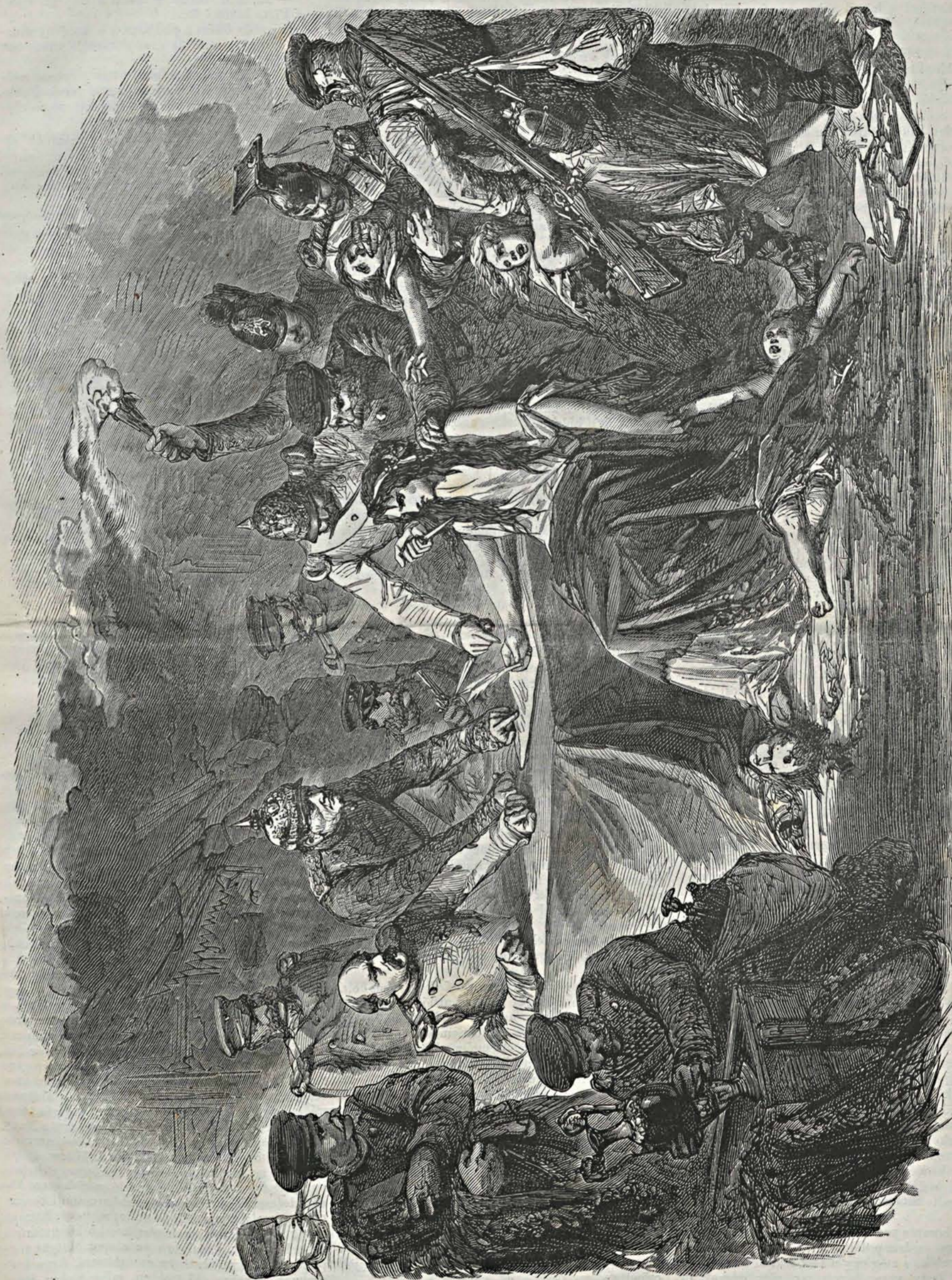
Franciaország, a mint a békét aláírja.

A többi személyzet sem áll tétlenül a csoportban. Egyik fátylát lobogtat magasra, melyet a felgyújtott paloták üszkeiből hozott. Néhányan a zsákmányt, a sok drága arany-ézüst marhát