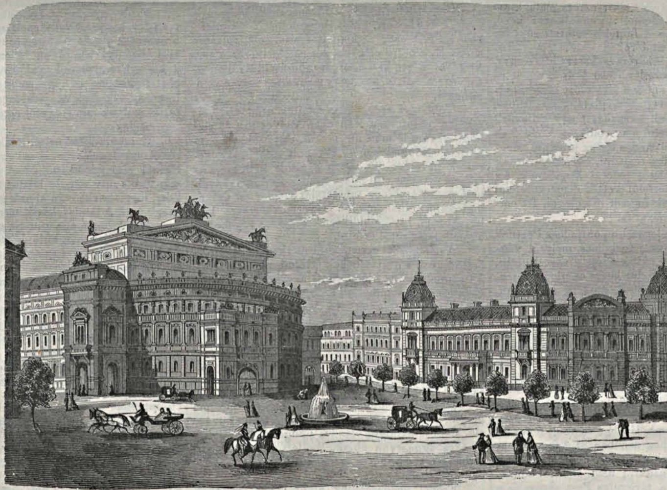
A pesti sugárut torkolata. — (Linzbauer terve szerint.)

győzelmeinek neveivel díszített königrázi utcán, továbbá a Halle-téren föllállított óriási Berolina-szobor, a Victoria megkoszorúzott szobra s Metz és Strassburg városok szobrai mellett elhaladva, végre a brandenburgi kapuhoz, Berlin „Arc de Triomphe“-jához érkezett. E diadalív pazarul