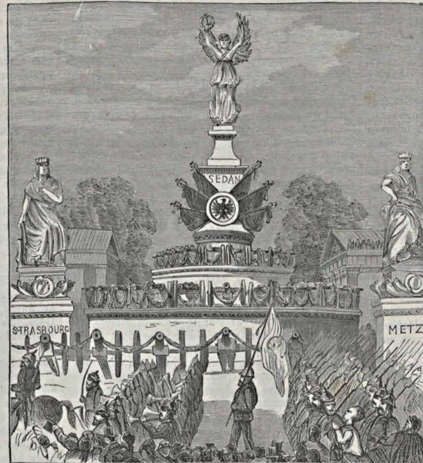
Győzelmi szobrok a berlini diadalünnepen.

Sok világot látott utazók mondják, hogy a világnak, az egy Konstantinápolyt kivéve, nincsen országos fővárosa, mely oly gyönyörű kilátást nyújtson, a milyet Buda-Pest nyújt, ha