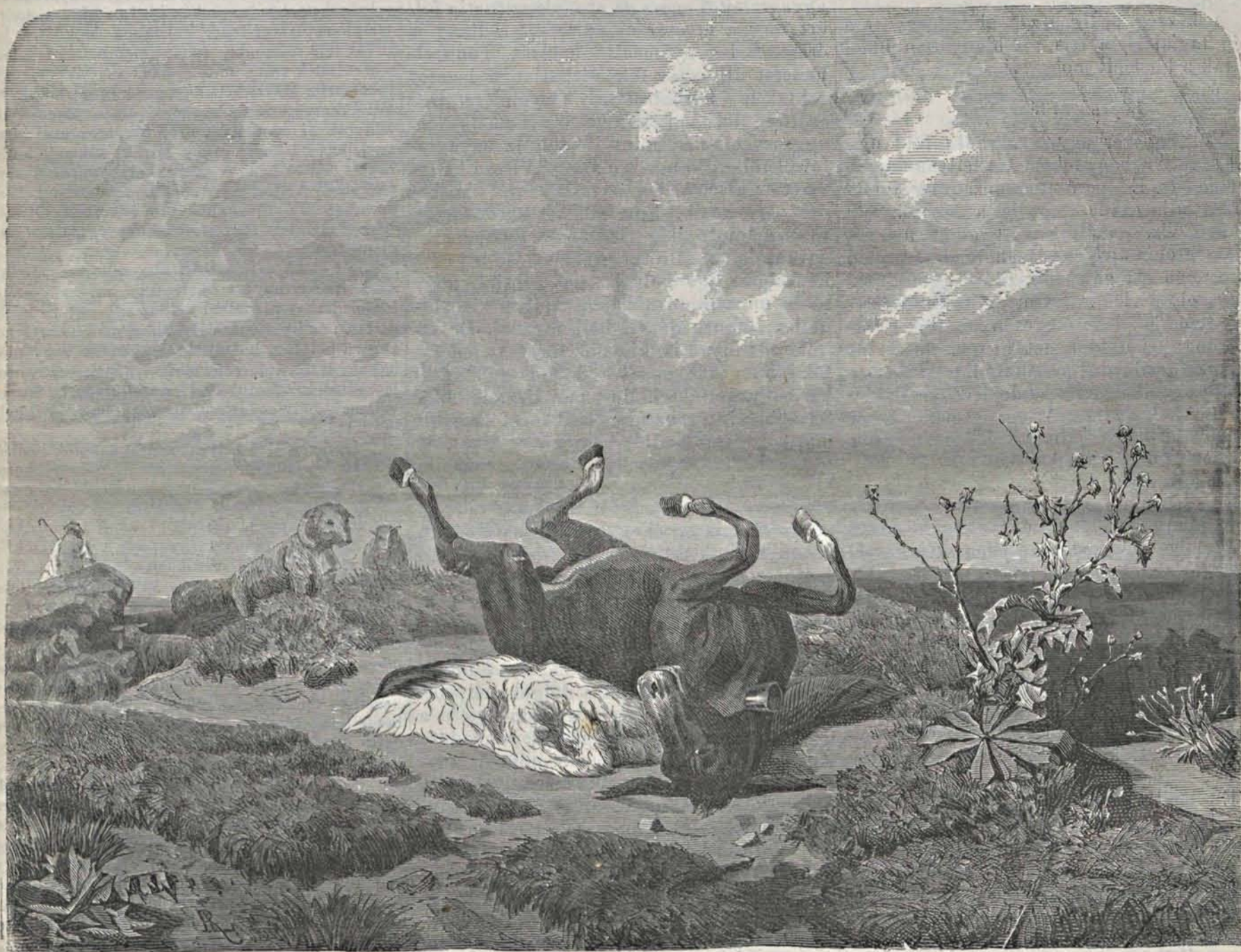
A felhasználó alkalm. — (Lóts Károly festménye után.)

„Mint a szomjú szarvas Siet a forráshoz, Ugy siessünk mink is A szűz Máriához“ —