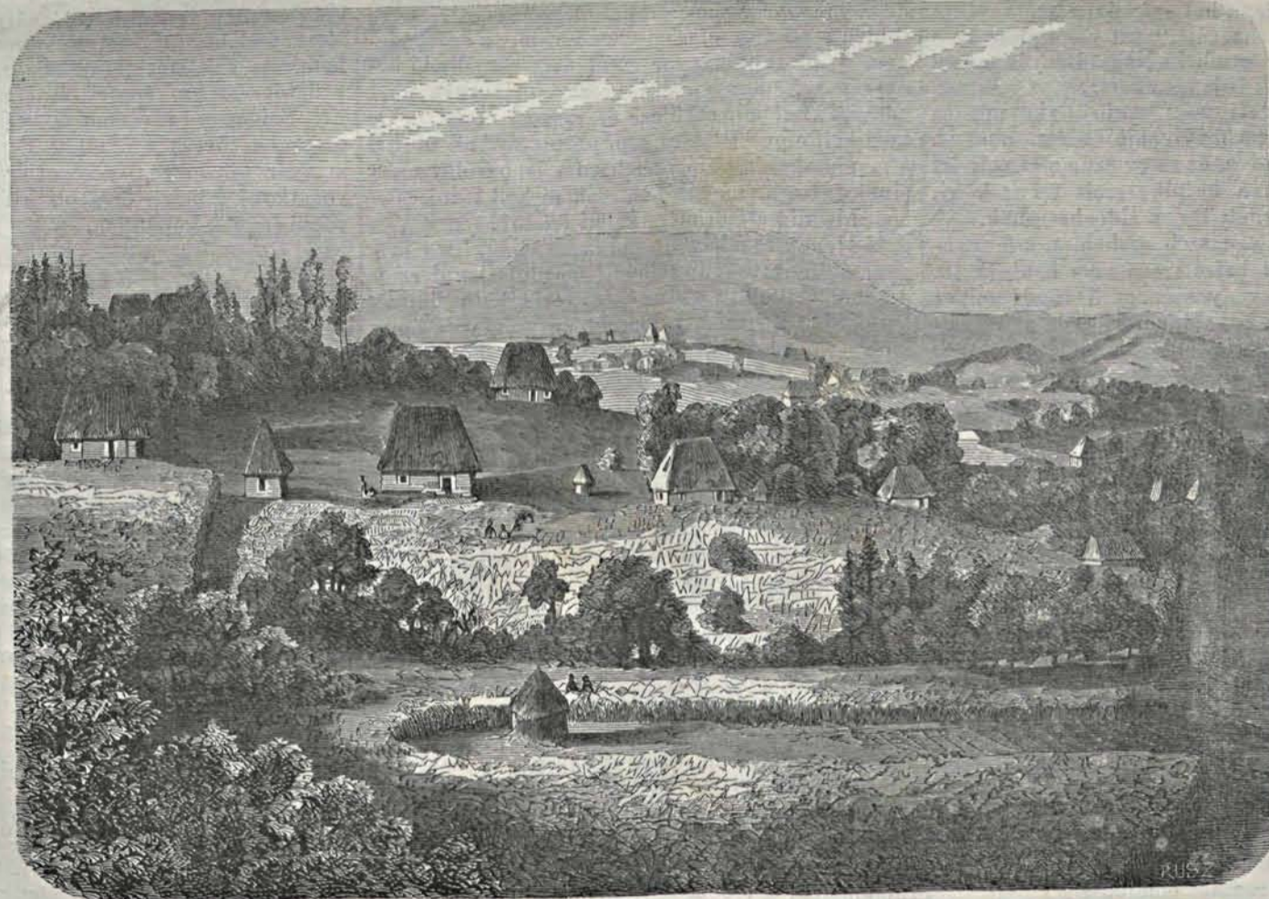
Sátor-hegy Sztokjafalvával (Erdélyben).

A patriarcha erre egy abszolút feliratot intézett a fényes portához, melyben határozottan kimondja, hogy a patriarchai szék sohasem fogja elismerni a császári ferman, mert az nem egyházi tekintélyek megkérdéséből származik, hanem laikusokból álló bizottmány véleményére támaszkodik. A patriarcha különösen a „bolgár egyház” elnevezéssel nem tud megbarátkozni. Vádolja a bolgárokat, hogy elragadták a görögöktől az iskolákat, egyházakat, a püspököket kigunyolták, lábba tapodták a polgári törvényeket és a császár jogaiba markoltak; mind-ezen kihágások ellen felhívja a török kormány igazságos ítéletét, s kéri, hogy az igaztótak példásan megbüntesse. E sérelmek elősorolása után kifejezi azon szándékát, hogy ekumenikus zsinatot fog összehívni, mely a fontos ügy felett határozson,