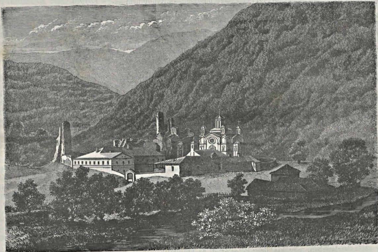
Ravanicza zárda Szerbiában

Miként minden más országban a középkor ötödik századai alatt, úgy Szerbiában is a zárdák igen fontos szerepet játszottak. Az utazó minden lépten-nyomon akad egy-egy nevezetes zárdára, és a szerbek hazájában büszkén mutat a vezető egyik-másik efféle ódon épületre, de azok közül egyre sem oly büszkén, mint a híres Ravanicza zárdára, mely a hasonnevű folyócska által képezett mély völgyben fekszik. Három nagy név, melyek a nagy szerb biro-