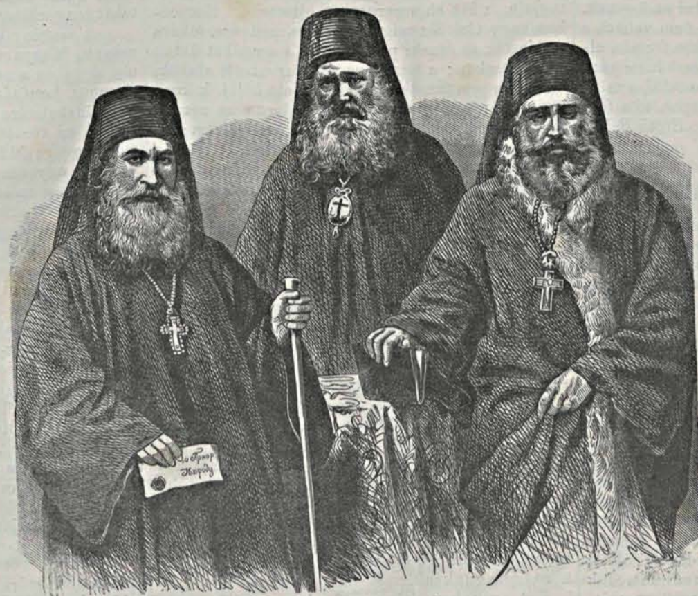
A bolgár nemzeti egyház előharcosai.

A képviselők visszatértek szülőföldjükre, s foganatosítani iparkodtak azt, a mi elvben ki van mondva.