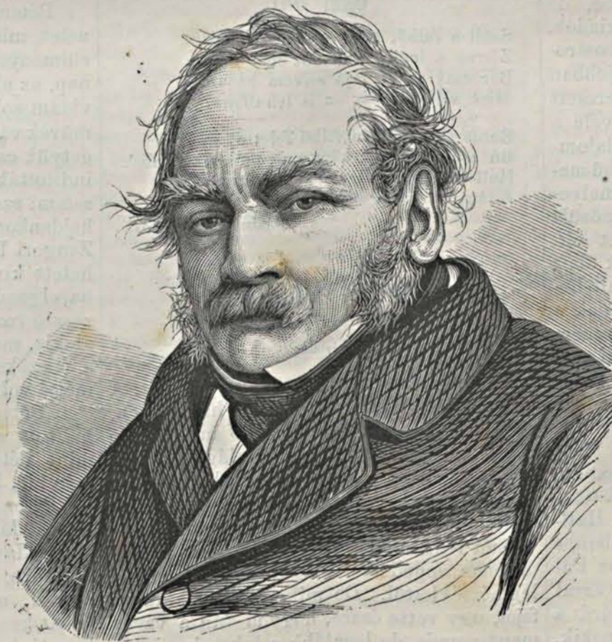
PAUL DE KOCK.

első neje elhalván, másodsor nősült s Párisban telepedett meg. A nagy forradalom itt találta; s Dumouriez-val közeli ismeretségben állván, ennek közbenjárása segélyével a köztársaság északi hadseregének élmezését nyerte meg, mi igen jövedelmező vállalatnak látszott. Az is lett volna valószínűleg, ha közébjött események Kock reményeit, életét, családja jövőjét, mindent meg nem semmisítettek volna. Kock maga is dühös republikánus s rajongásig hive uj hazájának, nem elégedett meg az élmezési tisztséggel, hanem a fegyveres sorba állott, hősileg küzdött Jemappes-nál, Valmy-nál s ezredesi rangot nyert. Barátja Dumouriez árulása s átszökése után visszatért Párisba, a fölzúdulat szenvedélyek által gyanusnak találtatott, elfogatott s a forradalmi törvényesség által elítéltetvén, ki is végeztetett. Neje is börtönbe vettetett, de terhes állapotára való tekintetből mégis megkegyelmezték neki és szabadon bocsátották. Így szülte, szomorú özvegyiségben, halál félelmek közt, úgy szólva a