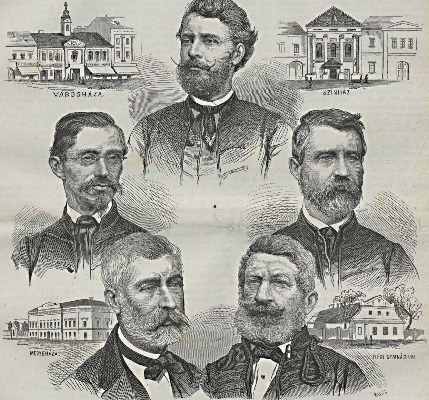
A magyar orvosok és természetvizsgálók aradi nagygyűléséről.

bonne-t és a „Conservatoire des arts et métiers“-t látogatta. Sok ismerettel térvén haza, melyeket folytonos önművelés által is gyarapított, a mezőgazdaság és ipar terén érvényesíté azokat először is; minden e téren felmerülő jelenséget figyelemmel kísért, s mint praktikus gazda, nemcsak a hazai kiállításokon, de a londoni világiállításán is feltűnt s érmeget nyert kiállított termékeivel, melyek mind az állat — mind a növény- (különösen dohány-) termelés legkiválóbb példányait mutatták föl.