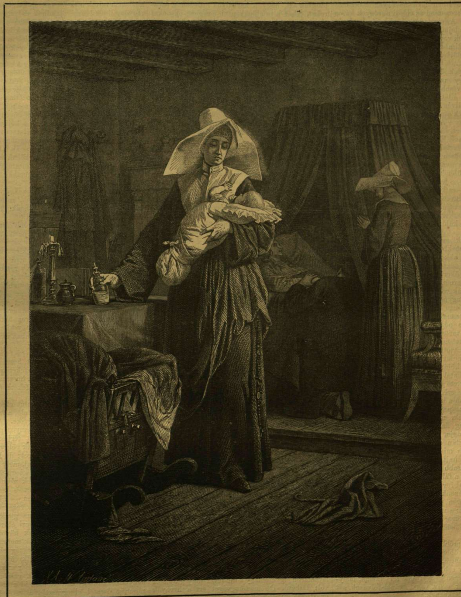
Az apáca. — (Szekely Bertalan festménye után.)

A természeti tünemények újabb szemlélete a betegségek okainak fölfogására nézve is változást hozott létre. Régebben azt hitték, hogy minden betegség elhárítására külön-külön, egy e célra teremtetett óvszernek kell léteznie; ma a mindinkább fejlődő gyógytudomány egész bizonyosság-