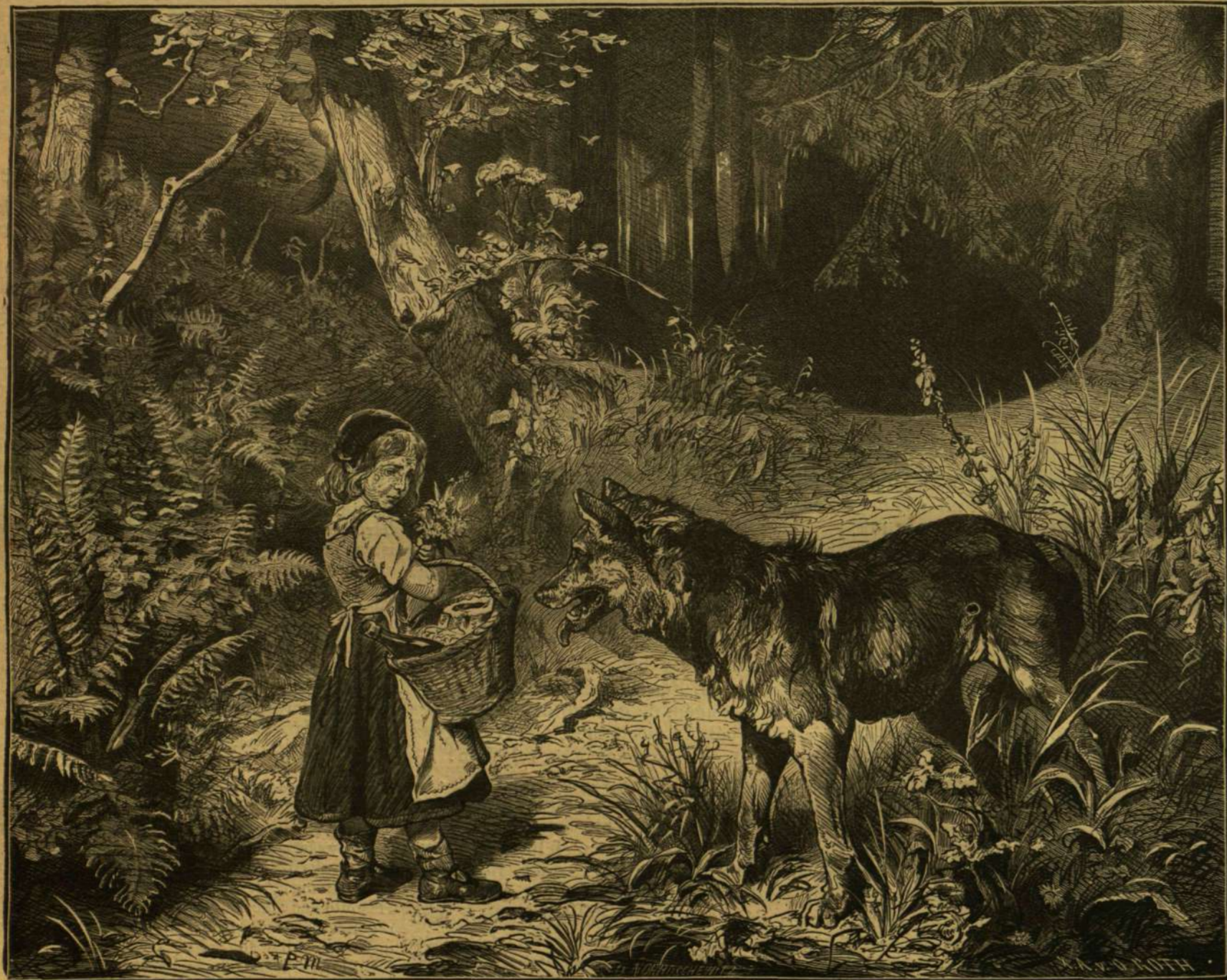
A vörös bóbítás kis leány.

A halottas ágytól nem messze, egy irgalmas nővér imádkozik, telve hittel és áhitattal. Egy másik apáca pedig — kiről a kép is nevezve van — az ártatlan, de „gyilkos” újszülöttet tartja karjain, ki éltével egy másik életet a sirba vitt. Az apáca tejjel telt üveget emel a kicsinyke ajkához, melynek az anya meleg keblét kellene helyettesíteni. A halvány szerzetesnőt földig érő