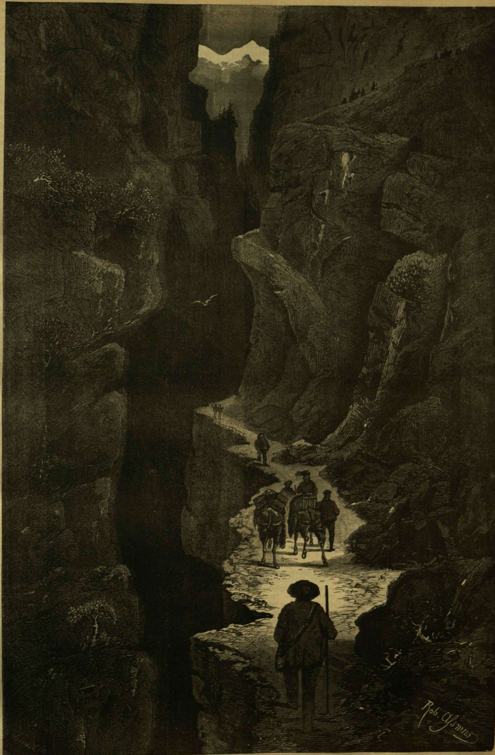
A Gemmi-szorosut Wallis-kantonban, Svájcban.

A szt. gotthárdi ut, mely e sziklaívalon visz keresztül, az Alpések leglátogatottabb hegyi utai közé tartozik. Épen ezért mindig a legjobb karban van tartva. Legmagasabb pontján, a tenger színe fölött mintegy 9730 lábnyira, egy hires zárda áll, a hófúvatagok közt eltévedt és szerencsétlenül járt utasok befogadására, mely a szt. bernát-hegyi