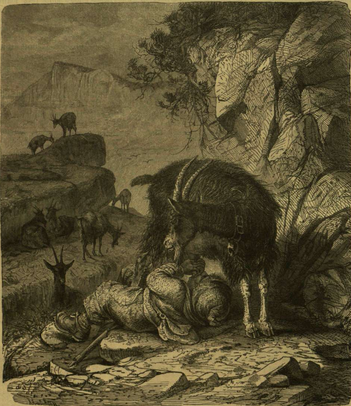
Kecsepásztor a svájci Alpokon.

Csak addig a természet igaz gyermeke, míg saját bércei közt, vagy az örökhóval takart havasok magaslatain él. Midőn itt a rengeteg sivatagban jár legelő kecskéivel, megfigyelve a természet titkait, vagy utánozva a havasi madarak hangját, hallva a marmoták füttyét s bámulva a zergék repülésszerű ugrásait. A havasi kecskepásztor ismeri is az alpok minden madarát, elvezet meg fészekükhöz is, s megmutogatja a helyet, hol a legkritikább növények s virágok tenyésznek. Mennvi napot tölt el a félelemgerjesztő havasi zivatar közelében, mely pokoli tárogatójával bejár minden helyet! A sikamlós meredekséget hányszor mászsa meg szeges bakancsában, s vastag, hegyes szegben végződő botjával, daczolva mindennel, mi útjában áll, s felérve a magas csúcsra, büszkén néz onnan szét a világba. A havasi kecskepásztor többnyire barna, erős testalkattal. Ha megsomuzjuk, könnyen föltalálja magát, oda fekszik egyik kecske alá, s kezeivel szája feji tejét. Jobban esik neki, mintha kényelmes karszékben — pohárból inná. Képünk is épen ily helyzetben mutatja a havasi kecskepászort.