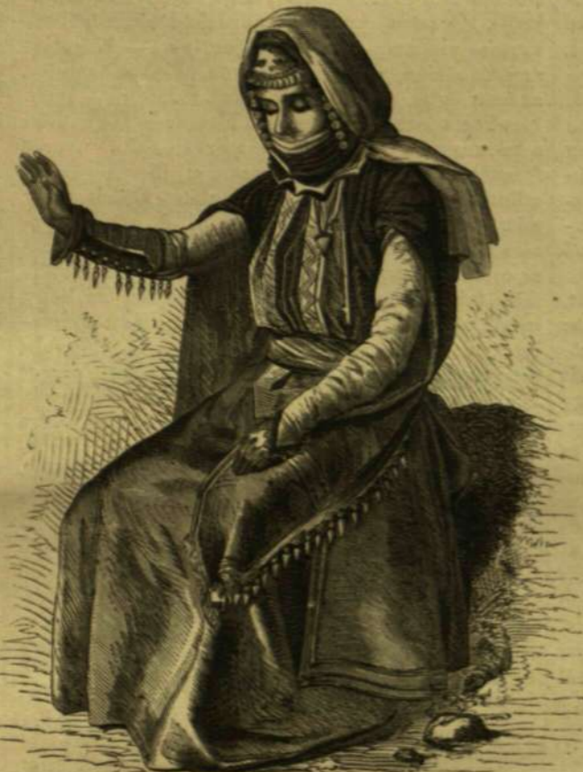
A Kaukáz népe: Örmény nő.

Madagaskár szigetének forró, nedves levegőjü mely völgyeiben egy sajátságos fa tenyészik nagy mennyiségben, a mely e tropikus tájakon, főleg az utazókra nézve, kimondhatatlan áldásnak tekin- tethető. E fát, melynek tudományos neve Urania speciosa, a bennszülöttek Ranivalá-nak, az európai települők pedig „utazók fájának“ nevezik. A ma- dagaskáriai nyelvén ranivala annyit jelent, hogy: az erdő levele. A szép növényű fa törzse vastagon és nedvdúsán emelkedik föl a környező mocsári növények buja erdejéből, hasonlóan a pizánghoz vagy a strelitzia nagyobb fajtáihoz, a mely nö- vényeknek más tekintetben is rokontermésze- tünek látszik. Törzséből hosszú, széles leveleket bocsát szét, olyanokat, mint a pizanglevelek, csak fogak nem oly törekenyeket és az urania levelei nem is állanak, mint a pizángnál, kerekén a törzs körüli, hanem egymással szemben kitévelől s az egész meglehetősen hasonlít a legyező alakjához. Miután a törzs elérte a tizenkét lábnyi magassá- got, külső kérge alatt keménynyé s szárazú lesz,