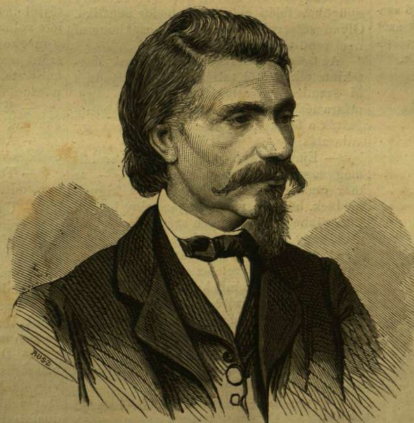
BEBEL FERDINÁND ÁGOST.

Bebel 1840-ben született Kölnben, szüleit korán elvesztette s a legszükségeseb ismereteket is csak a brauweileri és wetzlari népiskolákban nyerte. 14 éves korában megtanulta az esztergályos mesterséget, beutazta Délnémetországot s Ausztriát, s 1860-ban Lipcsében telepedett le, a hol 1864 óta önálló üzletet folytat. Ez egyszerű szerény élettörténete, a melyet azonban az eszméért küzdelme sokkal változatosabbá s érdekesebbé tesz. 1863. őszén Lassalle lelkes szavai őt is magukkal ragadták, teljes odaadással igyekezett közreműködni az eszme létesítésén; 1867 óta a Liebknecht által szerkesztett „Demokratisches Wochenblatt“-ban megkísértette az írói működést s már 1868. augusztusban a neuenburgi szocial-demokrata gyűlés elnöke lön, s ott a munkások nemzetközi egyesületéhez csatlakozást indítványozta a jelenlevő tagok zajos éljenzése között. Bebel neve ekkor lett először ismeretes a nagy közönség előtt, s azóta fokozatosan emelkedett hírnevében. Ő volt az, a ki indítványozta, és csaknem teljes szorgalommal folytán keresztül is vitte, hogy a német szocialisták nagy része az 1869-ki eisenachi kongresszuson véglegesen elvált