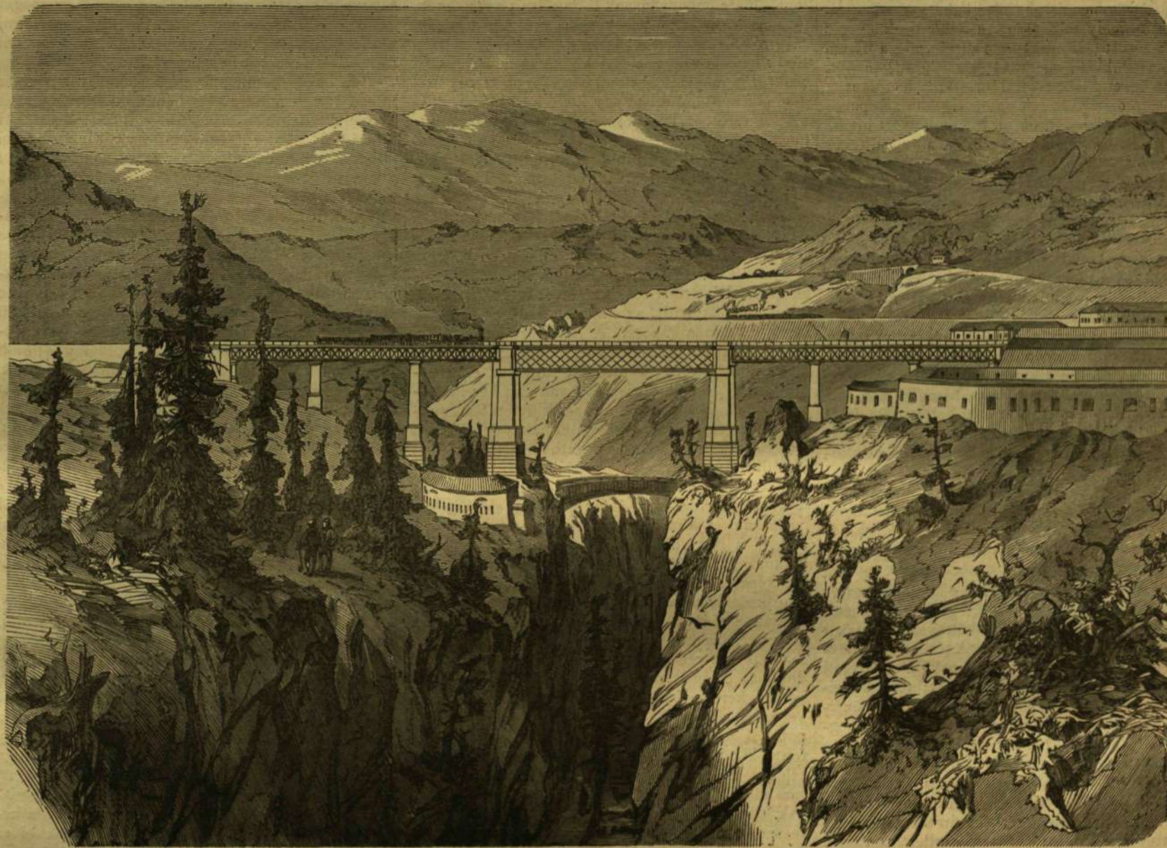
Vasuti hid az Eisack fölött a brener-pusztervölgyi vaspályán.

Bámulat fogja el az utazót, midőn a régi kor egyszerű építményeit szemléli, habár csak romjaiban is. De mennyivel őszintébb, mennyivel