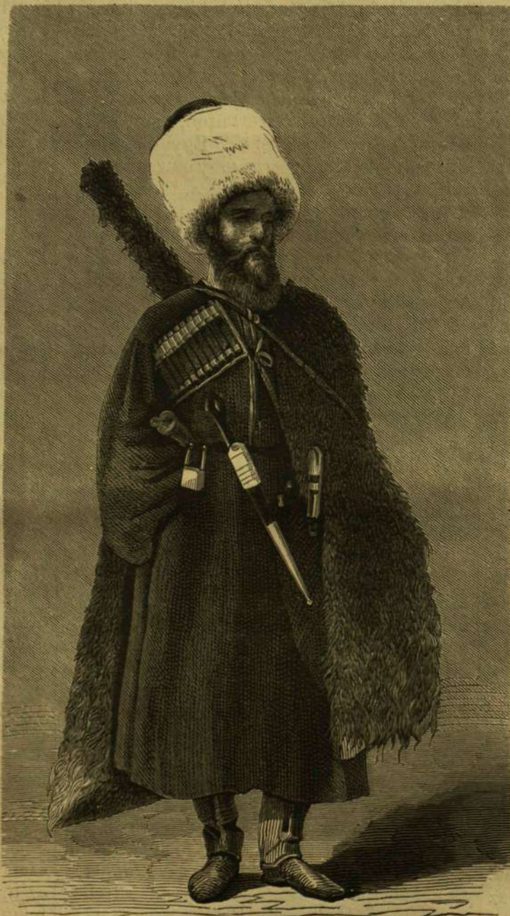
A Kaukáz népei: Kirgiz-kozák.

elbeszélés alatt. Szerencsére haza jött a gazda és nemsokára berohantak a gyerekek is az iskolából. Tüzzől pattant, piros pozsgás, virgoncz gyerekek. Olyan lármát, olyan elevenséget miveltek a házban, hogy az szinte felfordult bele. De az öreg szénetegőnek öröme látszott telni benne s egész boldogsággal mondá: