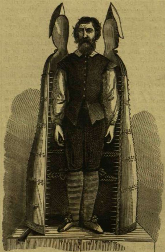
A nürnbergi vas-szűz.

(A dohányszűz királya.) Nemrég halt meg Rotterdam környékén egy gazdag földbirtokos Van-Klaës: a dohányszűz királya, kit földieit a „nagy pipák apjá“-nak neveztek. E különös egyéniségről a francia lapok sok érdekes részletet beszélnek el. Van-Klaës szelíd nyugodt ember volt, de rendkívül bizarr jellem. Mesés vagyonából gyönyörű palotát építtetett Rotterdam közelében — egy nagy pipa- és dohánymuzeummal. Mindenféle formájú pipák, emberi és állati torzalakokkal, virággal és különböző növényekkel díszítve a dohányszűz legrégibb korából voltak a muzeumban összegyűjtve, eredet és chronologiai rend szerint. Nem lehet elmondani mily sokat költött e különös muzeumba. Örömet lelte abban, ha az utazók hozzá botértek, kiket azonnal sörrel kínálék és zsebeiket dohányval és szivarral megtöltötték. Van-Klaës nemcsak nagy dohányszűz, de