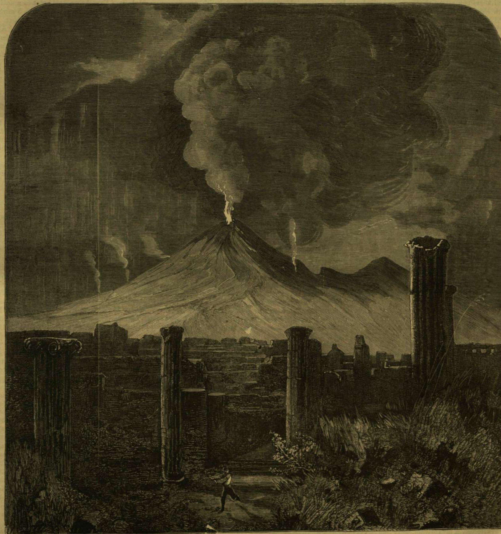
A Vezuv kitörése, Pompejiből tekintve.

borzasztó tűzfolyó mélysége, mely a régi római várost elárastotta és betemette, porrá égetve minden elérhetőt, a mit utjában talált. Azóta termékeny talaj képződött felette; fák és kertek, virágok és borágak nőnek az eltemetett város fölött; házak, utcák és templomok épültek rá, talán azért, hogy ezek is egy jövendő katasztrófa áldozataivá legyenek és egy azután épüldő városnak szolgáljanak nem épen biztos alapul. Két-három mér földnyi, lankásan emelkedő fölmenetel után, az Obszervatorium (Észlelde) mind közelebb s közelebb látszik és az 1859-iki nagy kitörés színhelyétől sem igen vagyunk már messzebb. E kitörés, mely hat hónapig tartott, fönt a