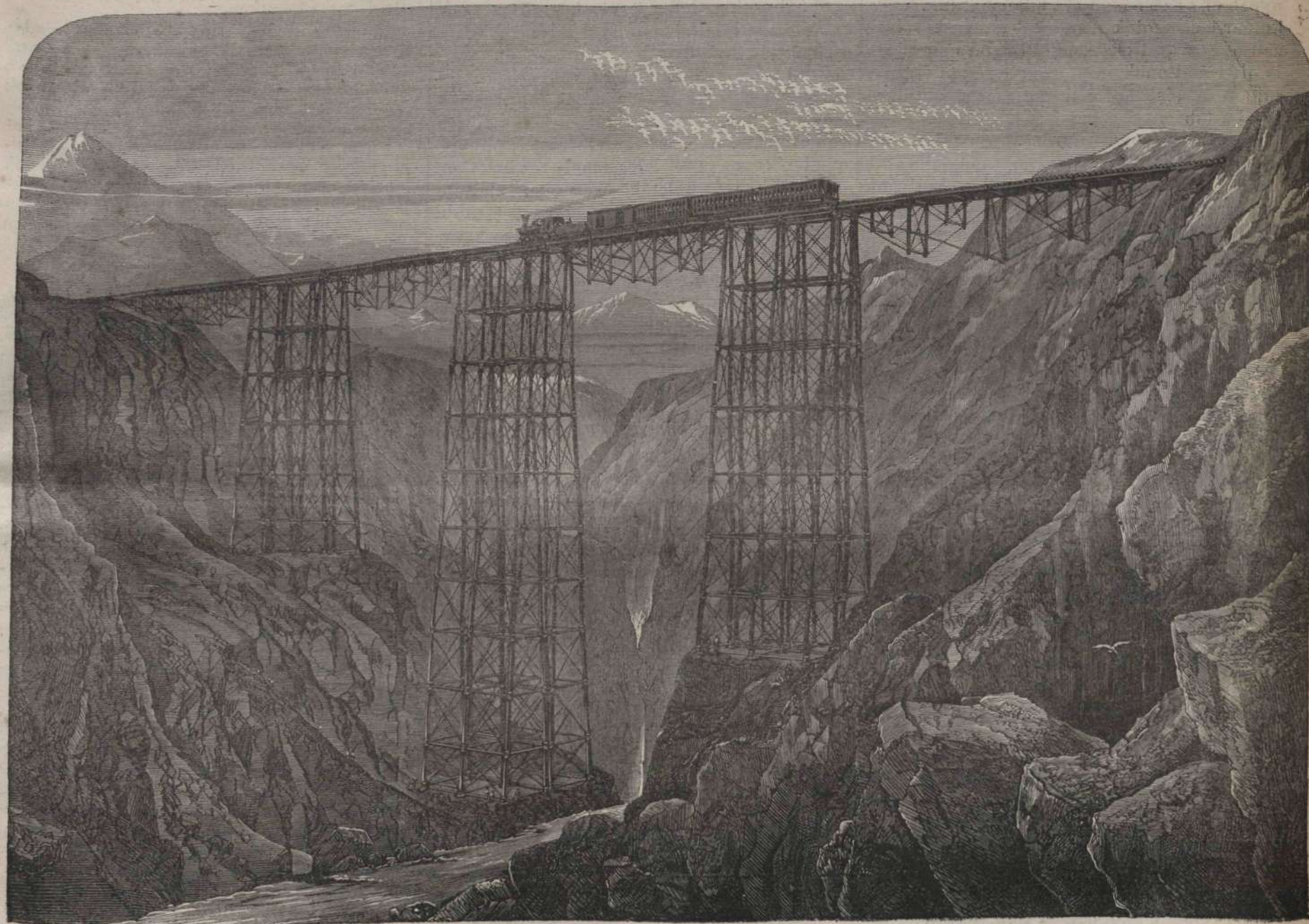
A Varrugas-utvezeték Dél-Amerikában.

lanak. Ennek igen egyszerű az oka. Az elkényeztetett gyermek rendesen olyan, a ki tehetségeit nem gyakorolja; sir, hogy ne dolgozzék, hogy a semmittevést élvezze; szeszélyét követi, s az élet rideg mester-ségét nem tanulja meg. Ellenben a szigorral nevelt gyermek olyan, a ki dolgozik, kinek esze és szíve az anyai szilárdság befolyása alatt folytonosan fejlődik. Mi természetes, minthogy az elkényeztetett gyermek elromlik, s a szigorral nevelt megtanulja későbbben az életben magát vezérelni!