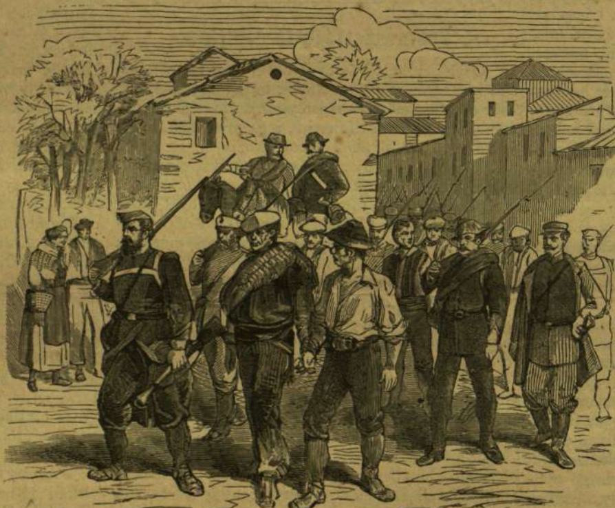
Fogyó karlista csapat.

Ilyen emberekkel és ilyen fegyverekkel akarja visszafoglalni Don Karlos őseinek birodalmát s