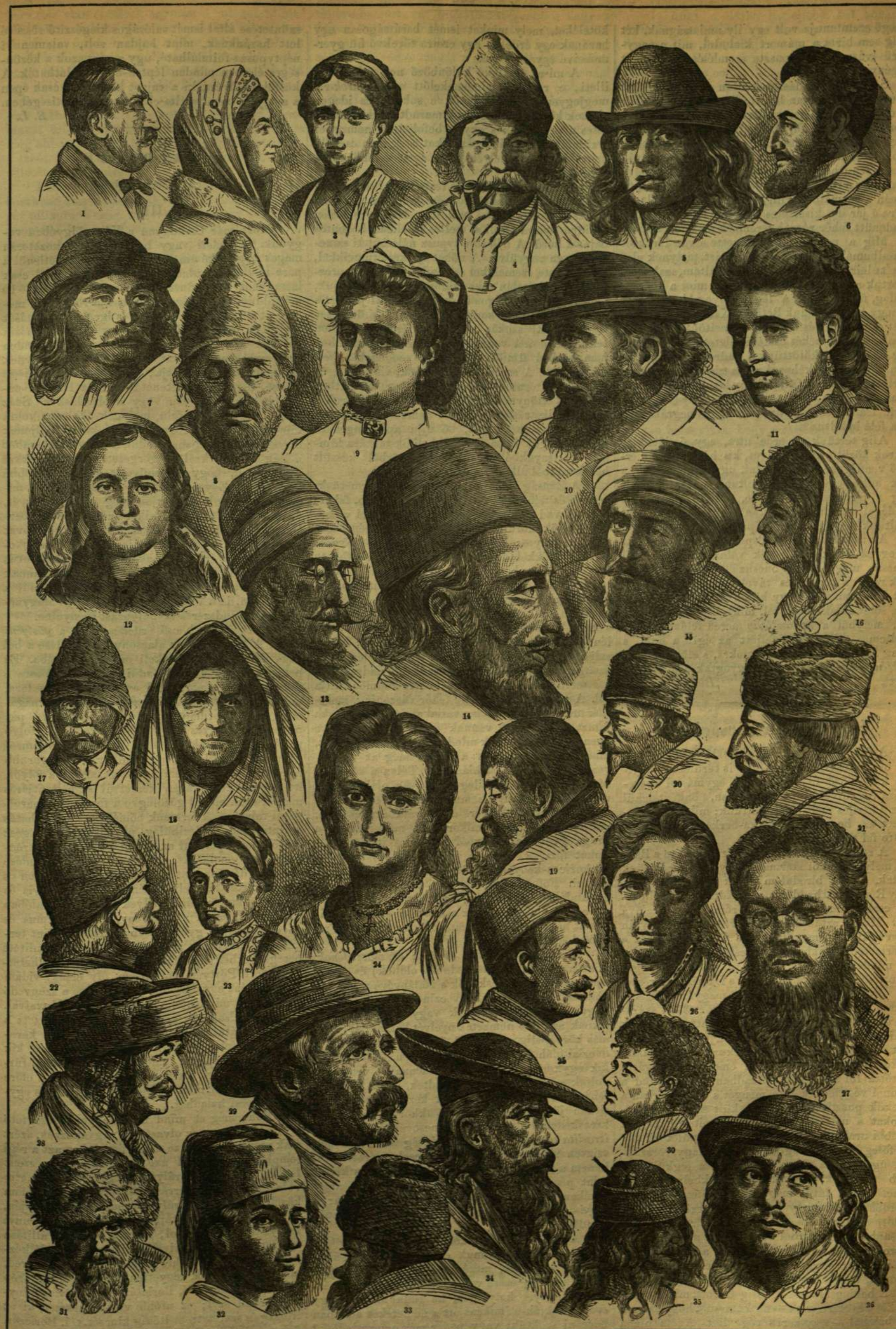
Népjelleg a bányási végvidékről.

Hanem árnyoldal az, ha egy képviselő s pártvezér nem bir azon tulajdonságokkal, miket a ragyogó elme mellett is (s ezt épen az ő példája mutatja) csak a gyakorlat ad meg: a nemes humor s a szókrateli élnétség fegyverével. Nem korrektség az, mit föltétlenül kívánunk; de gondosság. S csodálatos tulajdonsága lelkünknek, hogy az alak és anyag benső összhangját külsőleg is megkivánjuk, és Stuart Mill ragyogó eszméinél, épen ezen ragyogás nagyságának mértékében, — oly nagyon érezzük az alak hiányát. Az eszmék tömörsége csak bizonyos mérvig ellensége a szókrateli hatásának, és nekünk volt Eötvösünk arra, hogy a kettő egyesíthetőségét lehetőnek tartjuk. A bölcsési szókrateltől van a tartalom mellett is mit várni: nem a lelkesítést, de az öntudatos alak-kezelést. Nekem úgy tetszik, hogy Mill,