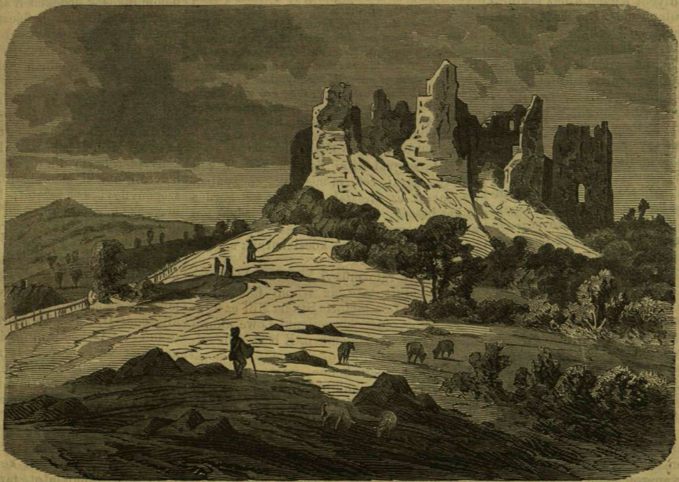
Hrussó vára. — (Benedek Aladár eredeti rajza után.)

Természetesen kísértetei is vannak Hrussónak, mint minden valamirevaló romnak; sőtét éjeken, s különösen olyankor, ha a vadásztörvények az élőknek tiltják a vadászatot, — a kihalt várból rég meghalt vadászok csapata vonul ki. Felverik az erdőt, szétriasztják a vadakat s végre nagy lakomát tartanak, a hol aztán annyi bor elfogy, hogy egyszer egy eltévedt favágó, ki akaratlanul