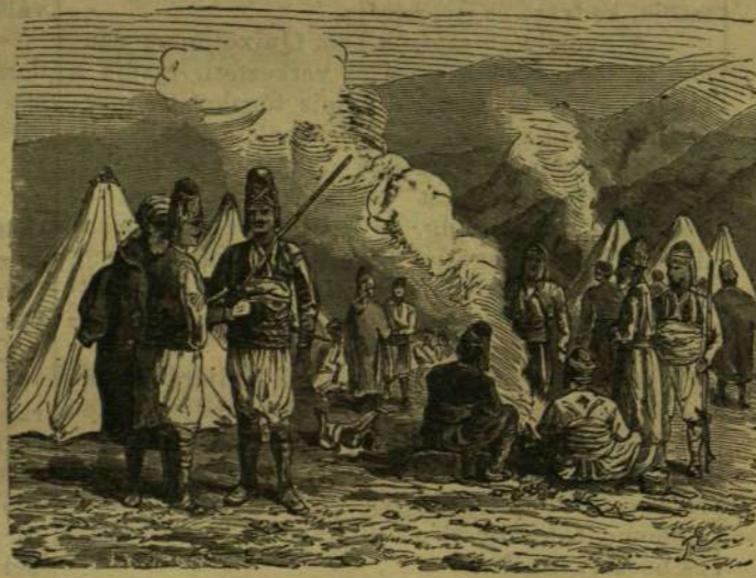
Basi-bozak a taborban.

— (Sibiria áldozata.) A Bajkalan tuli terület hiv. lapja szerint Moszkvába évenként átlag 7000 fogoly érkezik, kik aztán Tomskba s keleti Szibériába tovább szállítatnak. Minden évben ápril vége felé kezdődőleg hetenként foglyokat vivő vonatok mennek Moszkvából Nisni-Nowgorodba; egy ily vonat 400 fegyenczet visz, Nisni-Nowgorodba évenként átlagosan 9300 fogoly érkezik, a birodalom minden részéből szállítatva; Kazanba — mely szintén a szibériai uton fekszik — 1100 érkezik. Nisniből Permbe a fegyenczet hetenként 250 emberből álló csapatokban szállítatnak; ez utóbbi helyen évenként 11,150 fogoly fordul meg, innen aztán hetenként 700 emberből álló csapatokban szállítatnak tova Tjumenbe. Tjumenben az egy éven át ott megkezdő foglyok száma 12,000-re növekszik, innen aztán 700 embernyi csoportokban gőzhajókon tovább szállítatnak. Tobolskban kezd szétoszlan a tömeg; mintegy