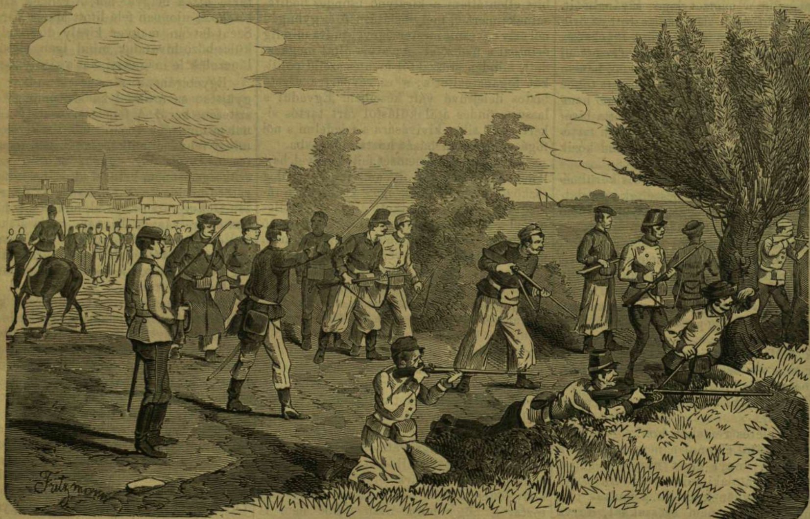
Szabadságot katonák őszi hadgyakorlata. — (Frigyes rajza.)

Moltke tábornok, akkor még csak kapitány, törökországi útjára 1835 őszén indult. Hosszas utazás után a Dunán lefelé, Bolgárországon és a Balkán-hegységen keresztül (akkor a balkáni félszigeten még hirt sem volt a vasutnak) végre Stambulhoz érkezett. Ruscuktól idáig száz találéért vállalkozott egy tatár, hogy utazónkat podgyászával együtt elszállítja és az uton az élelemről is gondoskodik „Tatárunk sietteté lovait“, — írja Moltke — „és a tizedik reggel azután, hogy Ruscuktól kilovagoltunk, a napot egy távol hegyesség mögött láttuk fölkelni, melynek lábainál ezüst csik huzódott végig — Ázsia volt az, a népek bölcsője, s a hófedte Olympus és a tiszta hullámu Propontis (Márvány-tenger), melynek sötéten kék tükrén egyes vitorlák, mint mogányi hatyu, fénylettek. A tengerből csakhamar egész