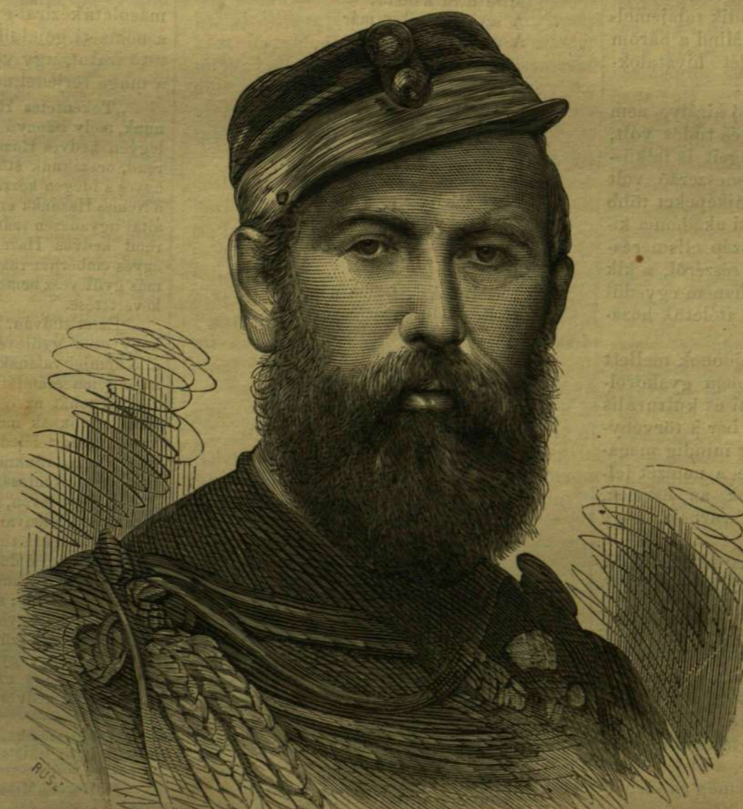
XV. KÁROLY SVÉD KIRÁLY.

A mi a Svéd-és Norvégország közt létező personal-unióknak real-unióvá leendő átváltoztatását illeti, — ez Norvégország ellenzésén hiúsult meg. Így a királynak a nagy tervekből egyedül azt sikerült keresztülvinni, hogy az elévült alkotmányt teljesen átalakítá. Azelőtt Svédországnak nem kevesebb, mint négy rendi országgyűlése volt, külön a nemességnek, külön a papoknak, külön a polgároknak és külön a parasztságnak, s minden jótékony reformeszmé, mely a két utóbbitól netán kiindult, megzök-kent a két előbbinek ellenző magatartásán. Most már négy országgyűlés helyett két kamarája van Svéd-Norvégország törvényhozásának, s így sikerült sok reformeszmé megvalósítása. A törvény előtt most már egyenlő mindenki, a vallásszabadsági törvény egészen szabadelvűvé lett s a társadalmi viszonyok tetemesen meg-