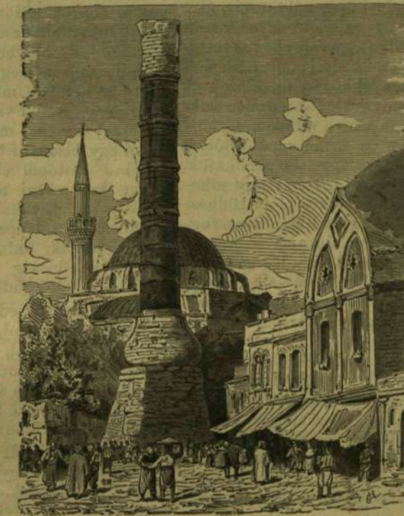
Az „égett oszlop“ Konstantinápolyban.