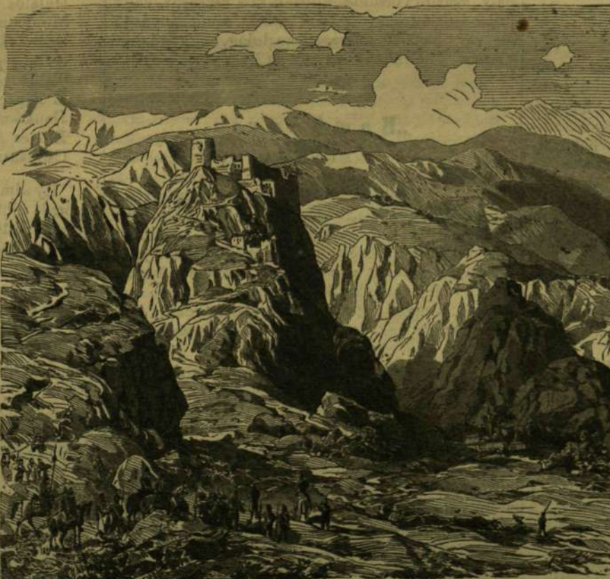
Szeid Bel-Kallesszi kurd erősség.

tehát rólok is, még pedig többnyire igen kedélyes modorban. Atalán véve igen szépeknek írja le őket s végül ezeket mondja: „A folytonosan ülő életmód a török nőket a mozdulatok minden kellemétől, s az elzártan élés s szellem minden élénkségétől megfosztotta s műveltség tekintetében még a férfiaknál is alább állanak egy fokkal.“