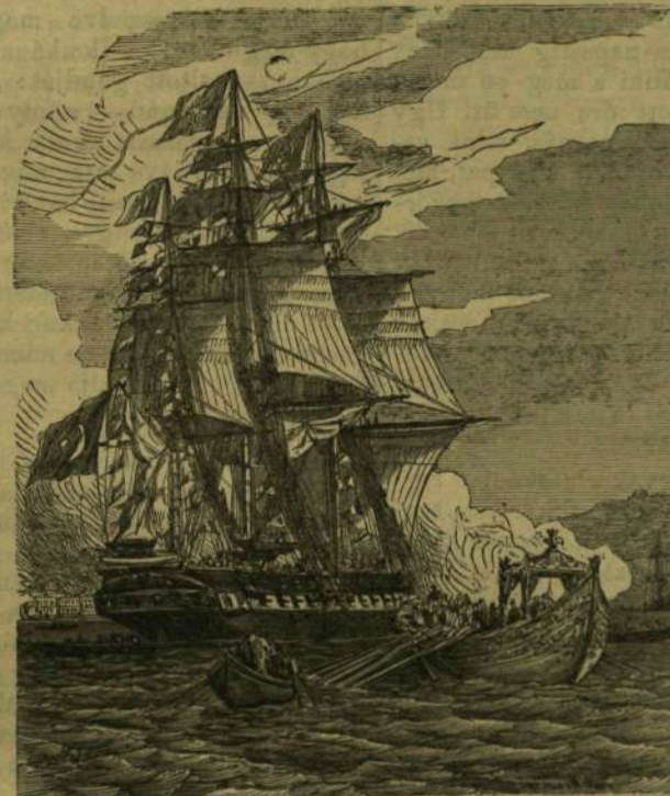
A szultán hajója.