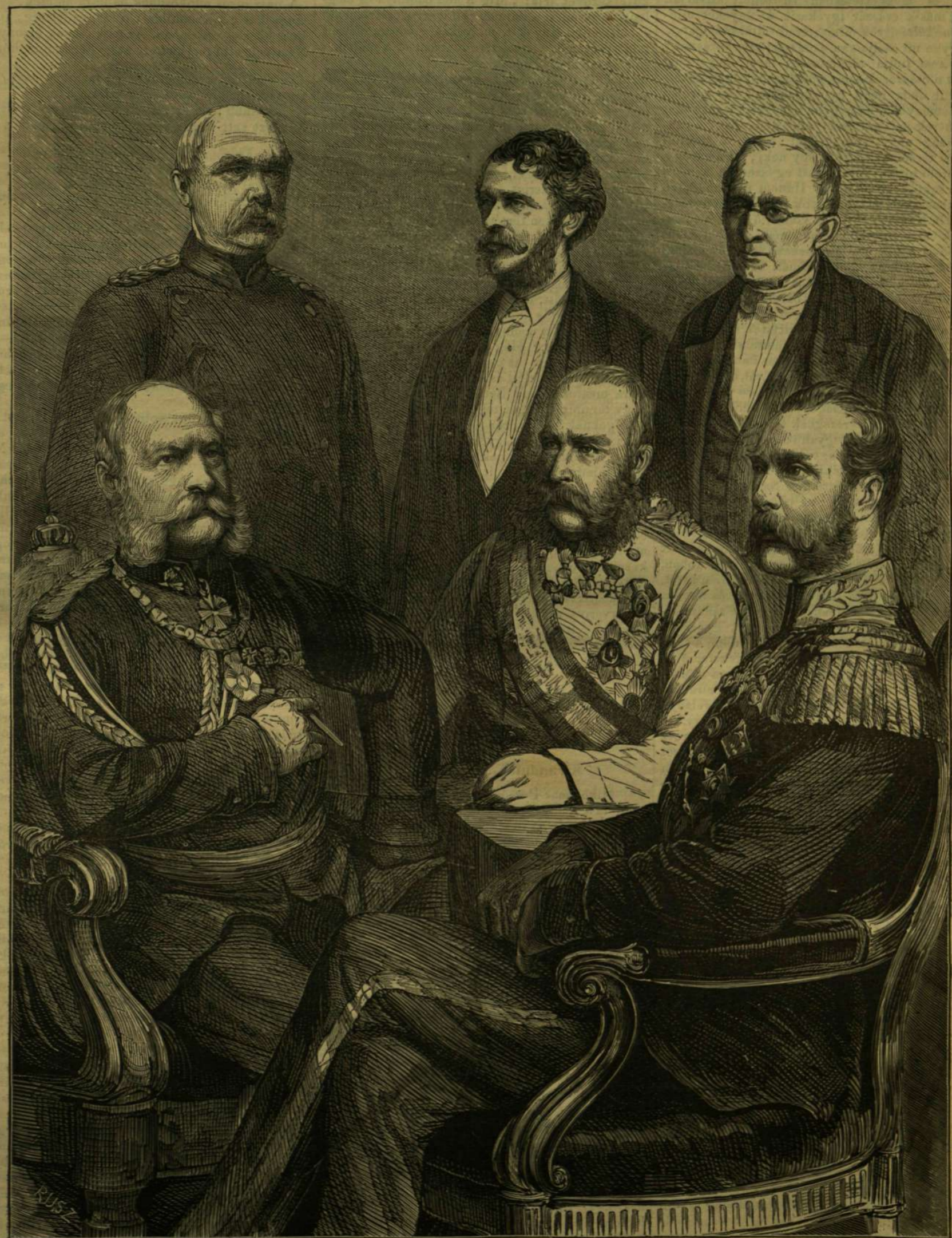
A fejedelmek találkozása Berlinben.

Az egész nyár egyetlen fontos eseménye, melyről az egész világ beszélt, a berlini találkozás volt. Fontosságát még nem lehet megmérni, de