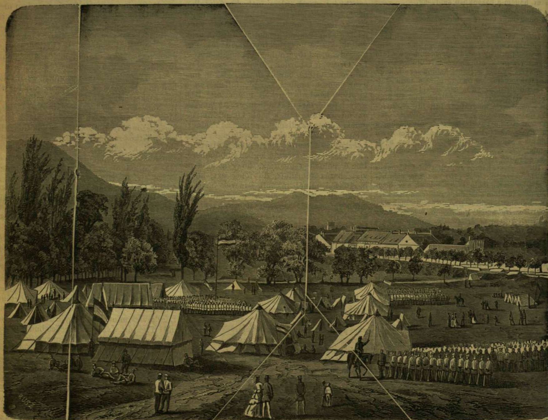
Táborozásja budai város-majorban. — (Fénykép után.)