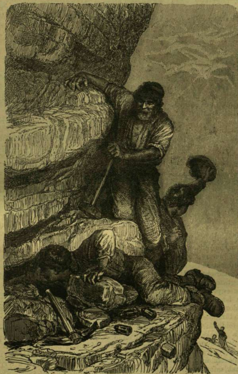
Egy kristálybarlang kinyitása.