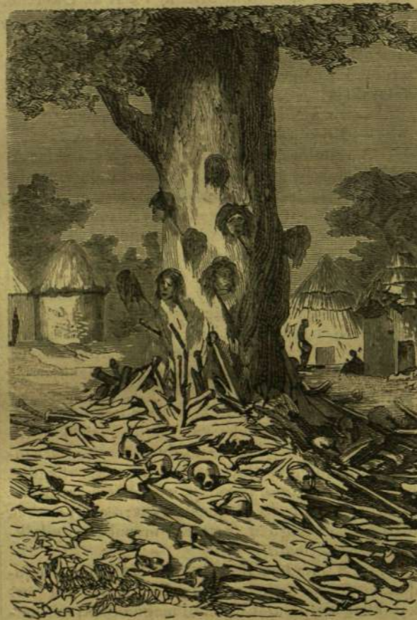
Öt hét léghajón: A kanoonok fája.

Gyorsan megoldák a köteleket. Mesterséges emelkedési eszközzel (vizök elfogytán) nem birva