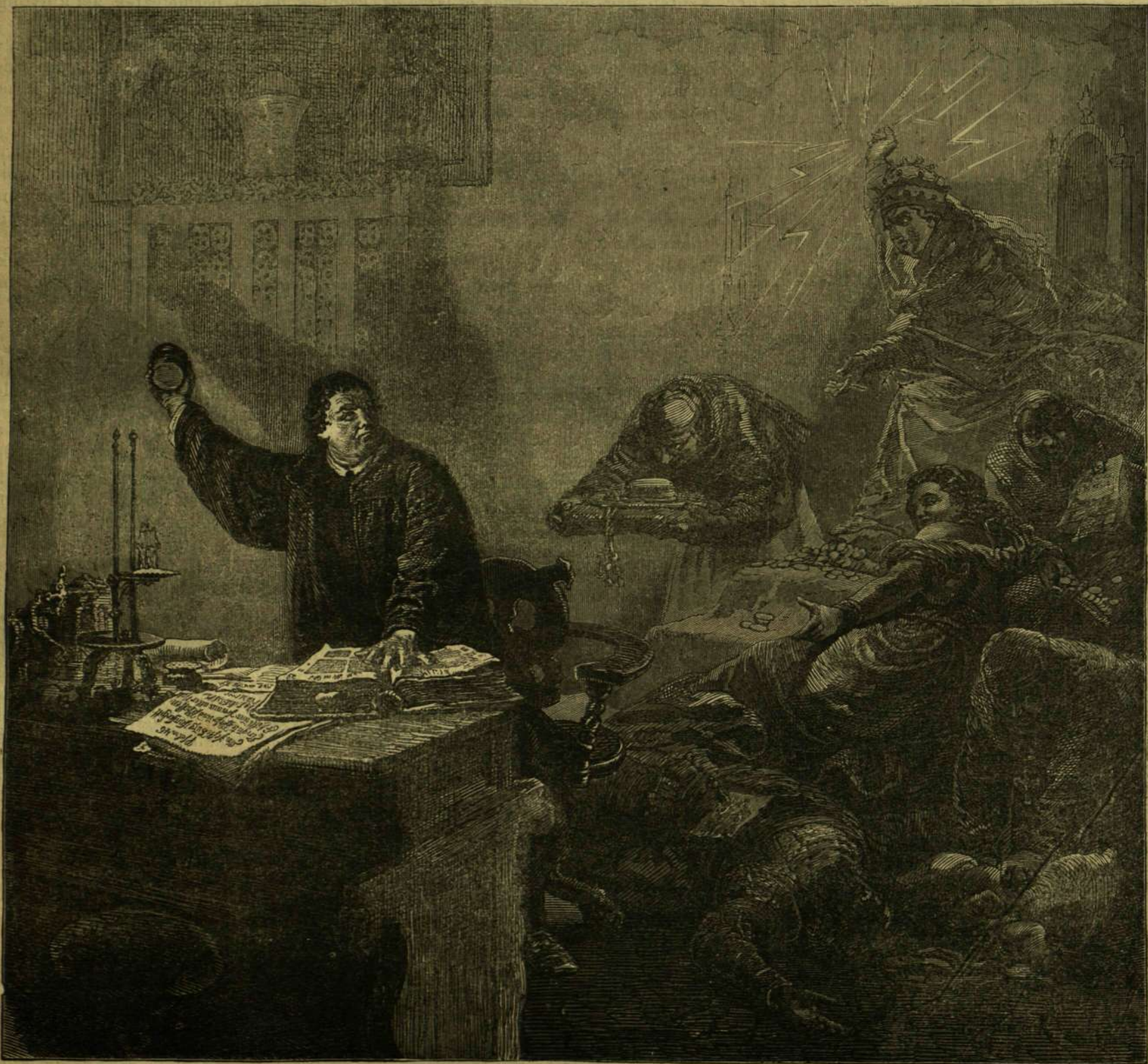
Luther a Wartburgon. — (Zichy Mihály képe után.)

színe alatt még elérte fejét. Ez rá nézve végzetes volt. Kábulva merült föl mindjárt és szédülten kapkodott ide s tova.