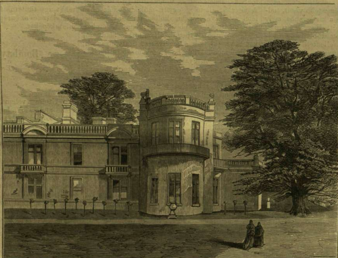
III. Napoleon lakása Chislehurstban. (Cambden-house.)

(Rendkívüli téli időjárás.) Azok megnyugtatására, kik a mostani enyhe napok rosz következményeitől tartanak, egy német lap, régi krónikák nyomán a következő adatokat közli: 1172-