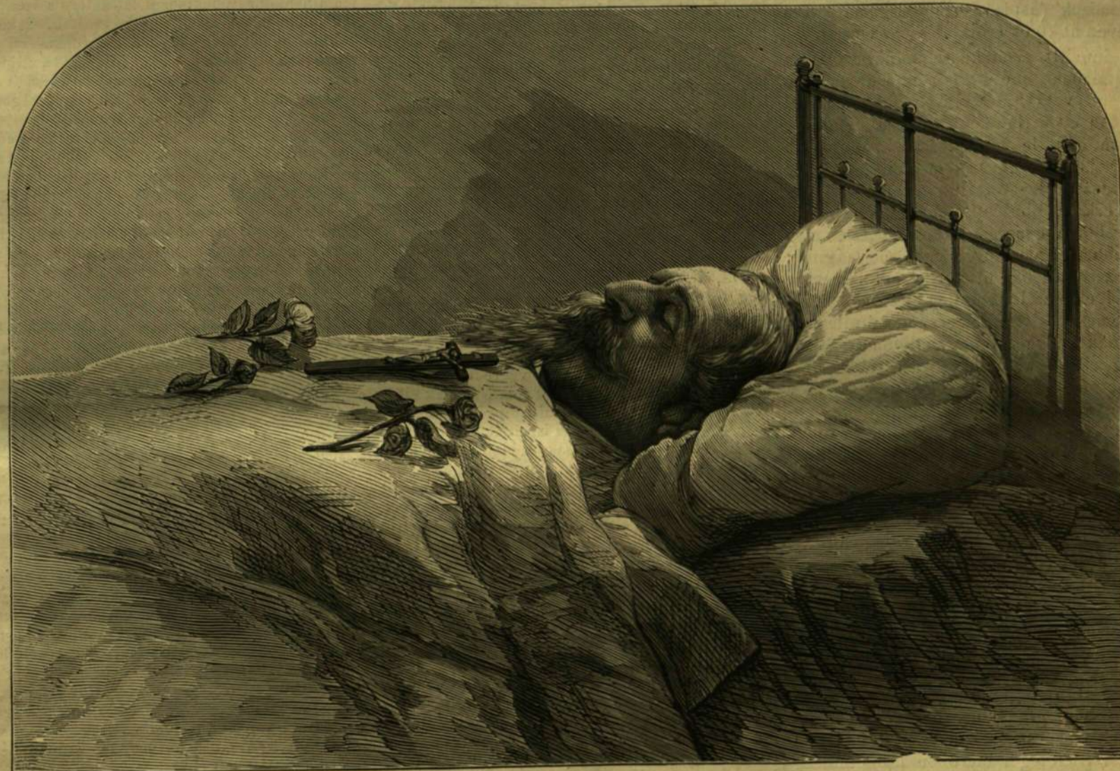
III. Napoleon a halottas ágyon (1873. január 10).

S e szempontból indulva ki, bármi nagy tiszteletet érezzenek is némelyek a történelem legfényesebb tüneménye I. Napoleon iránt, mindamellett természetesnek kell találniok, ha a világ közvéleménye pár huzam fölállításával szeret foglalkozni az