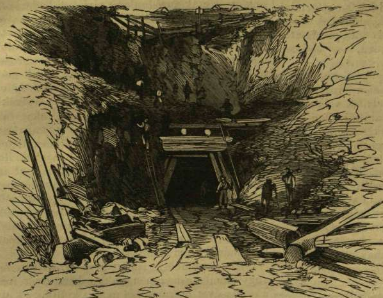
Az alszut északi bejárata Geschenennél.

A közép-ázsiai iskolákról szintén megemlékszik Wereschagin. Azt írja, hogy Taskentben, valamint Közép-Ázsiá más városaiban is a kisebb (elemi) iskolák a kisebb mecsetek, a felsőbb rendű tanodák pedig a nagyobb mecsetek közelében emelkednek vagy néha egészen elkülönítve állnak. Ez utóbbiak igen terjedelmesek s apró czelláakra osztott nagy épületeket foglalnak el; a czellákban tanulók laknak és az épület rendszeren tágas kerteket foglal magában. Taskentnek hét főiskolája van (medressze), és azok mindenikében bizonyos számú Mollah tanítanak. Tanító csak