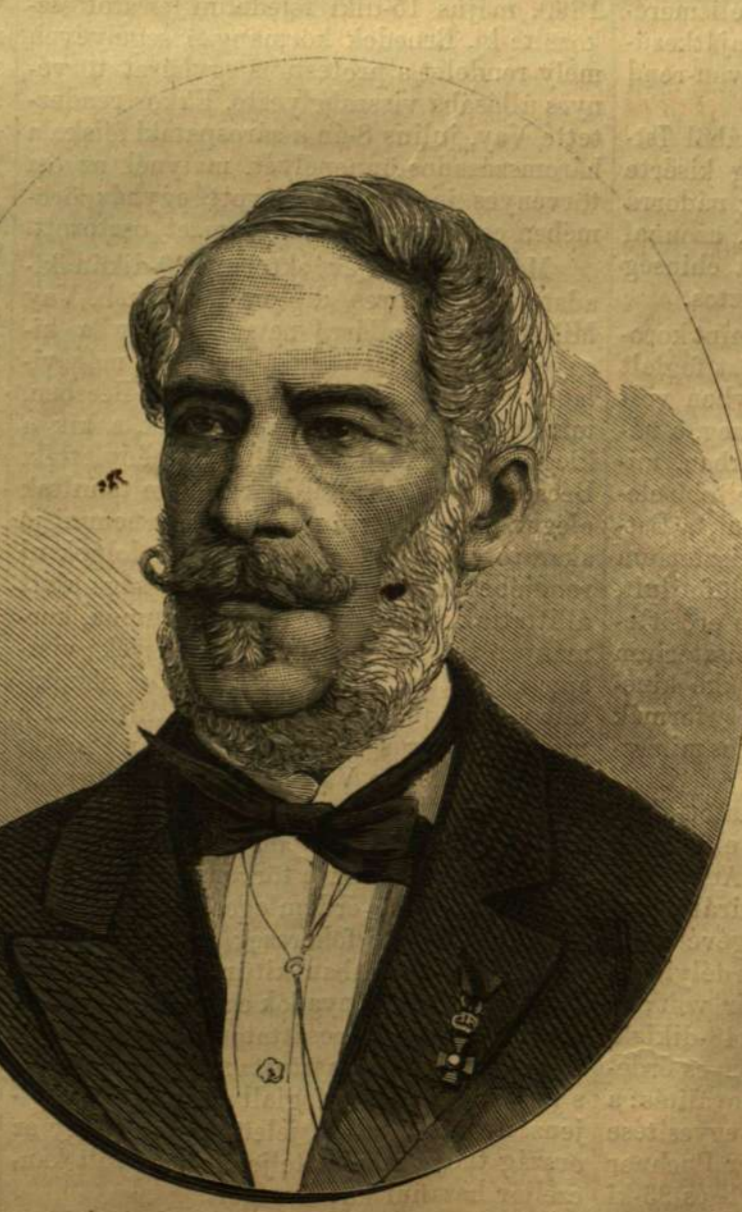
BARÓ VAY MIKLÓS.

A tisztánnevelő reformált egyházkerület mely 8-kán egy olyan ünnepeit rendez, mely a hegyelet ünnepe lesz az összes reformált egyházra nézve. Ez ünnepe baró Vay Miklós tiszteletére rendeztetik, ki épen a jelen év folyamában érte meg egyházi hivataloskodása ötvenedik évét, s az egyházkerületnek, melynek főgondnoka, sőt az egész ref. egyháznak, egyéb polgári kötelességeinek legsekélyebb sérelme nélkül, oly szolgálatoakat tett, hogy ez ötvenedik év méltán jegyeztetik föl a reformált egyház évkönyveiben mint b. Vay jubilaumának esztendeje. A magyar államnak és a magyar nemzetnek, a polgári téren szerzett érdemein kívül, oly diszere és hasznára való volt ez ötven éves pályája az autonom egyházi és iskolai életben is, hogy az ünnepeit felfelé arcképeinek és életrajzának ez alkalommal közlését a felekezeti körön kívül állók sem fogják idő- és alkalom-szerűtlennek tekinteni. Hiszen ez életrajz, mint egyéb egyházakhoz tartozó annyi más jelesünk életirata is, a nemzeti élet újabb fejlődésének mozzanataival folyvást együtt halad, s volt idő többször, mikor egyénisége annyira talált nehéz és bonyolult állami viszonyainkhoz, hogy Nyáry Pál találó kifejezése általános jellemző szóvá vált s Vayt a nemzet „a szükség embere“ tekintette. Hogy valóban a „szükség embere“ volt nehéz időkben: nagy érdeme; de az sem kisebb, hogy az alkalmas időkben végzett művei szintén a szükséges emberek sorában mutatják.