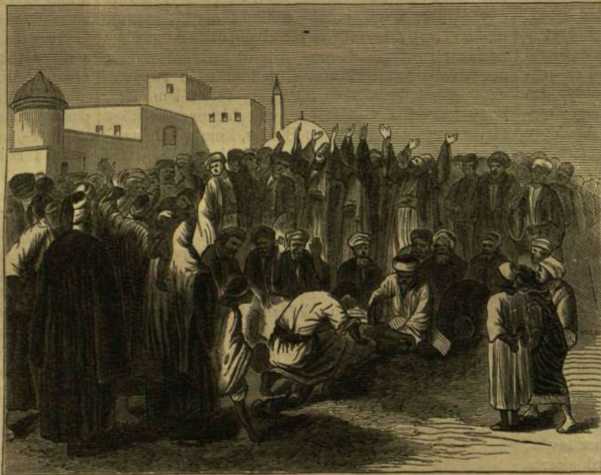
Kairói nászünnepe. (Bikák leölése.)

Páh, hagyjuk el ehelyet fiatal uracsai és csak keresztnevről ismeretes hölgyeivel, és menjünk a dunasor mentén tovább, a léposzözet rakpartra, hol egészségesebb és erőteljesebb életet akad meg