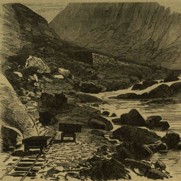
A Reusz völgye Geschenen mellett.