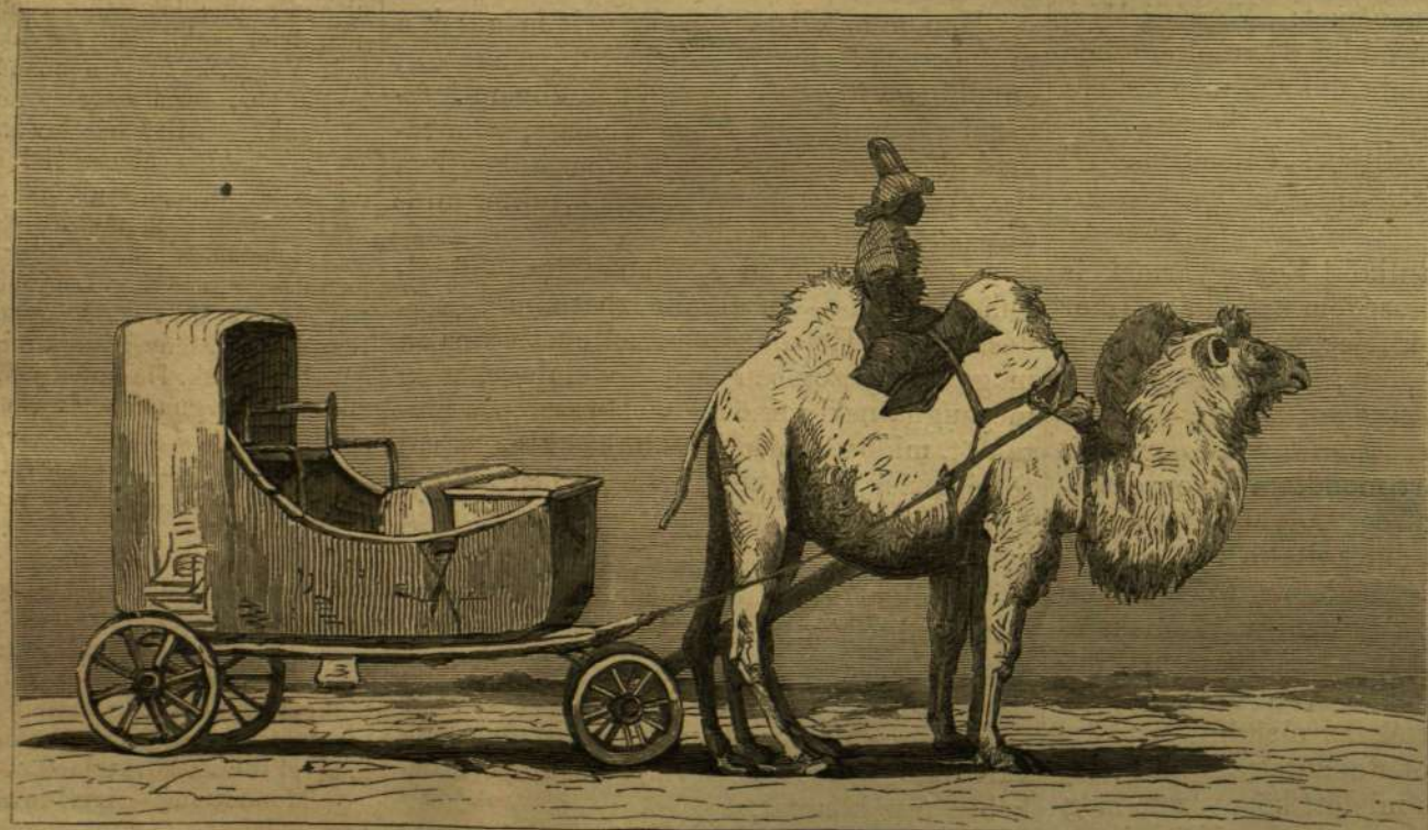
Képek Közép-Ázsiából: Teve-fogat.

lakóinak durva kegyetlensége talán semmiben sem nyilvánul oly szembetűnően, mint épen ama rut, barbar bánásmódban, melyben e szegény állatokat részesítik, noha nélkülök a kirgizek és tatárok csakugyan élni sem tudnának. Kétségtelen, hogy a tevéket más népeknél sem kímélik szerfölött, de másutt legalább orruknál fogva vezetik őket — még pedig a szó szoros értelmében. A kirgizek nem úgy tesznek, hanem mikor a tevé két éves, átfurják orrczimpáját s e lyukba egy pálcát dugnak és e