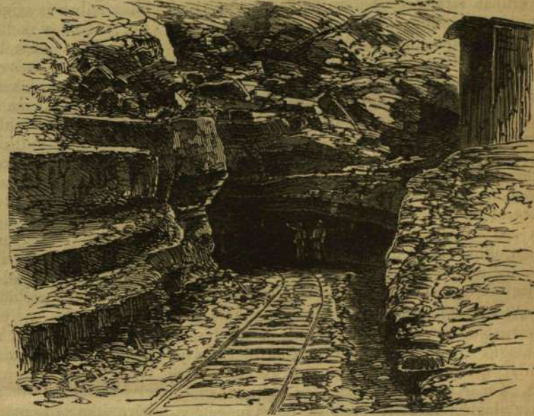
Az alszut déli bejárata Airolonál.