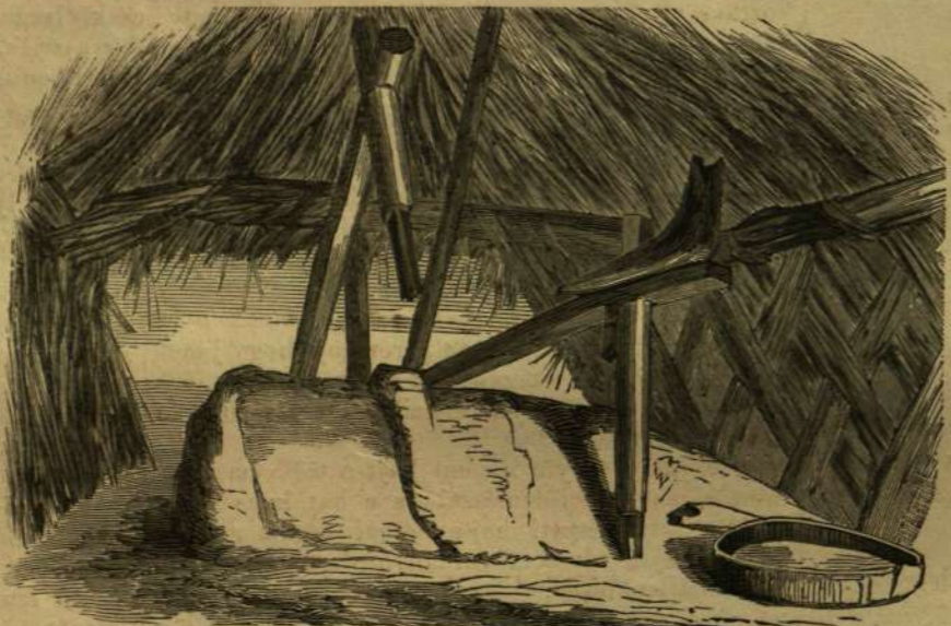
Képek Közép-Ázsiából: Egy malom belseje.

© (Seikh Abdul tevehajtsárnak a felesége meg-