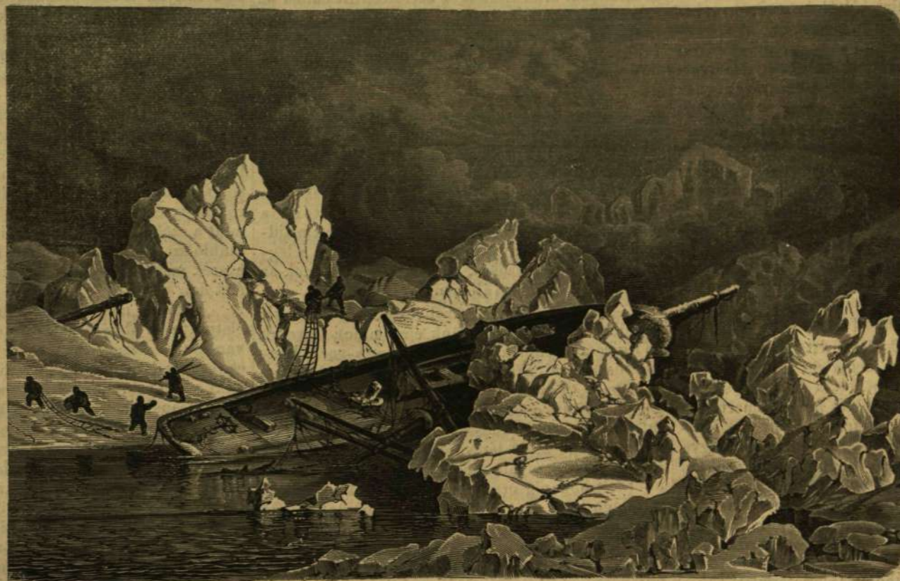
A „Hanza” hajó roncsa.

Számukra már csak a mentő csónakok maradtak, a miken végre csodálatos módon megmenekültek s 1870. jun. 15-én Friedrichthalban kikötöttek.