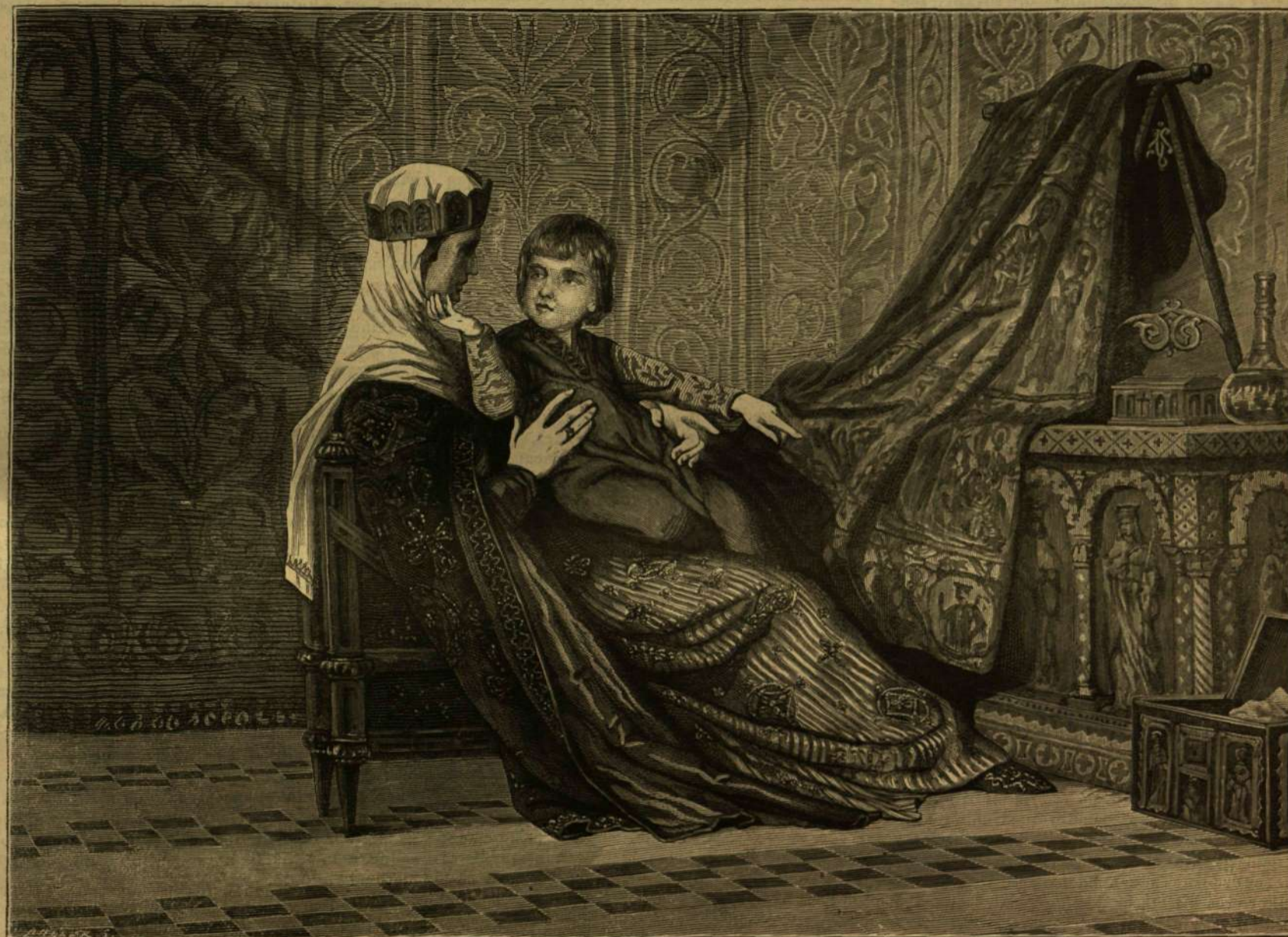
A Gizella-alumból: Gizella királyné és Imre hercege. — Székely Bertalan festménye után.)

Az a független ember, a ki edzett jelleme vagy ész-felsőbbsége által, erkölcsi szabadságát, gondolat- és érzemény-szabadságát még akkor is meg tudja tartani, ha akarata a körülmények szerencsétlensége és a külső erők nyomása által akadályoztattnak.