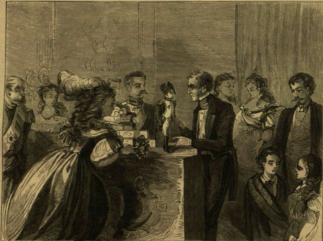
A „nagy” Wellington herezeg és a kis tábornok (Hüvelyk Matyi).

— (A cholera s a madarak.) Egy külföldi lap érdekes adatokat hoz föl némely madárról, melyek ösztönszerűleg mintegy megérzeni látszanak a cholera s a félrevonulnak a veszély elől. Egy porosz őrnagy, ki az 1866-iki porosz-osztrák háboru alkalmával július hóban Brunnben állomásozott, írja, hogy ez időben kivált a katonák közül igen sokan estek a járvány áldozatául, s a kimultakat előbb éji homályban temették el, de később nagy zene-szóval és énekkel adák meg a