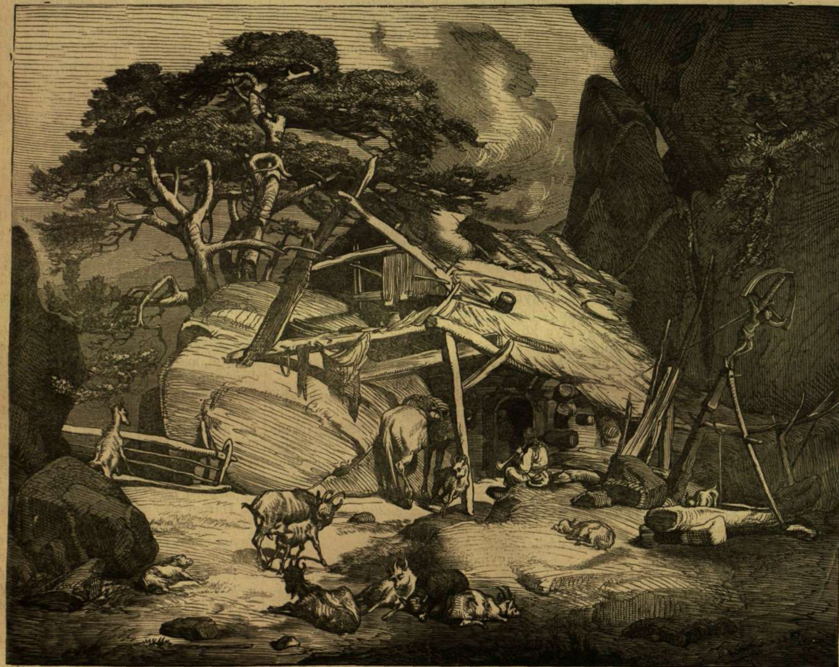
Kárpáti havasi kunyhó.

A Gizella-album, melyet hazai művészeink által Pest városa készített Gizella főhercegnasszonynak Lipót bajor herceggel egybekelése emlékeül s küldöttség által nyújtott át a fejedelmi menyasszonynak, jelenleg a bécsi kiállításon látható, hol már csak külső kiállítási díszé által is egyike a legértékesebb tárgyaknak a maga nemében. Ez azonban kiváló művészi kivitele dacára