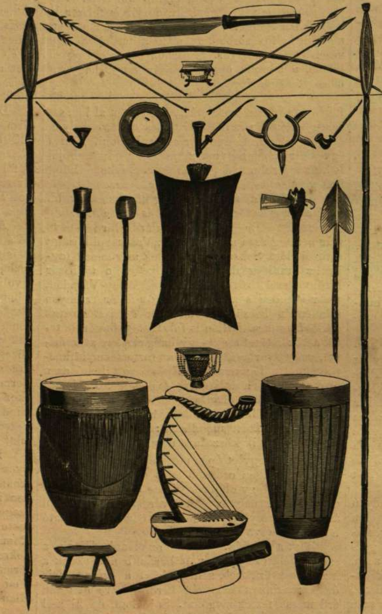
A Felső-Nilus vidékéről: A benszülötték fegyverei és házi eszközei.

A halott város nagy részét eltemeté a sivatag viharai által oda korbácolt fúto homok; a lég s az eső idők folytán igen tömörre gyurta e homokot. Az ezredes bár gondosan kutató, sem csontokat, sem pedig házi eszközöket avagy szerszámokat nem tudott fölfelezeni, sem pedig másnemű ereklyéket vagy műmaradványokat; kivéve azt a néhány cserépedénydarabokat, melyeknek sötét alapszínén ma is láthatók ama kékszínű virág- és egyéb díszítmények, a melyeket, mint látszik, valami elpusztíthatlan ásványvegyülből állítottak elő. Oly úde, oly szép, oly ragyogó színű cserépedényeket látott e romok közt az ezredes, mintha csak tegnap került volna ki a művész kezei alól. E cserépedények, teszi utána Ro-