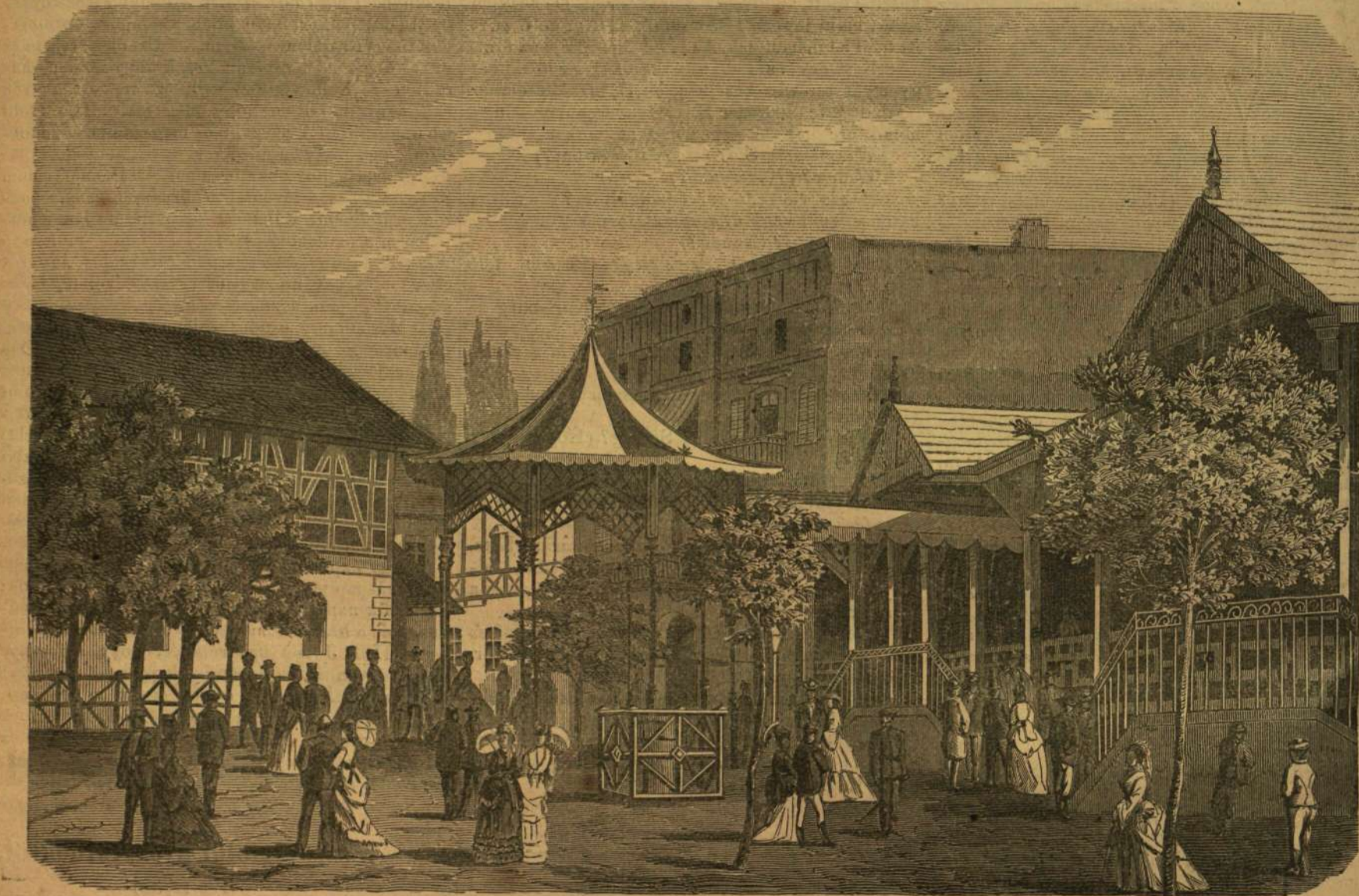
A főút Előpatakon. — (Fénykép után.)

Régóta ismerem a boldogtalant. Együtt tanultunk egy Kárpát-alji városban. Szegény övegy asszony fia volt, mégis sokat költött; csekély örökség nézett rá, mégsem tanult; általános elismert tökfűlkő volt, mégis nagyvágyú volt. Mindig uri leányoknak szokott udvarolni, kik bókjait ostobáknak, de magát szépek találták s mint jó tánczosal, legszívesebben vele táncoltak. Még alig volt