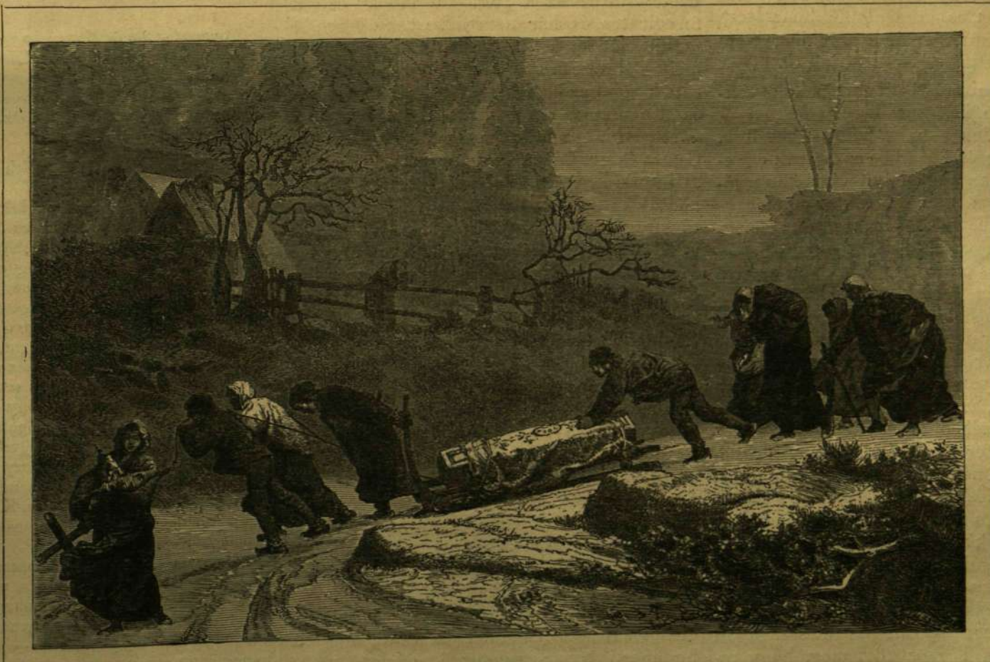
Temetés a Vogesekben.

fölforgató viharai ellen s a konzervatív szellem sehol nem üt oly állandó, háborítatlan tanyát, mint a hegyek között. Oda menjen, a ki az emberiségnek a természetben, a vérben gyökeredző változhatlan örök szükségleteit, a szabadságot s az erkölcsök romlatlanságát tanulmányozni akarja.