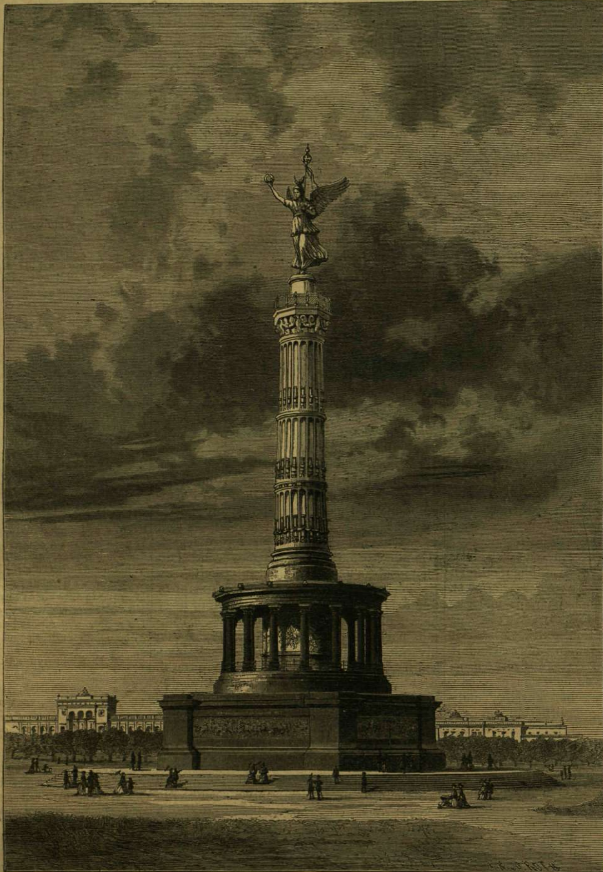
A győzelmi oszlop Berlinben.

Azt hiszem, hogy a fanebbi jellemző vonások meggyőzheték olvasóinkat arról, hogy a mi sirirataink költészet és humor, sőt bölcsészet tekintetében is, kiállják a versenyt az angol sírfölrá-