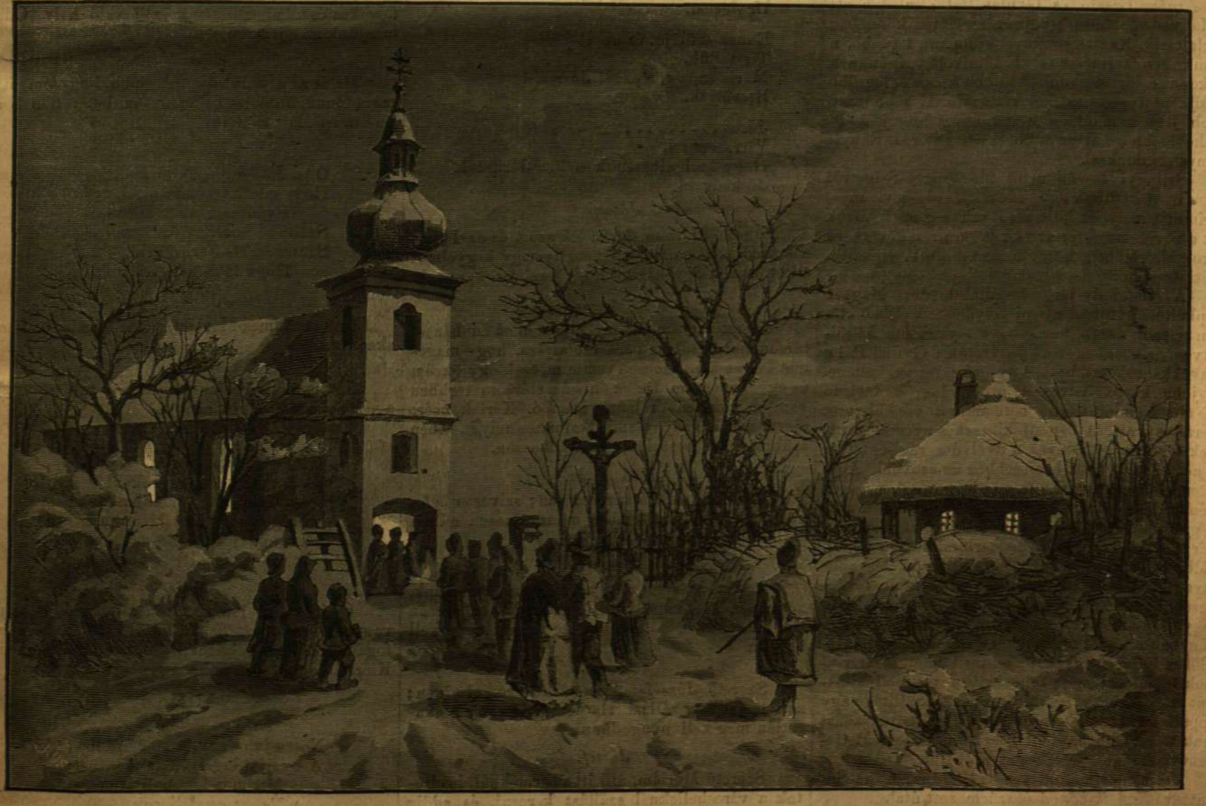
Templomba menők karácsony éjszakáján.