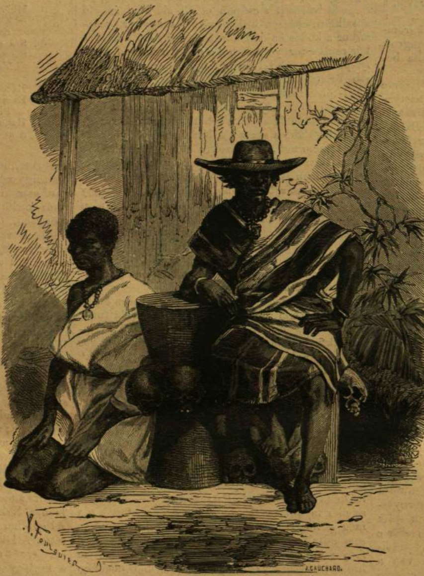
Néger királpár Nyugat-Afrikában.

olvassa, hogy vannak emberek a föld kerekéségén, kiknél a legnagyobb erény az, mely a mi fogalmaink szerint a legiszonyubb bün. Ha ilyen embertelen szörnyeket igyekeznek a művelt európaiak civilizációknak meghódítani (a mely törekvés egyébaránt e vadnépekre nézve még eddig majdnem egyenértékűnek bizonyult be a végleges kizusztással) sokkal inkább méltányolhatjuk számukukat, mint azt az eljárást, melylyel a békés, szelid lelkűtű s csakis a fehérek igazságtalansága miatt elkezeredett és kegyetlenné lett amerikai indiánokkal szemben követték el. Így az angoloknak az asbantik ellen mostanában megindított hadjárait is helyesléssel fogadják az egész művelt világ a meggyalozott emberies érzelmek nevében s a végleges győzelem ama gyilkos nép/aj ellen igen kívánatos minden tekintetben. Mellékelt rajzunk egyik leghíresebb nyugot-afrikai uralkodót mutatja kedvező nevével együtt. A koponyákkal díszített királyi szék legtalálhatóbb jellemzi e szörnyeteg uralkodásának egész tartamát. Ó legtovább ment az emberlés kultuszában, s nem volt családjában és udvarában olyan ünnepély, bár a legcsekélyebb jelentőségű is,