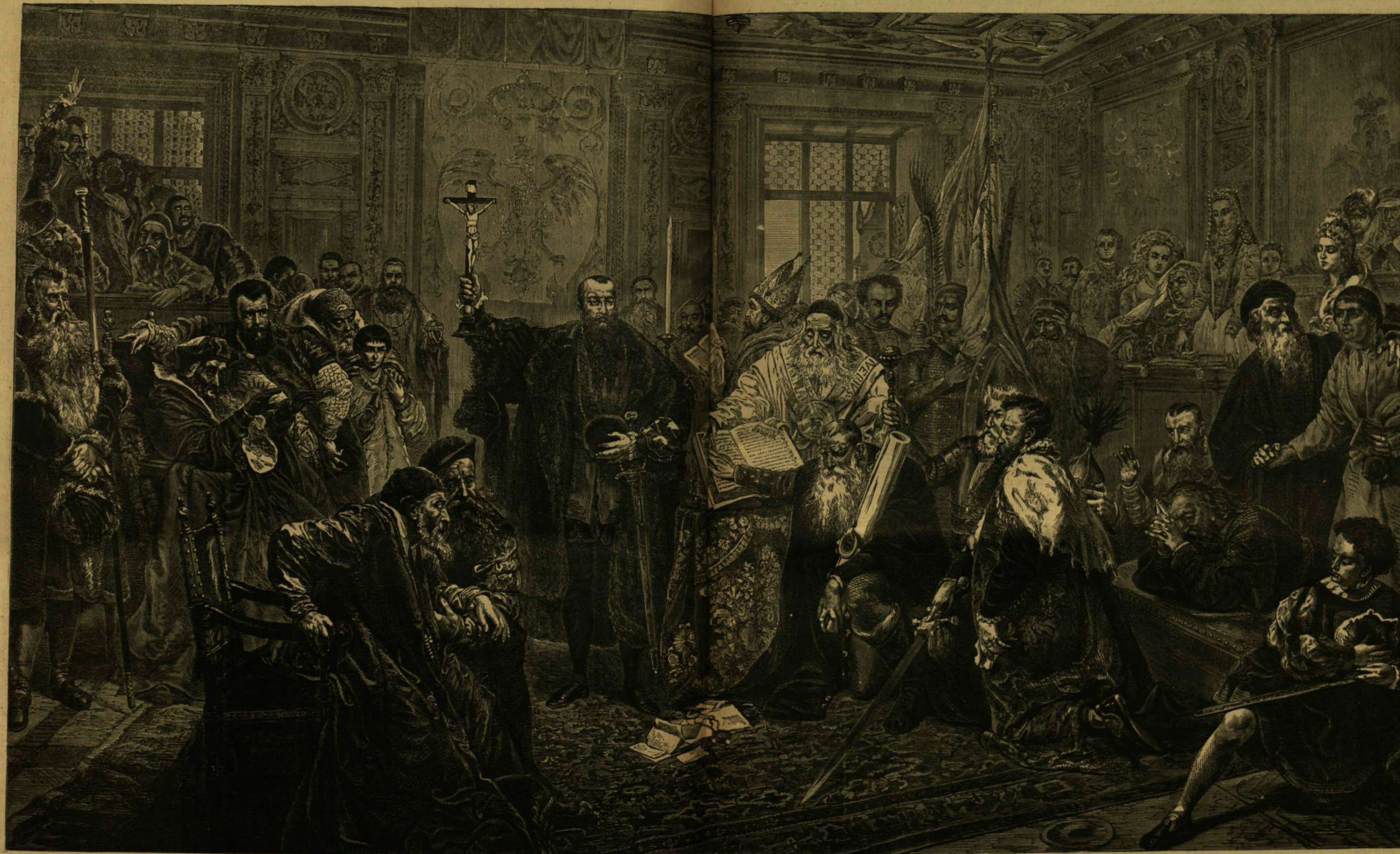
A lublini unió (1569). — Matejko János festménye után.

Már a legrégebb klasszikai hagyományokban is találkoznak kertekkel. Alanous gyümölcsös kertje, melyről az Olyssa hetedik énekében tesz említést Homér, már nem nélkülözte a szabályságot; egyik fele nyit, a másik árnyékos volt, virággyak ékítették, füge-, olajfák, venyigék virultak benne és két forrás szolgált felüdítésre. Sem ramis függő kertjeiben már az építészeti nagy szerepet játszott, a mennyiben az amphitheatr ilis alakban egymásra helyezett emelvényeket ott oszlopok tartották fenn, melyekből terebélyes fák ütötték ki koronájukat. A hajdani Görögország nyilvános kertjei a szellemi és testi erők edzésének valának fenntartva, és mind Spár-tában, mind Athéban kertekben tanítottak a