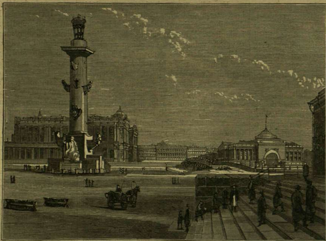
SZENTPÉTERVÁRI KÉPEK: A Tőzde-tér.

középületekre: a Wasili-Ostrow-ra, művészek akadémiájára, hadapródok nevelő intézetére, stb. A rakpart egyik legkiválóbb pontján, a Tőzde-tér közelében emelkedik az a két tömör hajózási oszlop (milyenek a régi Rómában a columna rostrataék voltak), melyek közül az egyik mellélt rajzunkon látható. E hatalmas oszlopok 100 lábnál maga-