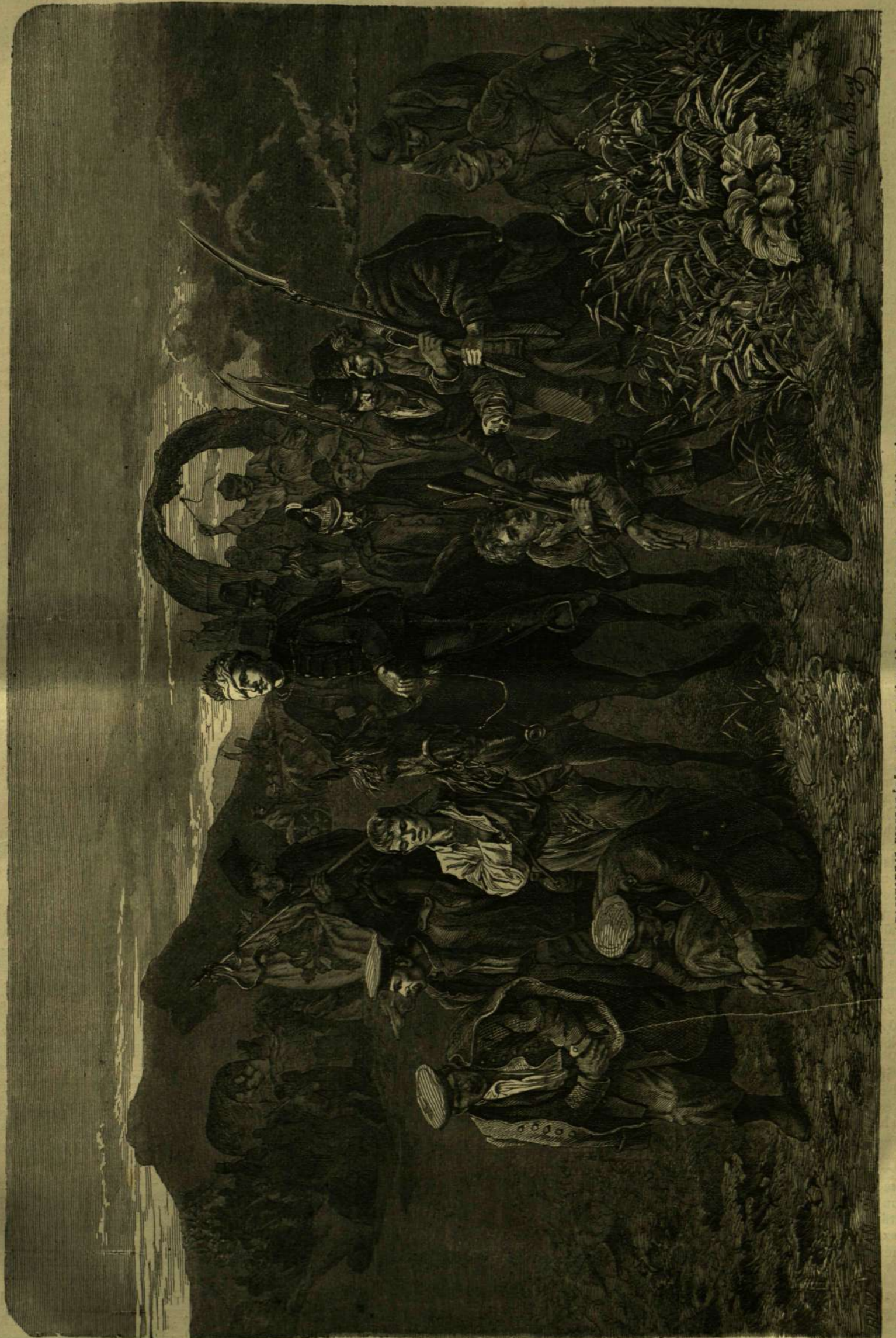
FOGLYOKKAI VISSZATÉRŐK. (Jelenet a honvéd életről) — Muntácsy Mihály rajza.