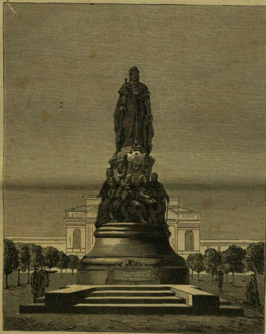
SENYTÉRTVÁRI KÉPEK. II. Katalin czárnő szobra.

„valóban.“ De meggyőződve, hogy egy lélek sincs, a ki látná vagy hallaná, egyszerre neki bátorodott kijelenteni Tretherickné előtt, hogy ő egész életében önzetlen nemesszivűsége törekedett; ez volt szerencsétlensége. Sok hölgy, — mint lovagias férfit föl fogja menteni attól, hogy neveket említsen, — sok szép hölgy kereste társaságát, de nem találva föl bennök a mit kerestett, nem viszonozhatta érzelmeiket. De oh, ha két, teljesen öszhangzó lélek, — mindkettő egyaránt idegen a romlott társadalom szennyes üzelmetől, s az aljas önzés játéktól, de a hű alszentelkedés bevett fogalmainak békójától is, — ha két, teljesen öszhangzó lélek találkozik s költői egyesülésben olvad össze, oh akkor — de itt az ezredes beszéde, mely rendszeren úgy folyt, mint a víz-és pálinkakeverék, egyszerre zavarba jött, elvesztette összefüggését s alig hallható susogásba veszett el. De talán Tretherickné már szokva volt az olyan beszédhez, s ki tudta tölteni a szók hézagait. Annyi bizonyos, hogy az ezredes felőli arca szűzi pirulással ömlött el — mig utjok céljához értek. (Folyt. köv.)