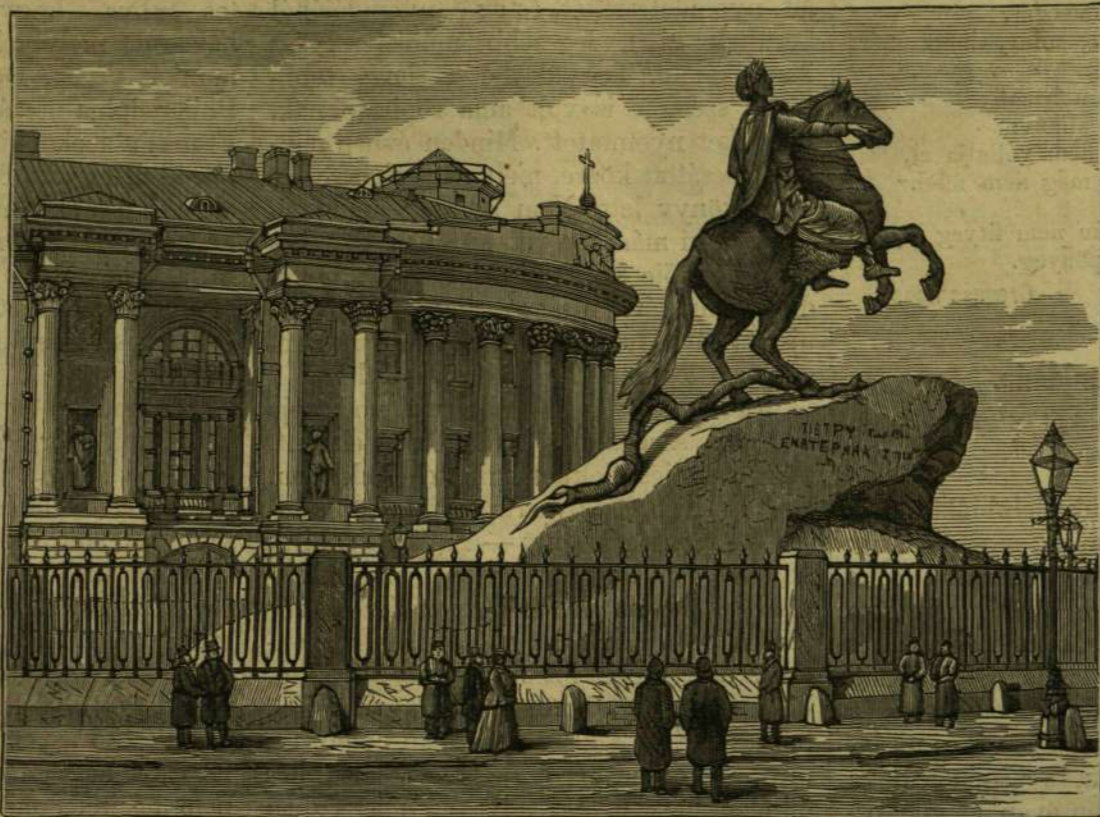
SZENTPÉTERVÁRI KÉPEK: Nagy Péter csár szobra.

építménynél, úgy e rakpartnál is alig tűnik ki a munka óriási volta kívülről. Egyik oldalán pompás palotasor emelkedik, melynek nagy részét angolok építették, de most előkelő oroszok tulajdonait képezi; másik oldalán gyönyörű kilátás nyílik a Néva széles tükreire s a rajta nyüzsgő hajókra, csónakokra, diszes gondolókra és a tuloldalán emelkedő nagyszerű