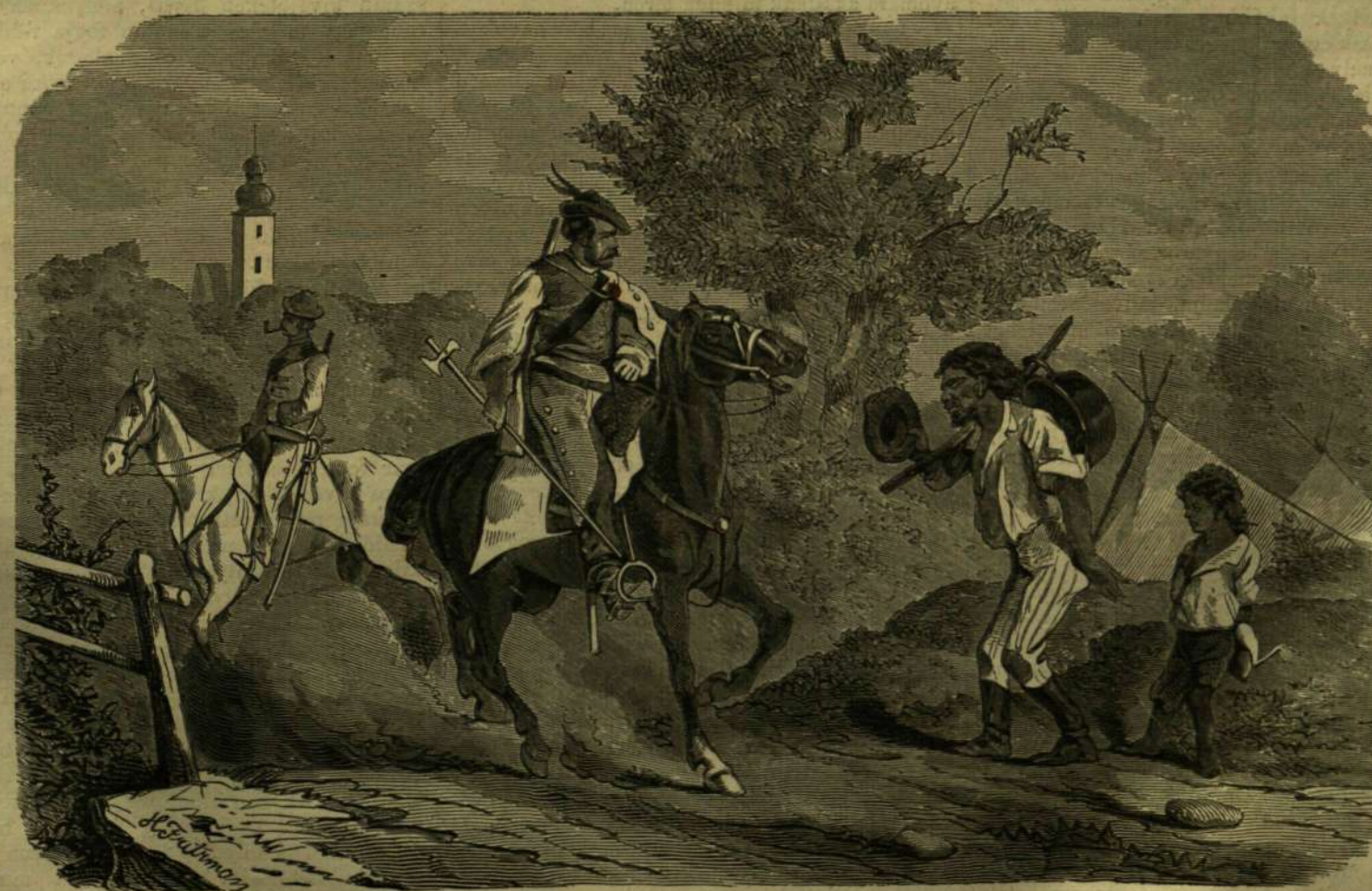
AZ ELSŐ VALLATÁS. — (Frígyes rajza.)

E kis országban, melynek lakossága alig mulja felül a négy milliót, több lap van, mely 30-40 ezer előfizetővel dicsekedhetik, két egyetem, s mintegy 30 virágzó tudományos testület. Ily országban természetesen nem feledek el azokat sem, kiknek köszönheti a nép leginkább műveltségét s szabadságát. A tanitók jól vannak díjazva s aggkorokra tisztességes nyugdíjban részesülnek. Epen ily jól gondos-