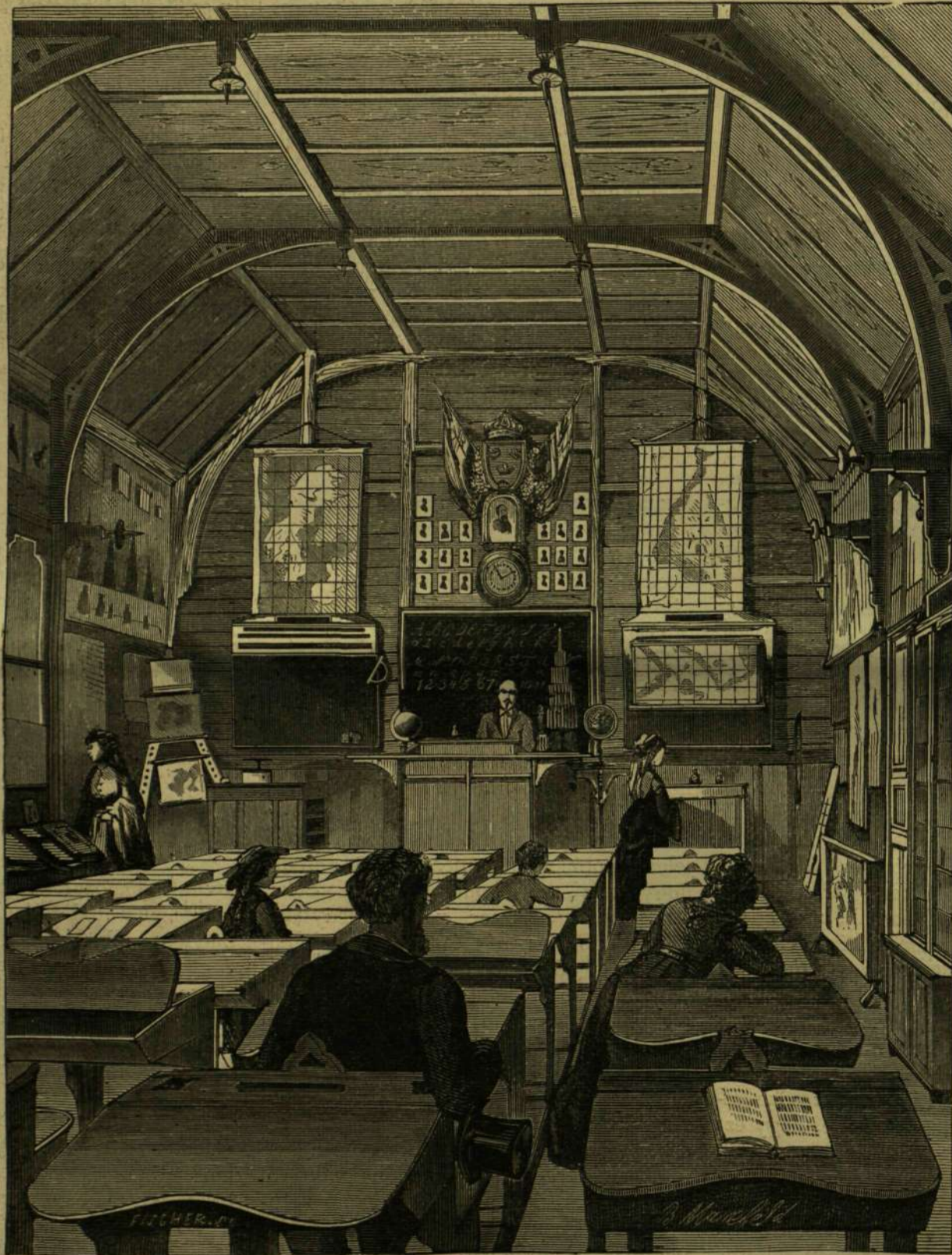
SVÉD NÉPISKOLA TANTERNE.

„Itt nyugszik Franklin Benjamin, nyomdász.“