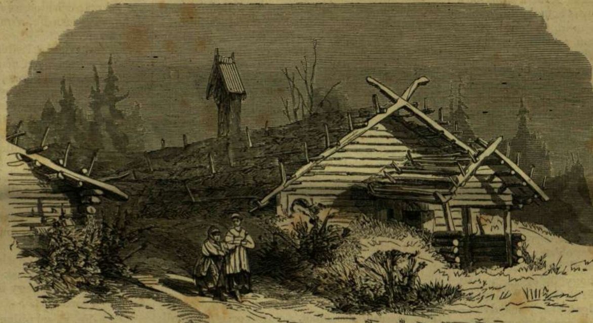
OROSZ PARASZTHÁZ. (Iszba.)

Az orosz falvak (már t. i. a birodalom északi tartományai) mind egyforma terv szerint vannak építve, úgy hogy a ki egyet látott, annak széről is kellő fogalma lehet, s a ki kettőt meglátogatott, mindnyáját ismeri. Többnyire csak két házból, helyesebben mondva kunyhóból állanak, melyeket széles és természetesen — sáros, piszkos utca (egyszeresmind rendszeren ország-ut is) választ el egymástól. Minden lakás külön, elszigetelten áll. Vannak, főleg északon, falfak, melyek alig állnak többől 10—12 kunyhóval; azonban már lejjebb délfelől olyanok is vannak, melyek 60, 80, sőt 100-nál is több házból és kunyhóból vannak összetéve. A házak és kunyhók teljesen hasonló fenyőtörzsekből építve s ezek a legapróbb részletekig egyformán vannak kifaragva és egymáshoz illesztve. Csoda-e tehát, ha egyik ház ugy hasonló a másikhoz, mint tojás a tojáshoz, s legfeljebb csakis nagyság tekintetében vehető észre köztök némi különbség. A falu előjáróját például többnyire nagyobb terjedelmű, vagy helyesebben mondva, nem oly szűk, mint a többieké; nagyságban ezután mindjárt a falu korcsmárosát következik. A házak és kunyhók falainak kimeszelése, vagy éppen kifestése ismeretlen fényezés előttök, és így a homlokzatot képező fenyőtörzsek az eső és füst hatásától csakhamar megfeketülnek. Az egyes házak közt eső tér majd sehol sincs kerítéssel körülvéve és szemetes, sáros fertőt képez, a melynek közepén a