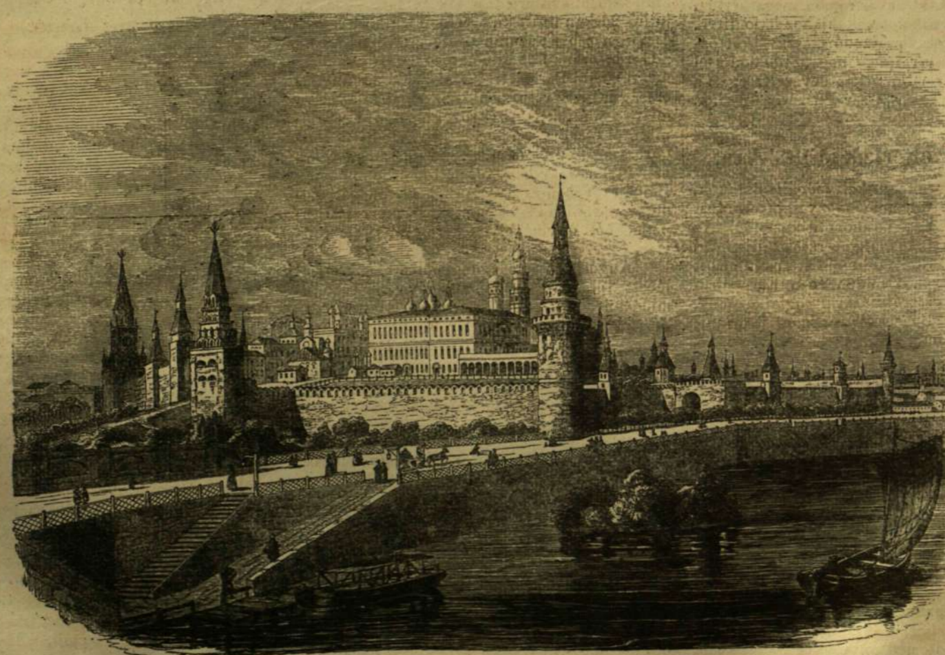
A KREMLIN MOSZKVÁBAN.