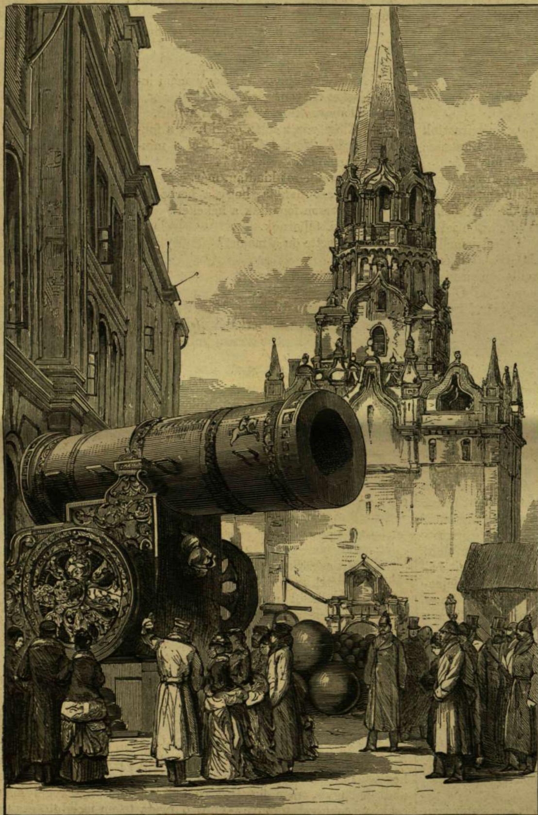
„CZÁR-PUSKA,“ a moszkvai nagy ágyu.

Az erdő egészen a majorig nyult. Hamar csináltak egy hordágyat galyból és harasztból, föltették rá a még mindig mozdulatlan asszonyt, s megindultak vele az erdőbe, egyik paraszt fejénél, másik lábainál emelve a hordágyat; Tellmarch karját