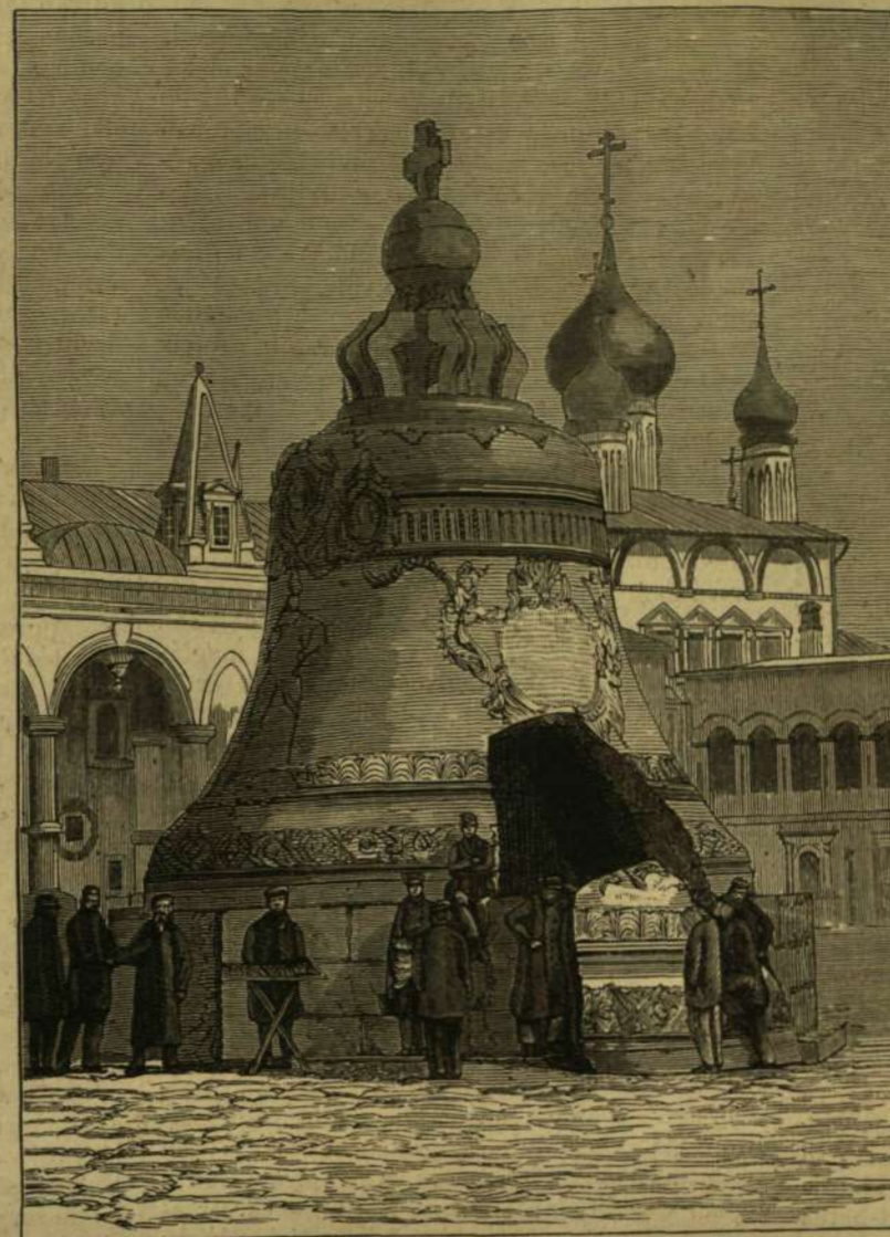
„CZÁR-KOLOKOL,“ a moszkvai nagy harang.

A vén Moszkva, az oroszok szent városa és a birodalom legrégebb s jelenleg is második székhelye, szintén osztozkodott az ifju Sz.-Pétervárral a nemrég lezajlott nagy ünnepélyekben, melyeknek hosszú sorát mult hó 24-én az osztrák-magyar uralkodó látogatása és elutazása