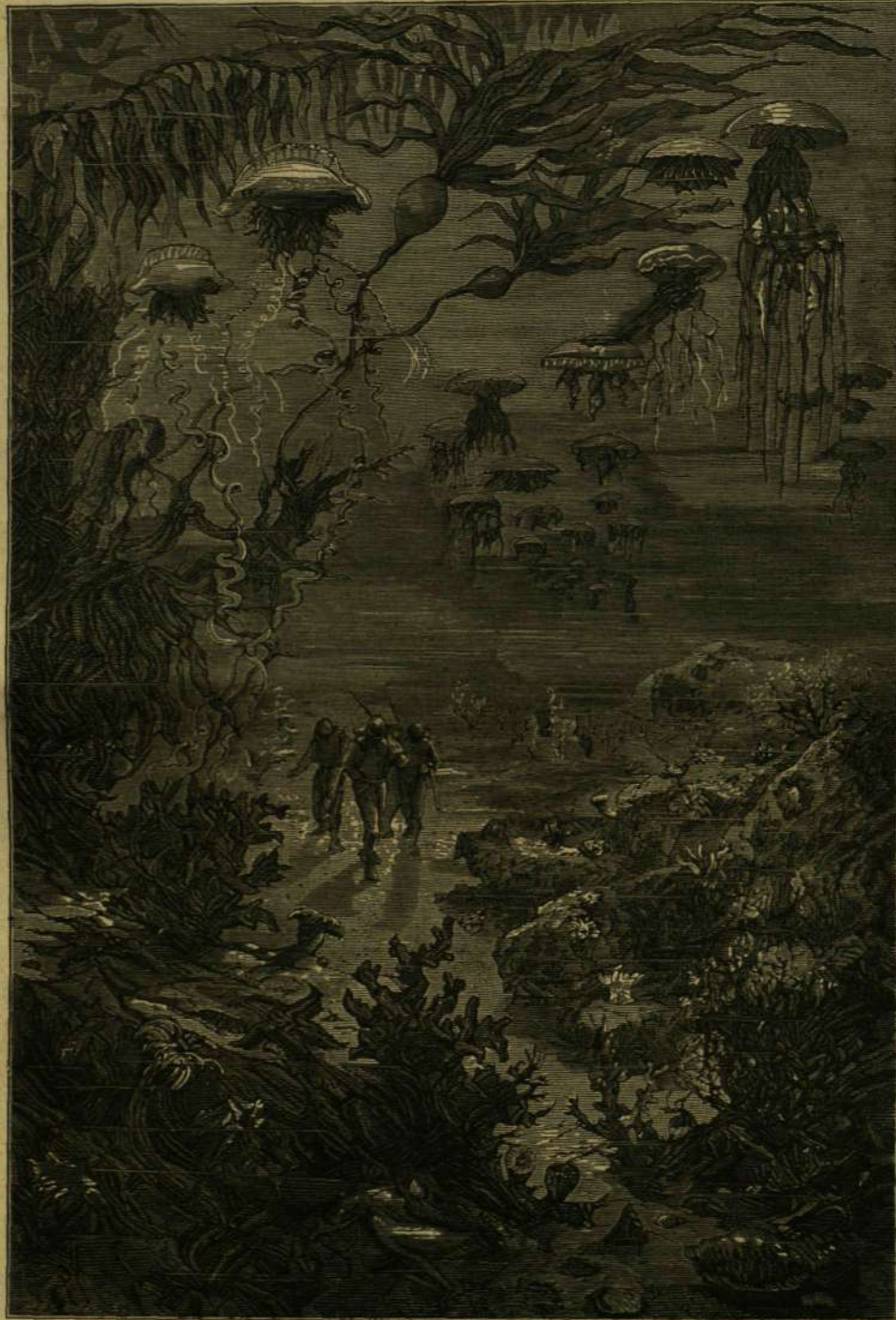
UTAZÁS A TENGER ALATT: A Crespo-szigeti erdőségek.

Nemo kapitány megállott. Nem akart a szárazra lépni. Megfordult s ismét élére állott a már visszatérő kis csapatnak. De nem azon az uton tértek vissza, a melyiken ide jöttek. Ugy látszik, Nemo kapitány tökéletesen tájékozva volt a tenger-fenéken s rövidebb utat választott a visszatérésre, épen mint egy táj-ismerő kalauz tenné a száraz erdőségekben. Rövidebb, de nehezebb is volt az ut; legalább eleinte, mert a tengerfenék egyenetlen, durva,