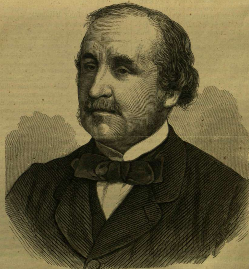
BROGLIE HERCEG, FRANCZIA MINISZTERELYÖK.