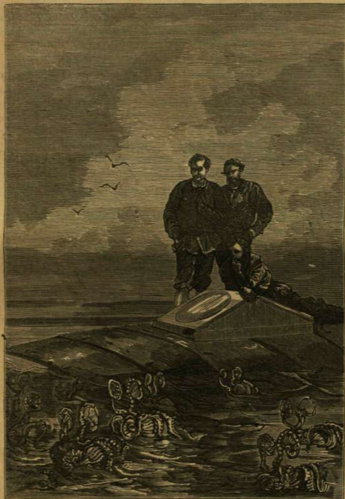
UTAZÁS A TENGHER ALATT: A hajós esigák.

— „A gyöngy, derék Ned barátom, — válaszolá a tanár, — a költőnek: az oceán könyve; kelet fiainak: egy meggejezült harmat-csöpp; a hölgyeknek: tojásdad ékszer, halvány tejfényvel, melyet ujjakon, fülökben, nyakukon viselnek; a vegyésznek: phosphor-szerű éles mész-anyag, egy kevés állati enyvel