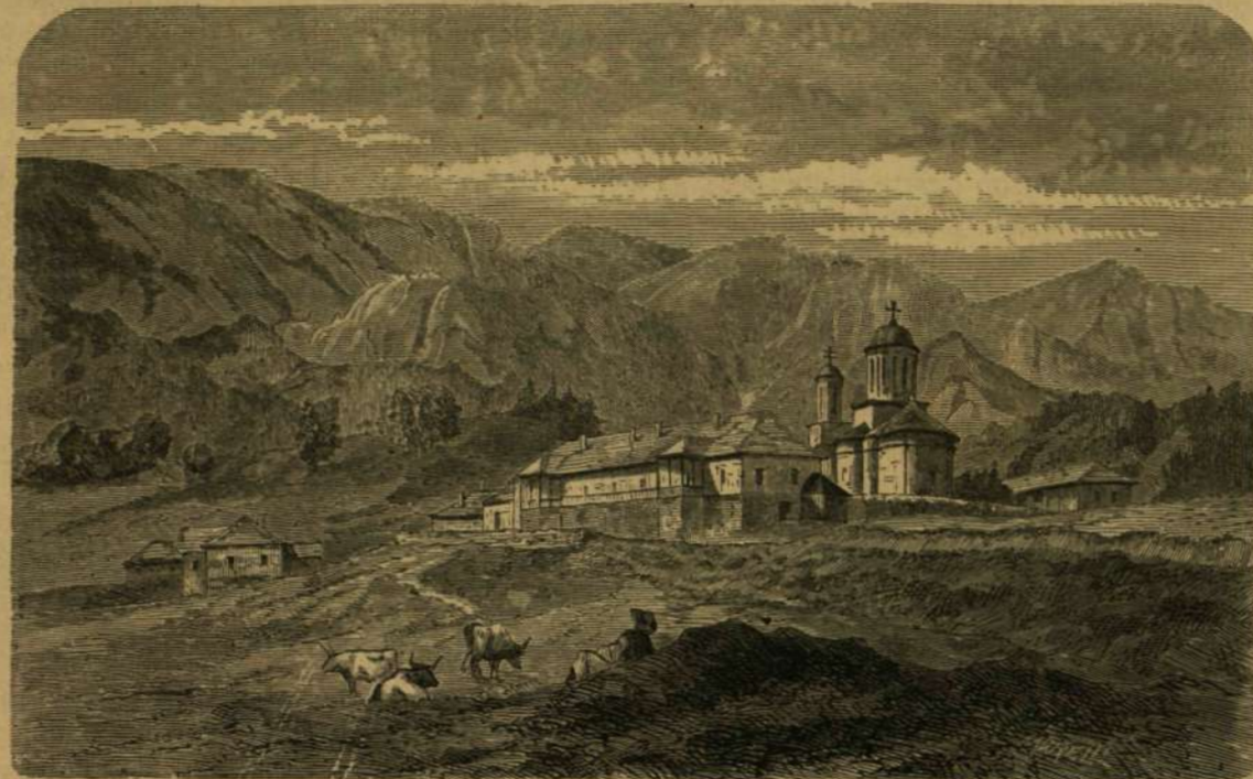
A sinai kolostor a Prádova völgyében.

A vidék, mint a délkeleti Kárpát-öböl általában s különösen Brassó-vidék egészen, a legszebbek közé tartozik. A vadregényesnek minden elemei: a havas bércz, a rengeteg erdő, a havasi patak és vizesés, a barlang és a hegy-szoros, mind megvan benne. De mellette közvetlenül szelid völgyek nyílnak térs lapályra,