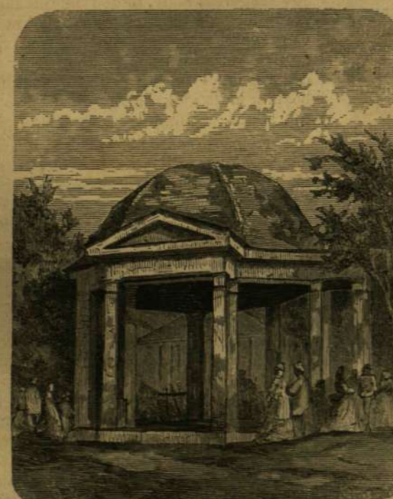
A zajzoni Ferdinánd-forrás.