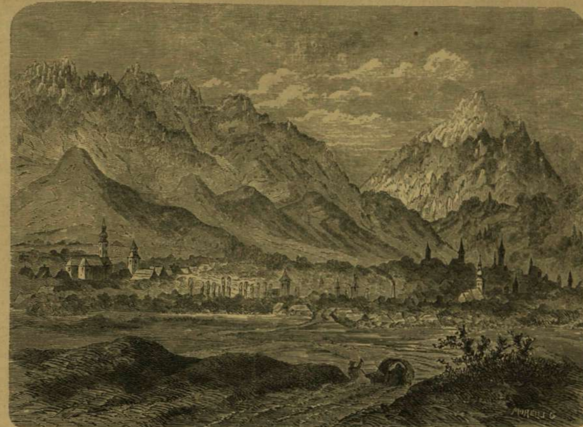
A Hétfalu négyes csoportja.

A tömösi szoroson fölül (keletre) a Nagy-