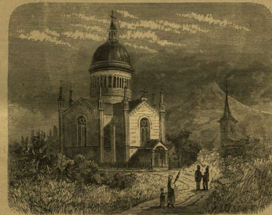
A türkősi kupolás-egyház.