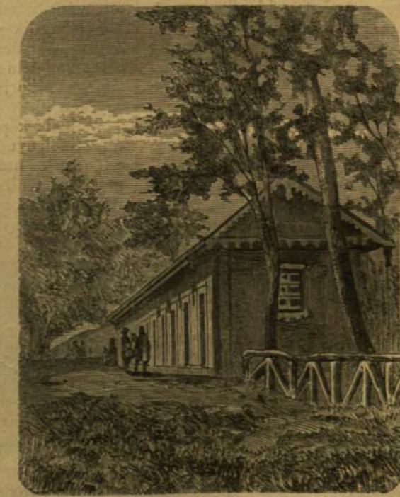
A zajzoni melegfürdő épülete.