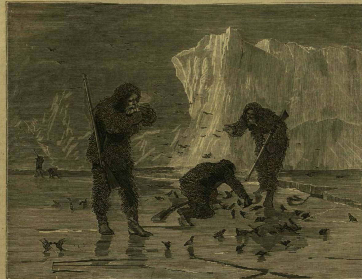
AZ ÉSZAKI SARKVIDÉKEN: Kenderikék és barázdabillegetők.

ha egyszer a forrponot elérte. Az egyszerűen csak megolvastott hó keserű s a szomjuságot nem szünteti meg; ellenben fölforralva és azután kihűtve olyan jóízűvé lesz, mint a legjobb forrásvíz.“