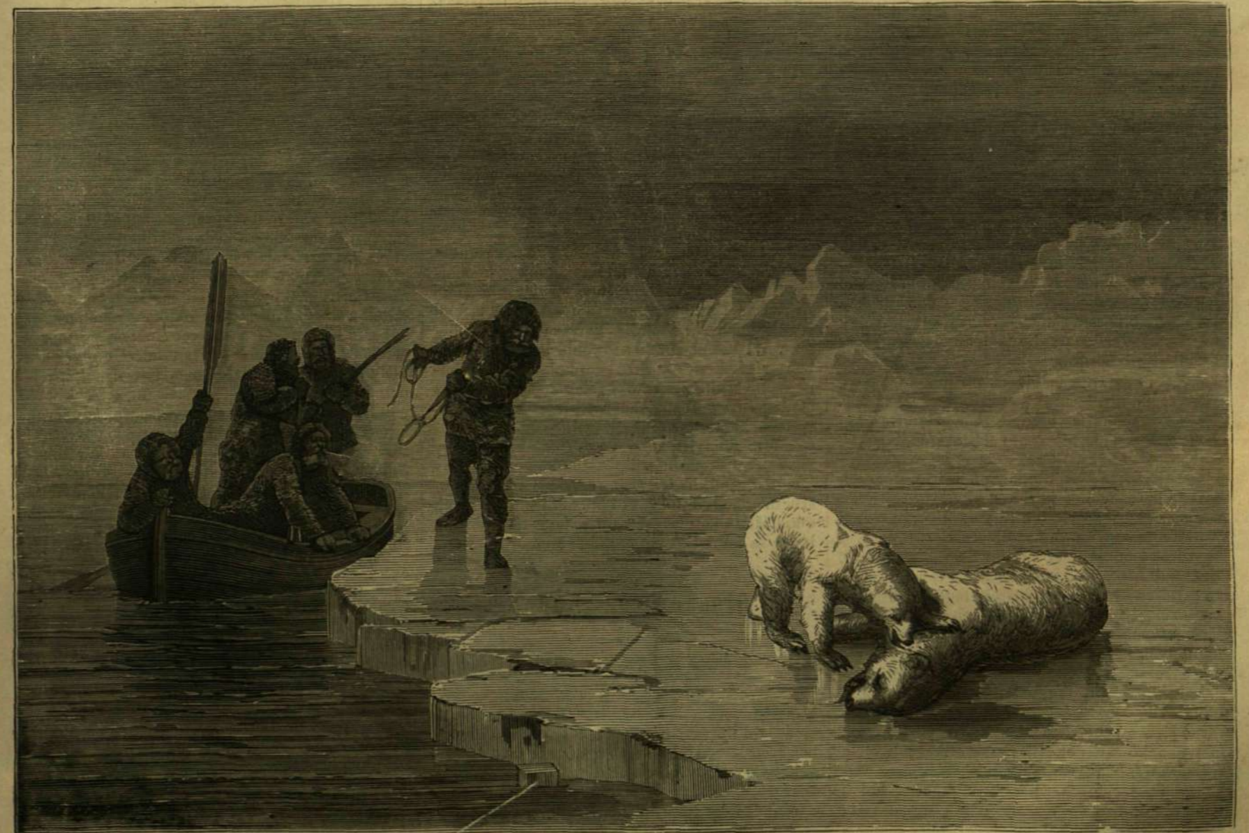
AZ ÉSZAKI SARKVIDÉKEN: Medvevadászat.

tévedező karavánokkal ugyanegy közös bajban szenvednek, hogy kiszáradt ajkaikat a jéggé merevült tenger közepette ők sem képesek fölűdíteni, s hogy a hó, melyet szájukba vesznek, még fokozza égető szomjuságukat! Már Parry